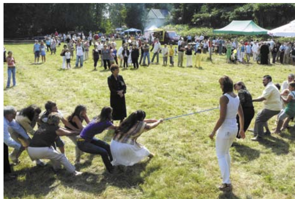
Przeciąganie liny to tylko ułamek atrakcji pikniku

Pierwsze kramiki i stoiska na placu przed kościołem, pojawiły się jeszcze przed godziną jedenastą. Kolorowe zabawki, wyroby cukiernicze i wiele innych produktów, wzbudzało zainteresowanie zarówno młodszych jak