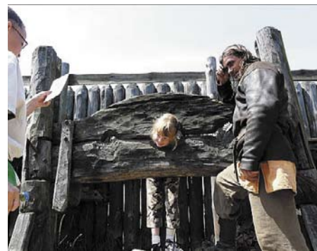
Wizyta w Ryni była przepiękną atrakcją

W lipcu akcja przeniosła się do Jabłonna. Opiekunowie, w tym również wolontariusze, przygotowali dla blisko sześćdziesięciorga uczestników, zajęcia sportowe, edukacyjne i rekreacyjne. Była też nauka obsługi komputera i Internetu, zawody sportowe, wycieczki, pokazy filmowe, sesje zdjęciowe, zajęcia plastyczne, teatralne i taneczne. Dzieci odwiedziły ponadto aqu-