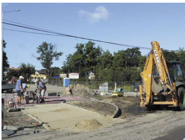
Parking na ulicy Szkolnej zmieści 50 aut

Prace budowlane na ulicy Szkolnej rozpoczęły się w połowie lipca. Na początku wykarczowano teren i przygotowano grunt pod dalsze działania, które rozpoczęto zaraz po wprowadzeniu na plac ciężkiego sprzętu. Projekt budowy zakładał powstanie 41 miejsc dla samochodów osobowych, 1 miejsca dla autobusu i 4 miejsc dla