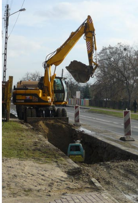
Budowa kanalizacji na odcinku S1 - Urząd Gminy Jabłonna

Z pomocą WFOŚiGW Gmina Jabłonna zrealizowała również kolejne inwestycje polegające na budowie kanalizacji. W ramach inwestycji w ul. Modlińskiej na odcinku od ronda S1 do Urzędu Gminy w Jabłonie stworzyliśmy możliwość podłączenia do kanalizacji 123 posesjom. Kolejne budynki, jakie mogą skorzystać z gminnej sieci kanalizacyjnej to domy zlokalizowane na odcinku od ul. Królewskiej do ul. Ze-grzyńskiej 2 w Jabłonie, z czego trzy to budynki wielorodzinne.