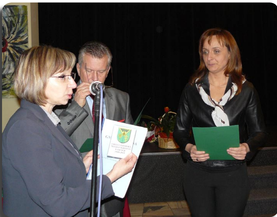
Moment odebrania mandatu radnego i Statutu Gminy Jabłonna był pełen wzruszeń