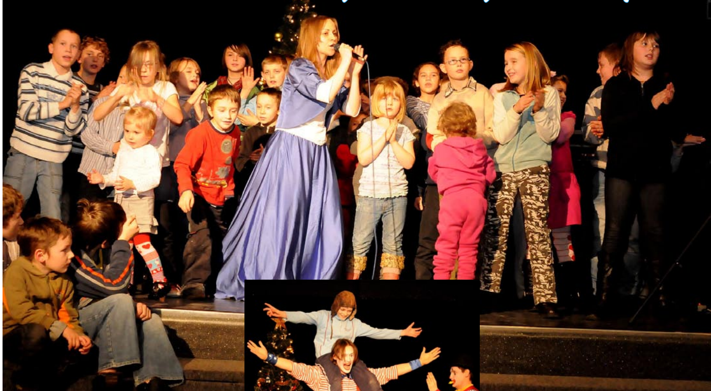
Dzieci chętnie uczestniczyły w grach i konkursach

Dzięki zaangażowaniu sołtysów, władz gminy, sponsorów, rodziców oraz radnych, dzieci z naszej gminy mogły bawić się na kilku imprezach choinkowych. 14 grudnia 2010 roku w chotomowskiej filii GCKiS odbyła się choinka dla dzieci z placówek opiekuńczych i objętych opieką Gminnego Ośrodka Pomocy Społecznej.