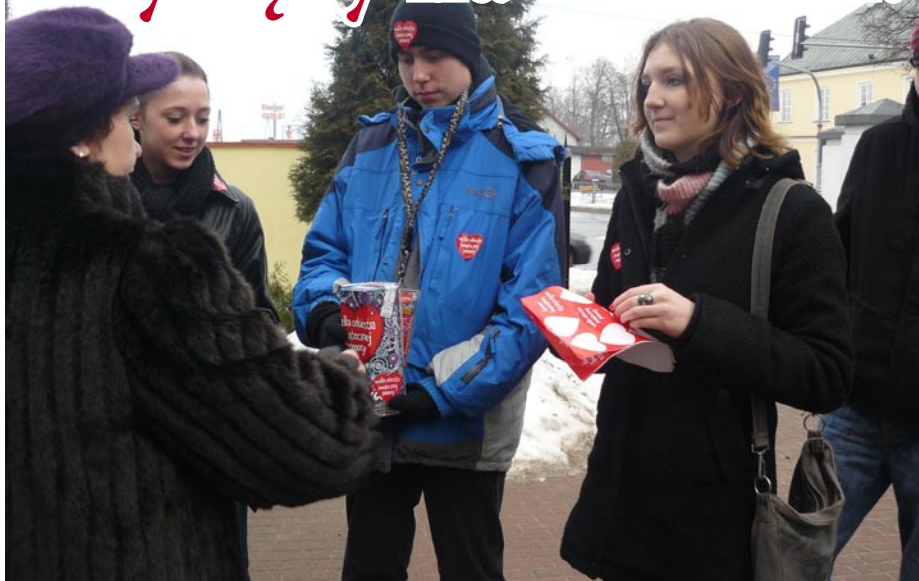
Pieniądze zbierało 16 grup wolontariuszy

9 stycznia 2011 roku po raz dziewiętnasty zagrała Wielka Orkiestra Świątecznej Pomocy. W naszej gminie udało się zebrać ponad 9 tysięcy złotych.