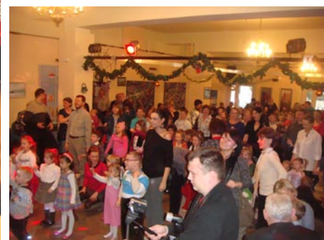
Zabawa dla dzieci z Suchocina, Skierd, Janówka, Trzciana