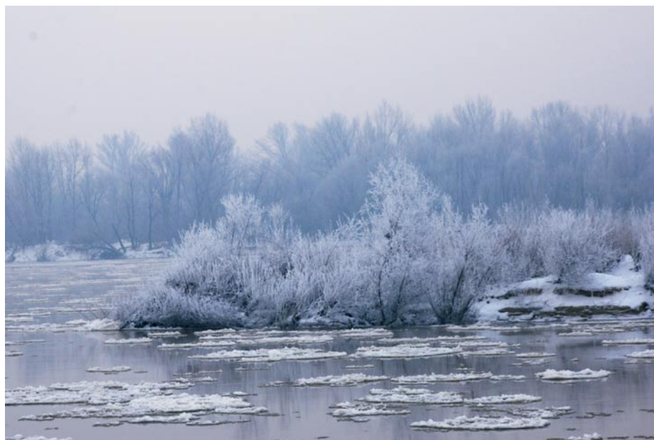
Wisła nadal w znacznej części jest zamrożona