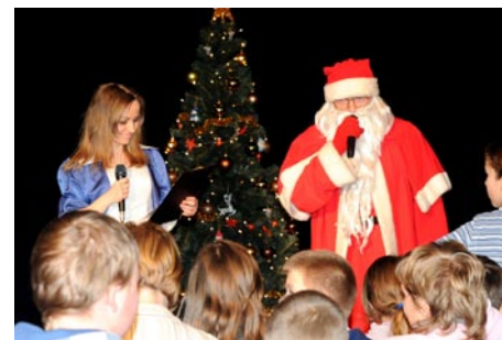
Mikołaj rozdał dzieciom świąteczne paczki