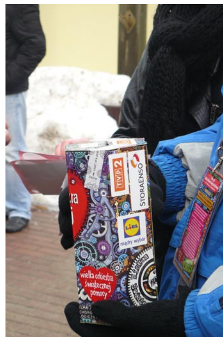
W puszkach znalazło się blisko 8 tysięcy złotych