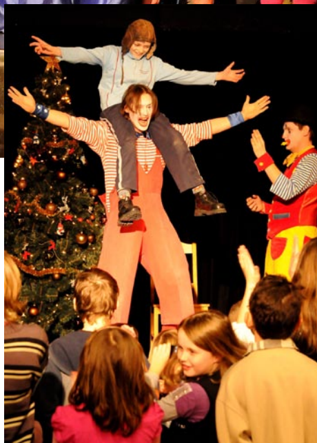
Główną atrakcją zabawy w Chotomowie byli klauni

Uśmiech na twarzach wielu dzieci nie pojawiłby się jednak, gdyby nie ludzie dobrej woli. Za pomoc przy organizacji imprez dziękujemy: