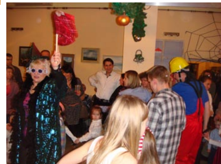
W Chotomowie był klaun, a w Jabłonie wróżka