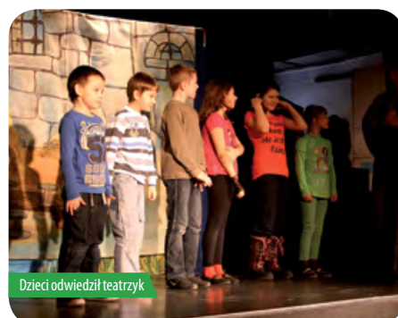
Dzieci odwiedził teatryk

Akcja zima” rozpoczęła się 28 stycznia a zakończyła 8 lutego. Oprócz zajęć w ramach akcji, dzieci i młodzież mogła także skorzystać z oferty świetlicy w Skierdach, gdzie bezpłatnie można było grać w tenisa stołowego, gry sprawnościowe i umysłowe, uczyć się lub po prostu miło spędzać czas.