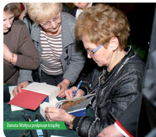
Danuta Wałęsa podpisuje książkę