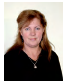
Przewodnicząca Komisji Bezpieczeństwa Publicznego Dorota Świątko