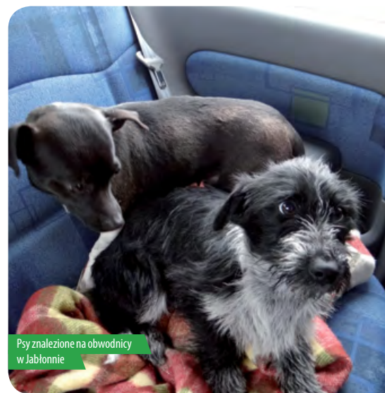
Psy znalezione na obwodnicy w Jabłonie