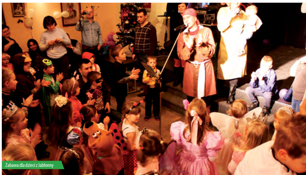
Zabawa dla dzieci z Jabłony