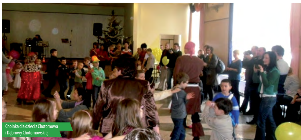
Choinka dla dzieci z Chotomowa i Dąbrowy Chotomowskiej