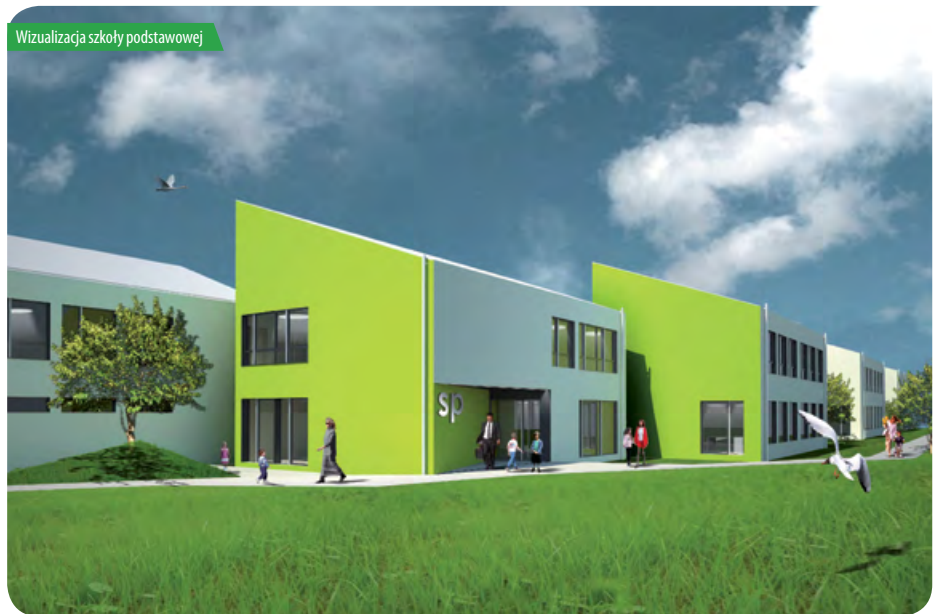
Wizualizacja szkoły podstawowej

W projekcie budżetu znalazły się także inne inwestycje. Wśród nich m.in. budowa oświetlenia, parkingu oraz chodnika przy ul. Złotej Renety i budowa chodnika przy ul. Parkowej w Jabłonie. Budowa chodnika i dojść do schodów oraz wind przy wiadukcie w Chotomowie, wykona-