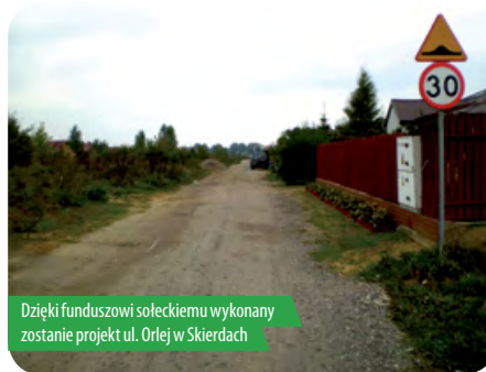
Dzięki funduszowi sołeckiemu wykonany zostanie projekt ul. Orlej w Skierdach

nie projektu ul. Orlej w Skierdach, budowa oświetlenia na: ul. Lipowej w Dąbrowie Chotomowskiej, ul. Spacerowej w Chotomowie, ul. Muzycznej w Skierdach, ul. Klonowej w Bożej Woli. Projekt przewiduje także wykonanie monitoringu wizyjnego w Chotomowie, budowę siłowni pod chmurką w Jabłonie i Skierdach oraz kilka innych ważnych inwestycji.