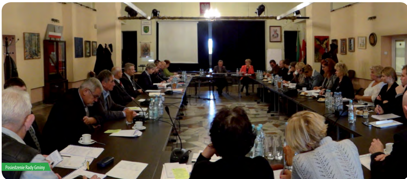
Posiedzenie Rady Gminy

Sprawozdanie z XXVII sesji Rady Gminy Jabłonna VI kadencji z dnia 19 grudnia 2012 r.