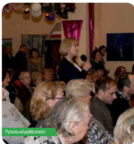
Pytania od publiczności