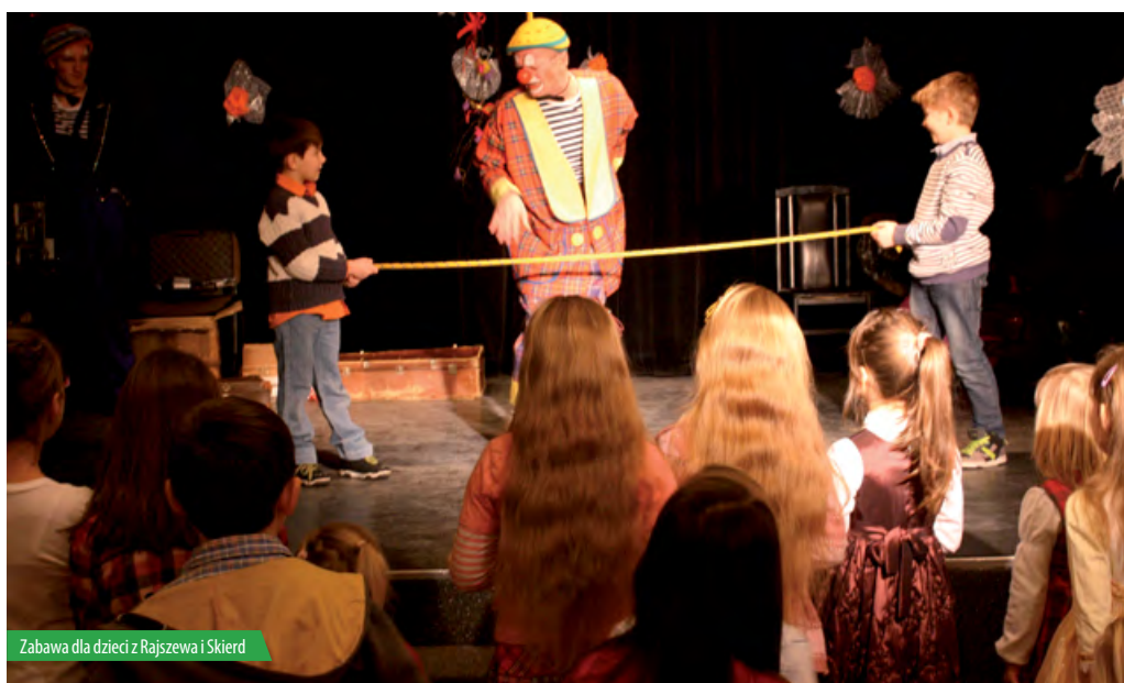
Zabawa dla dzieci z Rajszewa i Skierd