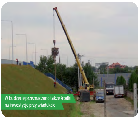
W budżecie przeznaczono także środki na inwestycje przy wiadukcie

B udżet przewiduje dochody w wysokości ponad 47 mln zł, a wydatki w kwocie ponad 56 mln zł, z czego wydatki majątkowe na rok 2013 zaplanowane są na kwotę przekraczającą 12 mln zł. Do kluczowych inwestycji należeć będzie z pewnością budowa szkoły podstawowej w Chotomowie przy ul. Kisielewskiego, na którą przeznaczono 10 mln zł.