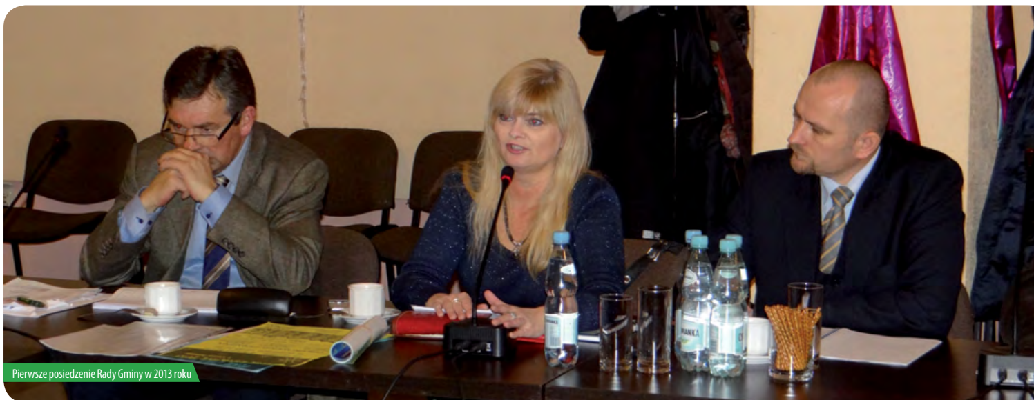
Pierwsze posiedzenie Rady Gminy w 2013 roku

Sprawozdanie z XXVIII Sesji Rady Gminy z dnia 23 stycznia 2013r.