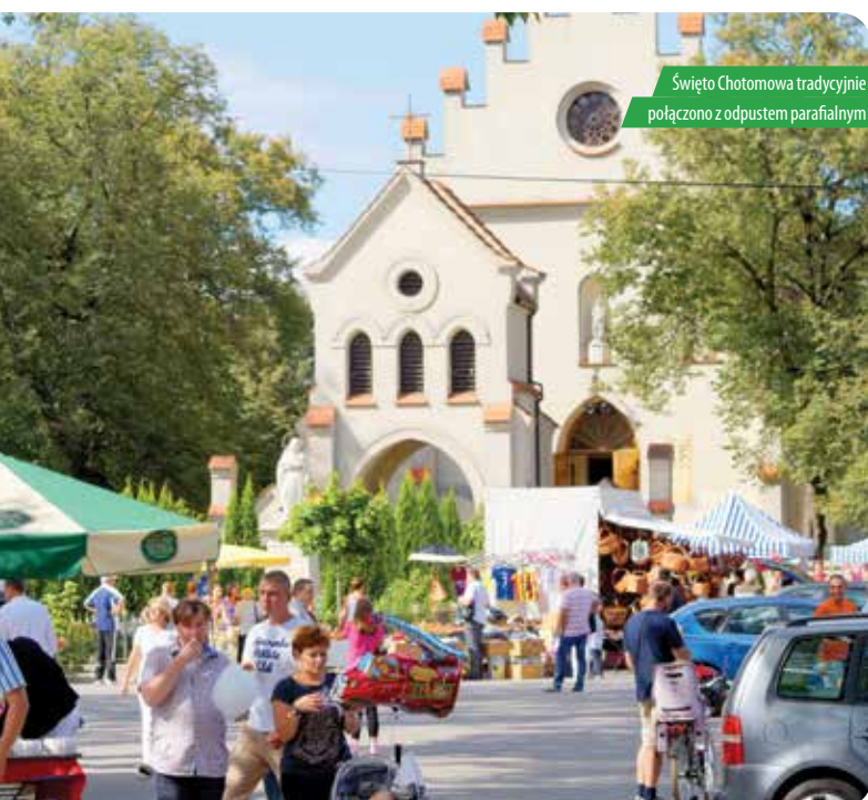
Święto Chotomowa tradycyjnie połączono z odpustem parafialnym