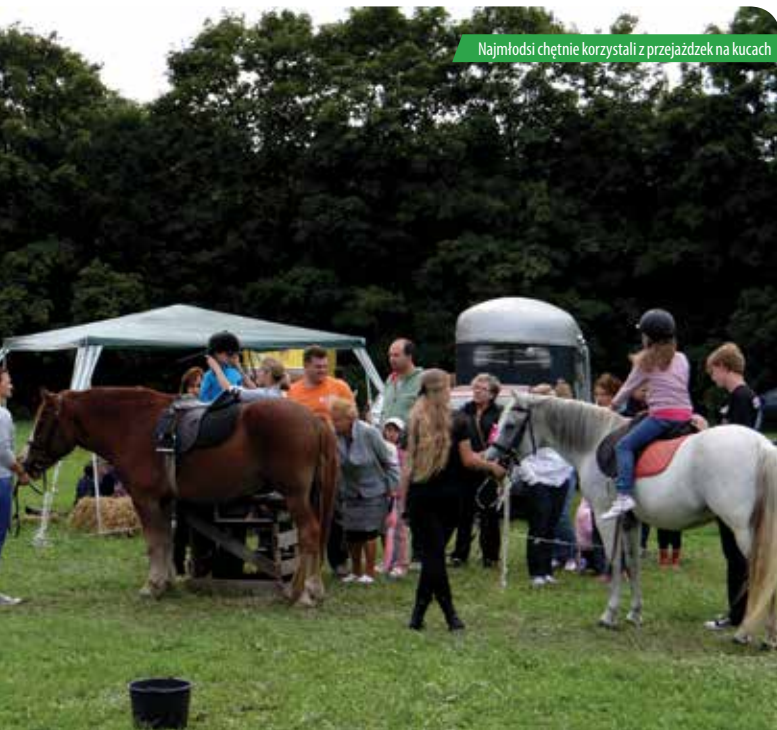
Najmłodszy chętnie korzystali z przejażdżek na kucach