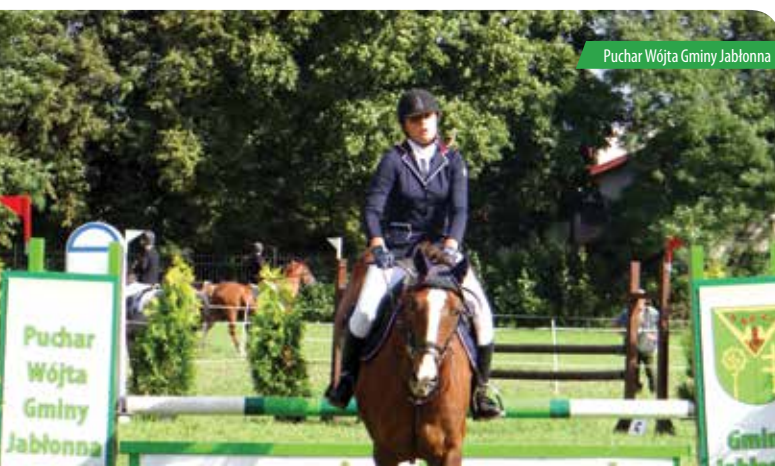
Puchar Wójta Gminy Jabłonna