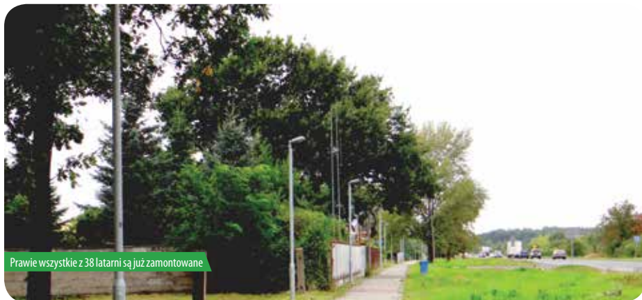
Prawie wszystkie z 38 latarni są już zamontowane