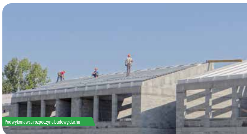
Podwykonawca rozpoczyna budowę dachu