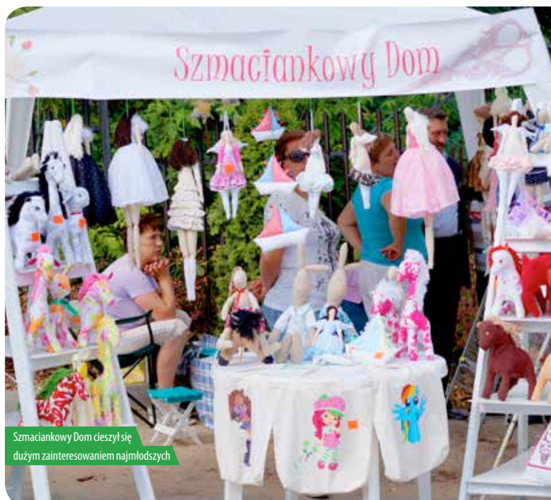
Szmactankowy Dom cieszył się dużym zainteresowaniem najmłodszych