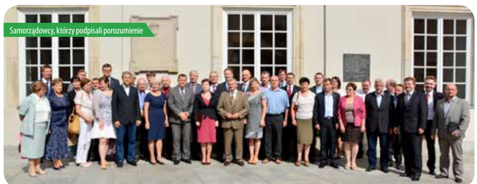
Samorządowcy, którzy podpisali porozumienie