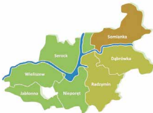
Obszar Lokalnej Grupy Rybackiej Zalew Zegrzyński

zaplanuj całonocną wycieczkę na obszarze Lokalnej Grupy Rybackiej Zalew Zegrzyński