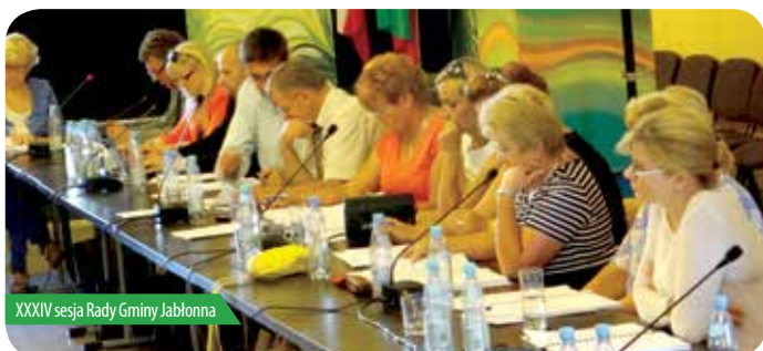
XXXIV sesja Rady Gminy Jabłonna

Rada Gminy Jabłonna spotkała się 28 sierpnia 2013 r. na XXXIV sesji po dwumiesięcznej wakacyjnej przerwie. Głosowaniu poddano 26 uchwał dotyczących między innymi budżetu gminy, funduszy unijnych pozyskiwanych przez Urząd Gminy, gospodarowania odpadami oraz kwestii geodezyjnych. Poniżej informacje o wybranych uchwałach.