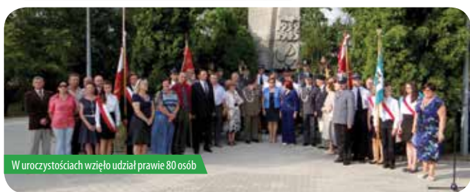
W uroczystościach wzięło udział prawie 80 osób