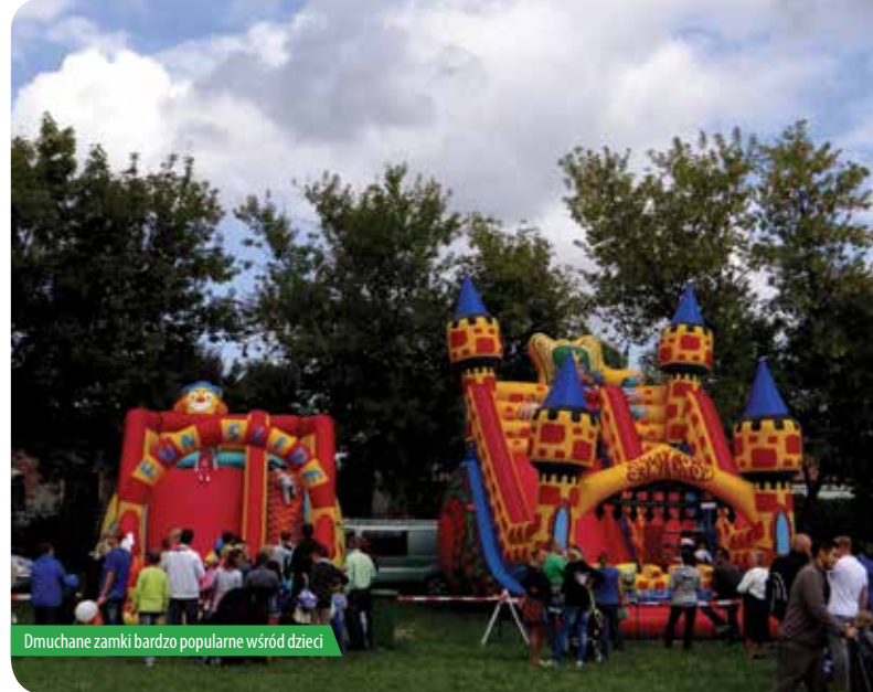
Dmuchane zamki bardzo popularne wśród dzieci