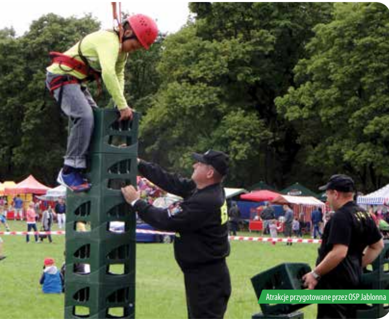
Atrakcje przygotowane przez OSP Jabłonna