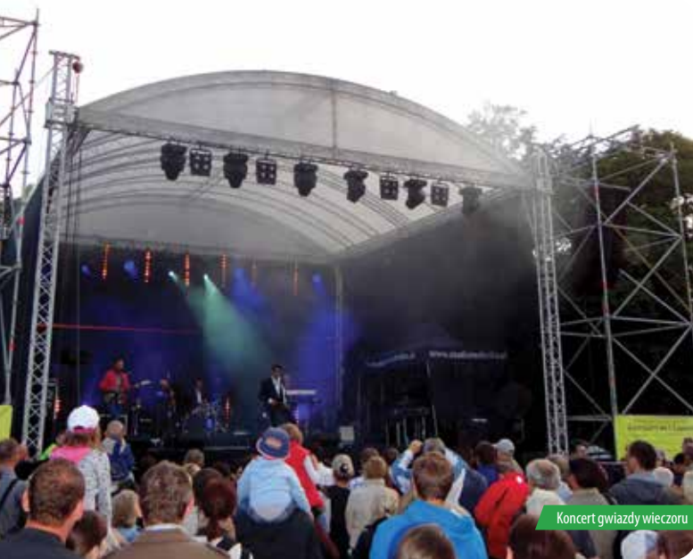
Koncert gwiazdy wieczoru