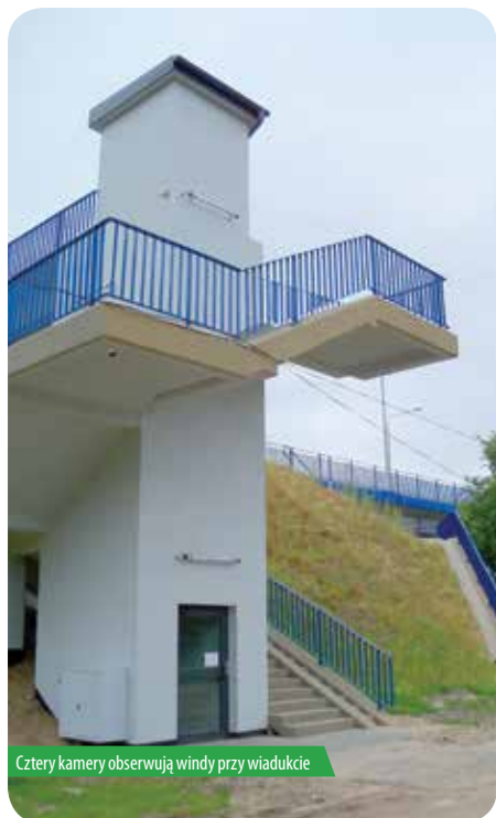
Cztery kamery obserwują windy przy wiadukcie

W lipcu do gminnego systemu monitoringu wizyjnego zostało włączonych sześć nowych kamer, które umożliwiają obserwację okolicy wiaduktu w Chotomowie oraz rejestrację obrazu. Nowy sprzęt ma na swoim koncie pierwszy sukces.