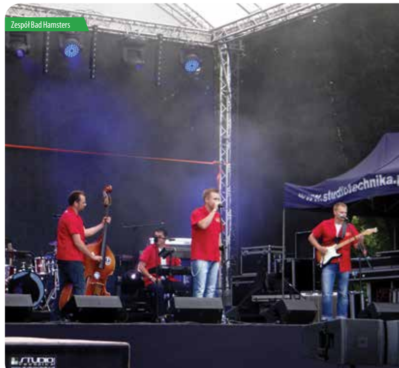
Zespół Bad Hamsters