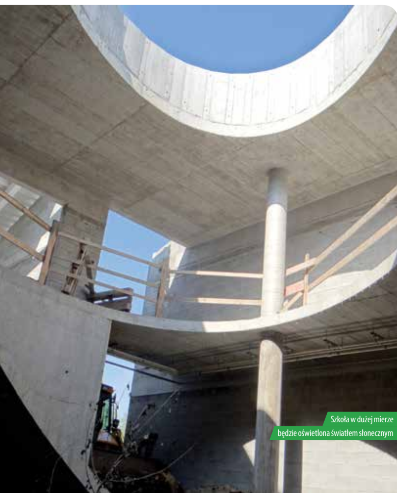
Szkoła w dużej mierze będzie oświetlona światłem słonecznym