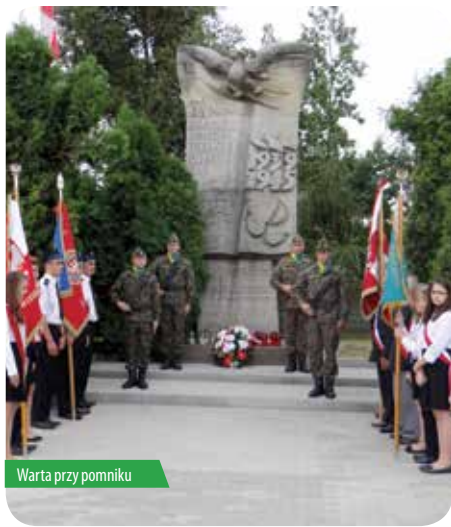
Warta przy pomniku

Uroczystości upamiętniające bohaterskie czyny walczących w Powstaniu Warszawskim tradycyjnie miały miejsce 1 sierpnia pod pomnikiem na skwerze ppor. „Alfy” i ppor. „Skiby”. W 69. rocznicę zrywu narodowowyzwoleńczego prawie 80 osób wspólnie oddało cześć bohaterom AK.