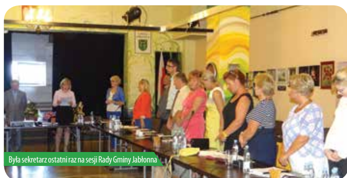
Była sekretarz ostatni raz na sesji Rady Gminy Jabłonna

Od 1 września 2014 roku Niepubliczne Przedszkole przy ul. Modlińskiej 103B zwolni wynajmowane gminne budynki – w miejsce prywatnej placówki powstanie Przedszkole Gminne.