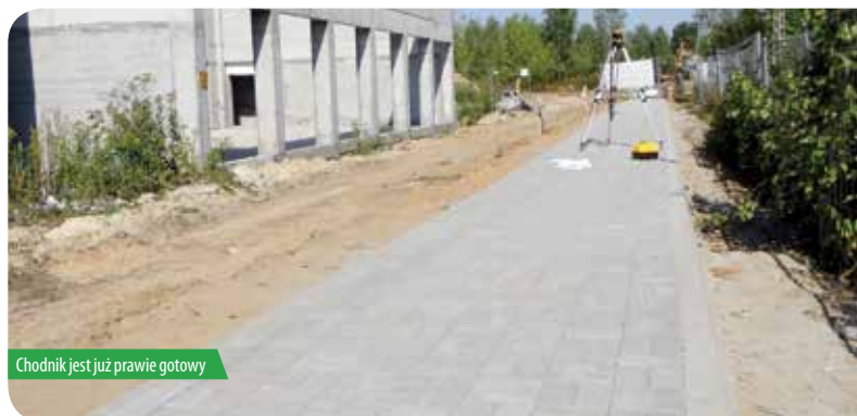
Chodnik jest już prawie gotowy

Ważnym etapem w budowie szkoły jest wyłonienie wykonawcy budowy sieci kanalizacyjnej odprowadzającej ścieki ze szkoły. Bezpośrednio po podpisaniu umowy, firma SANTRO rozpoczęła prace polegające na budowie przewodu wodociągowego rozdzielczego i kanalizacji sanitarnej (przewód tłoczny i tłocznia ścieków) w ul. Parkowej w Legionowie oraz w ulicach Legionowskiej,