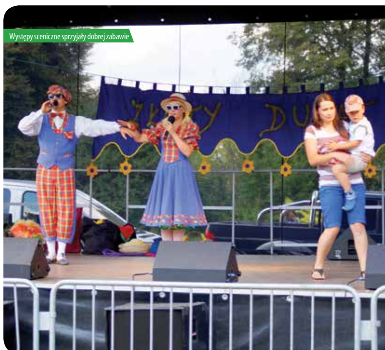
Występy sceniczne sprzyjały dobrej zabawie