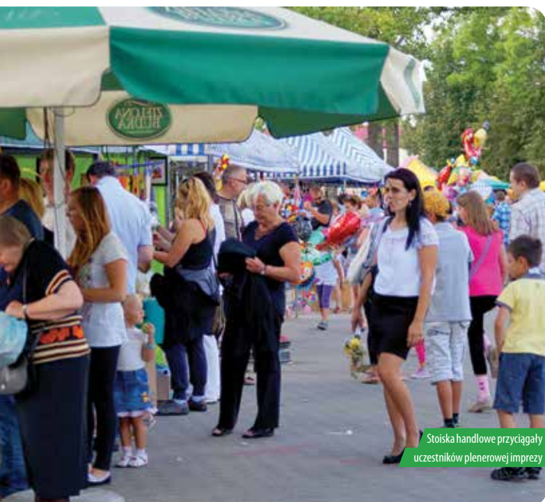
Stoiska handlowe przyciągały uczestników plenerowej imprezy