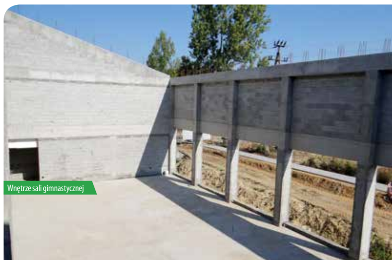
Wnętrze sali gimnastycznej