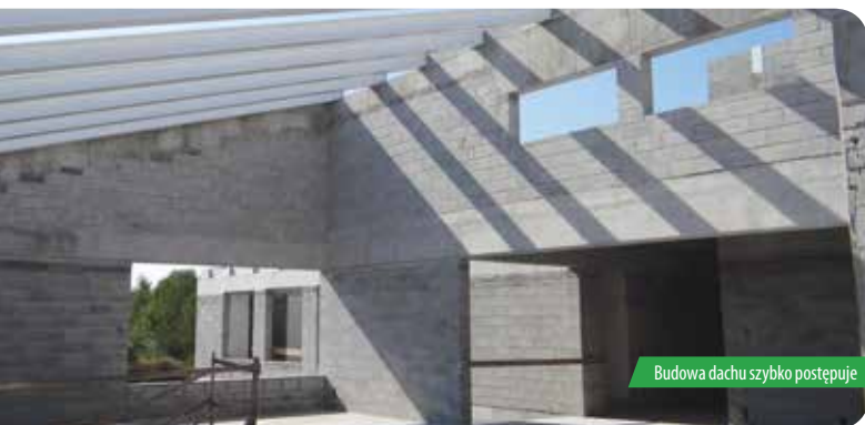
Budowa dachu szybko postępuje

Budowa Centrum Kulturalno-Edukacyjno-Sportowego, pierwszy etap – szkoła podstawowa w Chotomowie idzie pełną parą. Infrastruktura podziemna jest już w całości wykonana, przyłącze gazowe również. W ostatnim tygodniu sierpnia rozpoczął się montaż dachu. Na teren budowy szkoły w Chotomowie zostali wprowadzeni podwykonawcy, którzy zajmują się wykonaniem parkingów i dróg wewnętrznych, ich zadaniem będą również realizacja zleceń na place zabaw oraz tereny zielone.