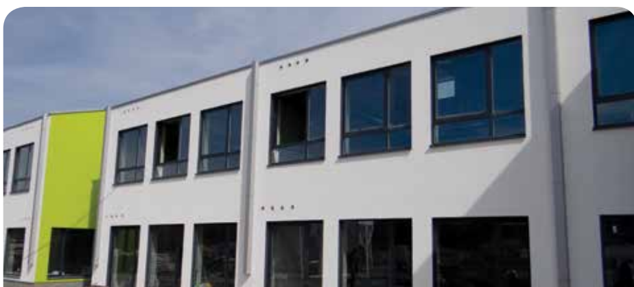
Budynek szkoły - widok od strony zachodniej