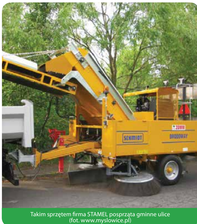
Takim sprzętem firma STAMEL posprząta gminne ulice