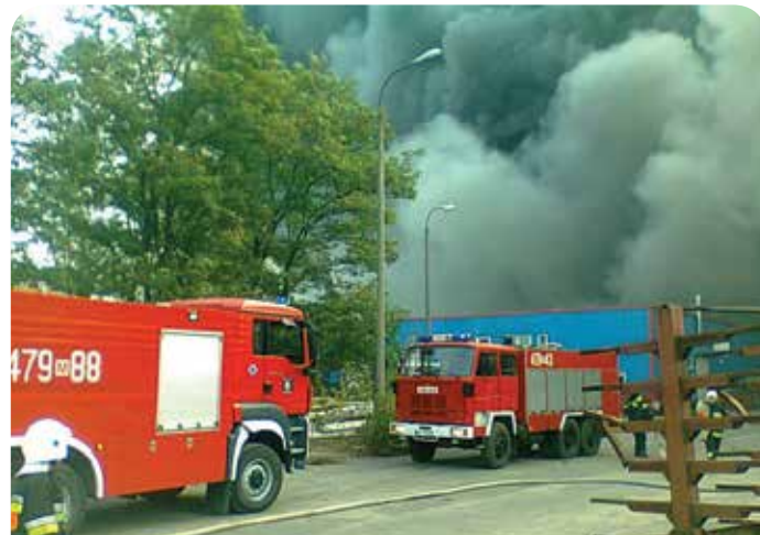
OSP Chotomów należy do krajowego systemu ratowniczo-gaśniczego

Służba w OSP, szczególnie w tak dobrze zorganizowanej i aktywnej jednostce jak chotomowska, jest merytorycznym i solidnym przygotowaniem do pełnienia służby zawodowej. Podczas pracy na rzecz OSP, strażacy zdobywają wiedzę teoretyczną i praktyczną z zakresu ochrony przeciwpożarowej oraz ratownictwa.