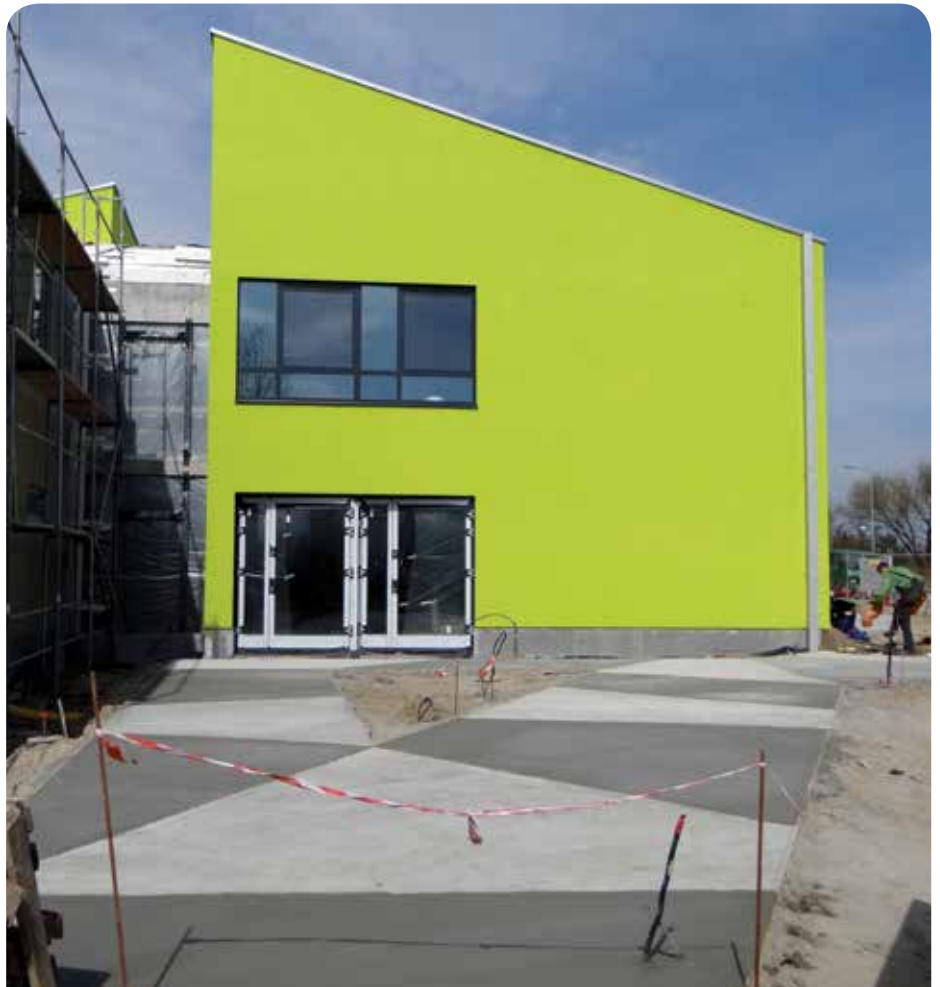
Elewacja budynku i chodniki są już prawie gotowe

1. września uczniowie rozpoczną zajęcia w nowej szkole podstawowej.