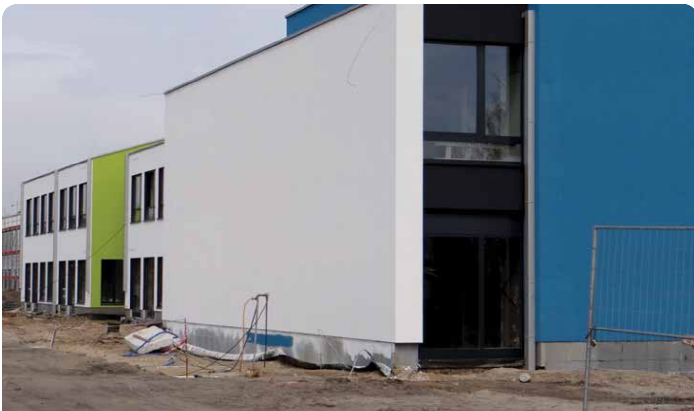
Trwają prace wokół budynku