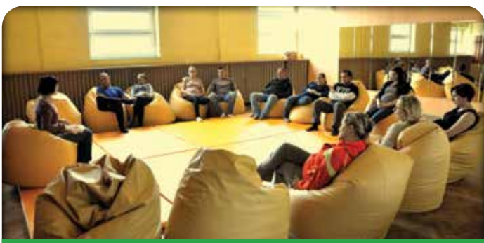
Uczestnicy Szkoły Rodzenia

W sobotę 15 marca zakończył się radosnym sukcesem pierwszy cykl zajęć w Szkole Rodzenia w Jabłonie. W zajęciach uczestniczyło siedem przyszłych mam wraz z przyszłymi tatusiami.