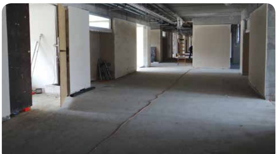
Korytarz na parterze szkoły