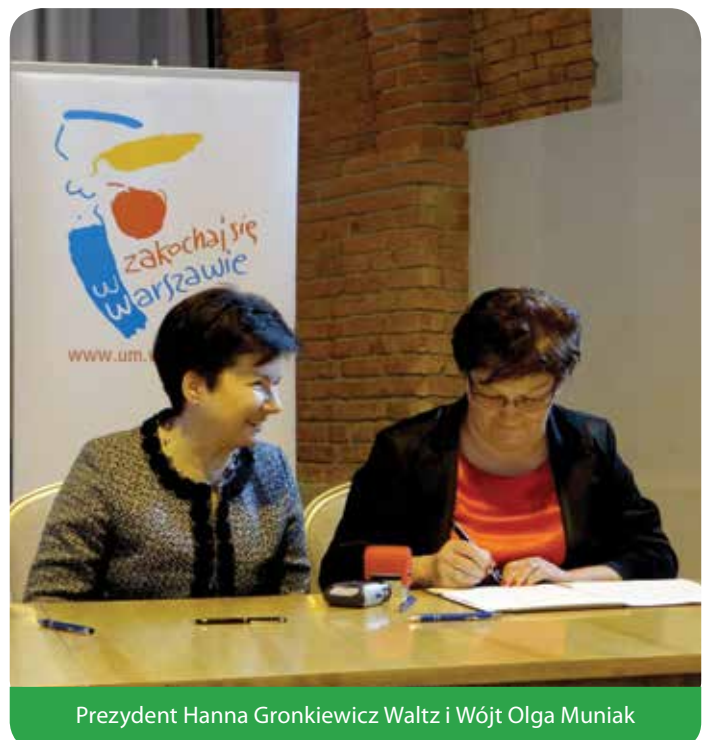
Prezydent Hanna Gronkiewicz-Waltz i Wójt Olga Muniak

Porozumienie zostało podpisane przez m.st. Warszawa będące miastem na prawach powiatu, 14 gmin miejskich, 12 miejsko-wiejskich oraz 11 wiejskich przynależnych administracyjnie do 10 powiatów (legionowskiego, mińskiego, nowodworskiego, otwockiego, wołomińskiego, grodzkiego, piaseczyńskiego, pruszkowskiego, warszawskiego-zachodniego i żyrardowskiego). Obszar ten mimo, że zajmuje stosunkowo niewielką część województwa mazowieckiego (7,7%), koncentruje aż połowę mieszkańców regionu (50,1%).