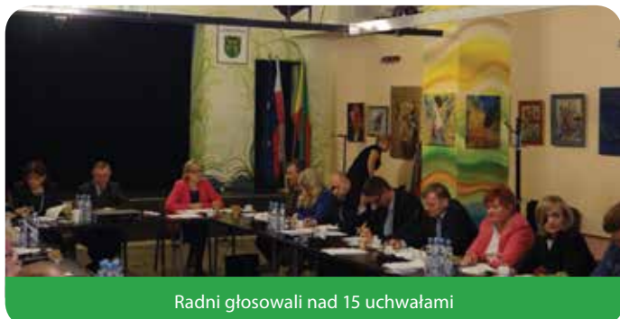
Radni głosowali nad 15 uchwałami

Podczas XLII Sesji Rady Gminy radni głosowali nad 15 projektami uchwał – dwie uchwały nie zostały pozytywnie rozpatrzone. 14 członków Rady Gminy zagłosowało przeciwko zmianie zasad poboru podatków w drodze inkasa, natomiast 8 radnych sprzeciwiło się utworzeniu filii gimnazjum w Chotomowie.