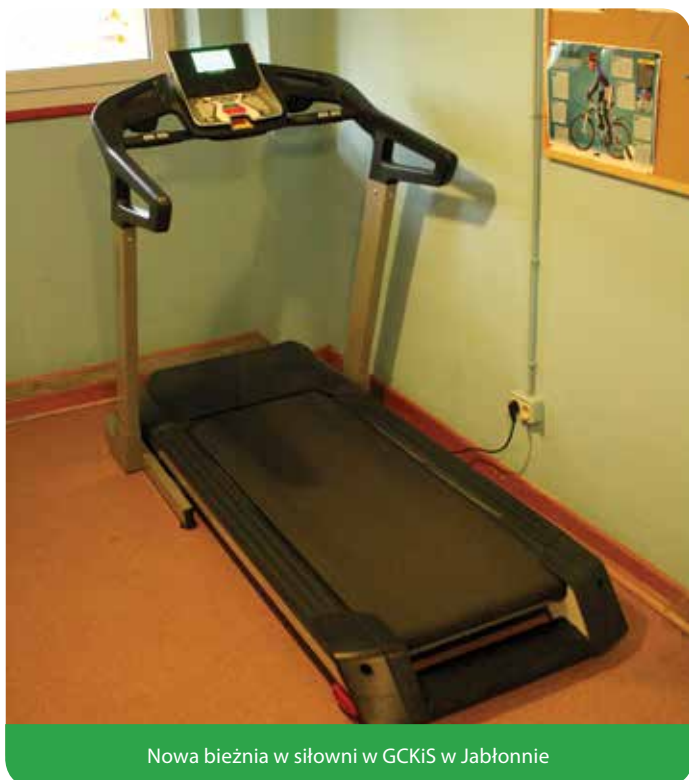
Nowa bieżnia w siłowni w GCKIS w Jabłonie