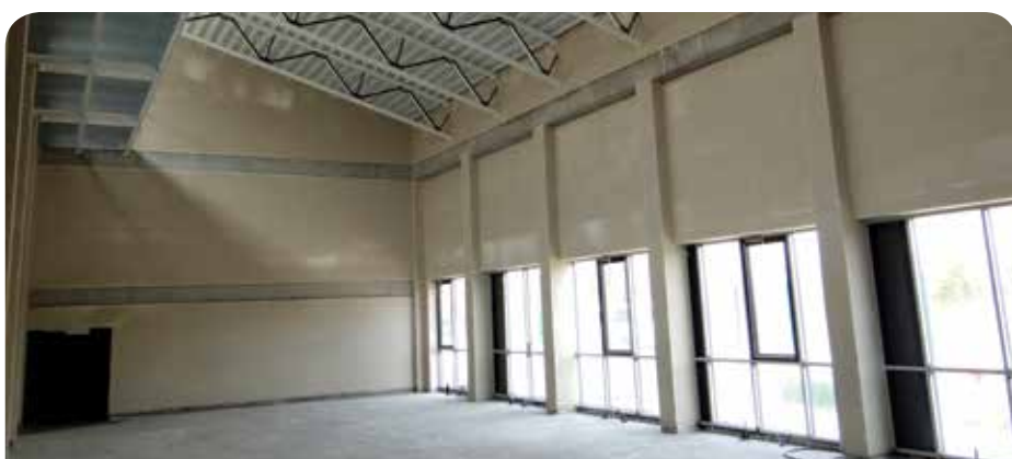
Wnętrze sali gimnastycznej