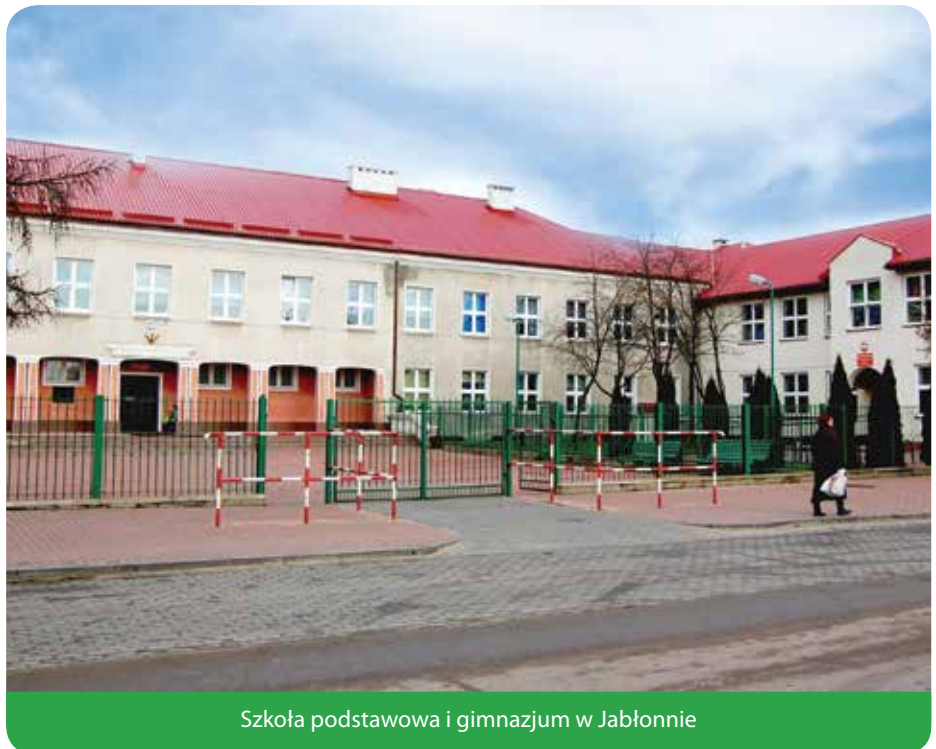
Szkoła podstawowa i gimnazjum w Jabłonce

O dalszych decyzjach w sprawie organizacji oświaty w naszej gminie będziemy Państwa informować za pośrednictwem gazety oraz strony internetowej www.jablonna.pl