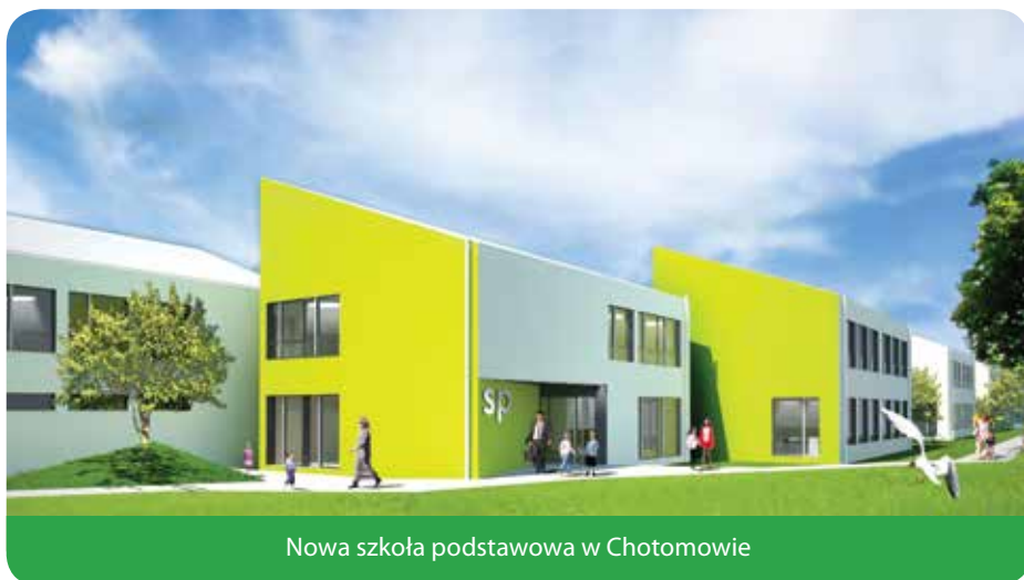
Nowa szkoła podstawowa w Chotomowie

Ostatnie tygodnie w naszej gminie przyniosły eskalację konfliktu dotyczącego oświaty. W najnowszym numerze „Więści z Naszej Gminy” przedstawiamy genezę sporu wokół szkół podstawowych i gimnazjum.