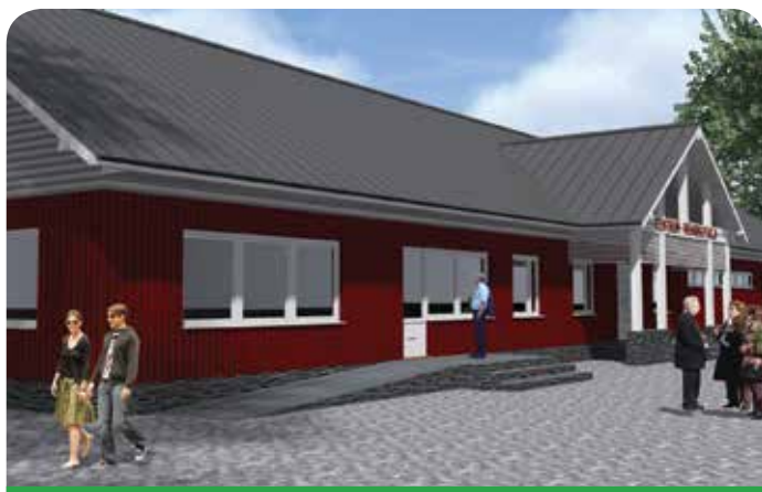
Centrum Rehabilitacji w Trzcianach, wizualizacja projektu

Głównym celem działającej na terenie naszej gminy fundacji jest wybudowanie Specjalistycznego Centrum Rehabilitacji dla osób niepełnosprawnych i ich rodzin.