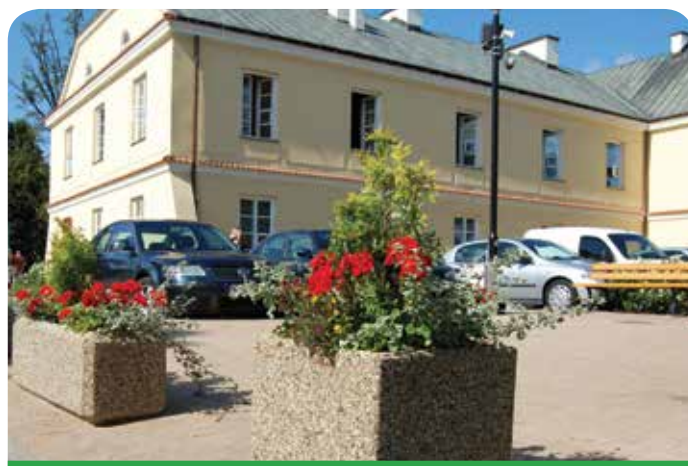
Urząd Gminy Jabłonna

Dziennikarz porównał działania urzędów w Legionowie, Nieporęcie, Jabłonce, Wieliszewie, Serocku i Starostwo Powiatowe w Legionowie pod względem udostępniania nagrań z sesji Rady Gminy. W części artykułu poświęconej naszej gminie zatytułowanej „Jabłonna – błyskawicznie” czytamy, że: „Wbrew panującej opinii, Urząd Gminy w Jabłonce jest najbardziej przejrzystym samorządem pod względem udostępniania nagrań z sesji a nawet posiedzeń komisji. Na prośby reaguje bez zbędnej zwłoki, wykorzystując wszelkie ułatwienia techniczne by sprostać oczekiwaniom mieszkańców. Zarówno rzecznik jak i referat obsługujący prace rady, radzi sobie z dużymi plikami i na usilne prośby wysyła je za pomocą poczty internetowej. Bezsprzecznie, urząd ten wydaje się być najbardziej przyjazny w tym zakresie.”