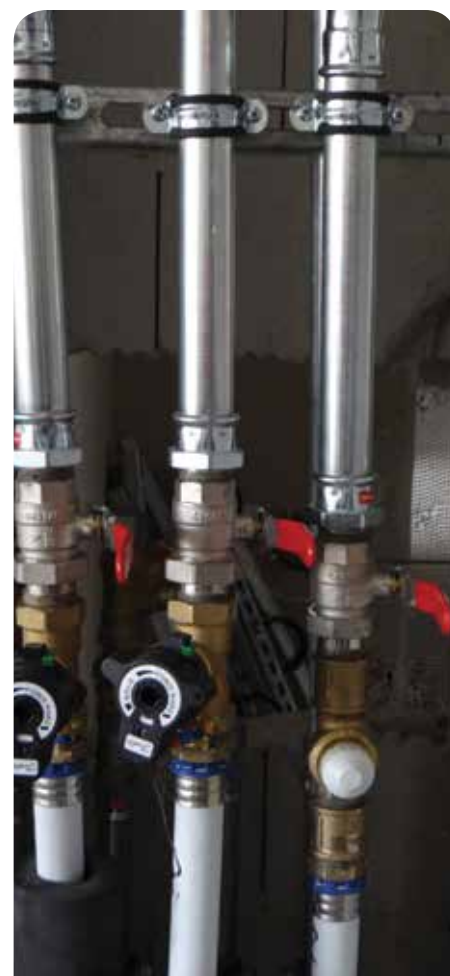
Przy budowie szkoły wykorzystano najnowsze technologie