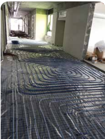
W budynku zastosowano ogrzewanie podłogowe