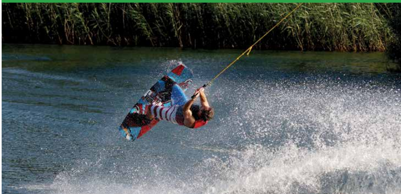
Wakebording na jeziorze Trzciańskim

Wake Family jest otwarte 7 dni w tygodniu, od godz. 8 do 20. W tym roku otwarcie jest planowane na 18 kwietnia. 31 maja planowane są widowiskowe zawody, na których można zobaczyć jak pływają najlepsi i do jakiego poziomu można dojechać pływając na desce wakeboardingowej. Dla odwiedzających będzie przygotowanych na ten dzień szereg atrakcji. Organizatorzy zapraszają mieszkańców z rodzinami i przyjaciółmi do odwiedzenia Wake Family. Do Wake Family można szybko można dojechać od ulicy Modlińskiej skręcając na Trzciany, potem w prawo w ul. Granitową i podążając za drogowskazami z WAKE FAMILY z łatwością dojedzie się na miejsce.