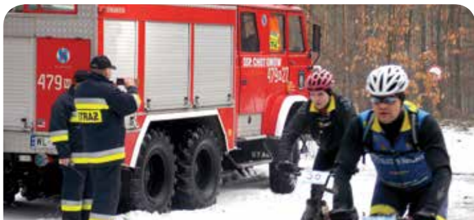
Strażacy z Chotomowa pomagają w organizacji imprez na terenie gminy

Kandydaci na członków OSP powinni odznaczać się dobrym stanem zdrowia, który umożliwi czynny udział w akcjach. Osoby, chcące wstąpić w szeregi OSP na początku swojej przygody w jednostce odbywają szkolenie wewnętrzne, prowadzone przez strażaków z Chotomowa. Każdy pełnoletni kandydat jest kierowany na podstawowy kurs ratownika OSP, który składa się z części teoretycznej i praktycznej. Szkolenie odbywa się w systemie weekendowym, w jednostce ratowniczo-gaśniczej (JRG) Powiatowej Straży Pożarnej w Legionowie. Uczestnicy kursu przechodzą między innymi próbę wysiłkową czy pobyt w komorze dymowej. „Osoby skierowane na szkolenia nie ponoszą kosztów udziału w kursie. Po zaliczeniu kursu ratownika OSP, absolwent może brać aktywny udział w akcjach ratowniczo-gaśniczych. W późniejszym czasie, członkowie OSP mogą nabyć uprawnienia do udzielania pierwszej pomocy medycznej, prowadzenia