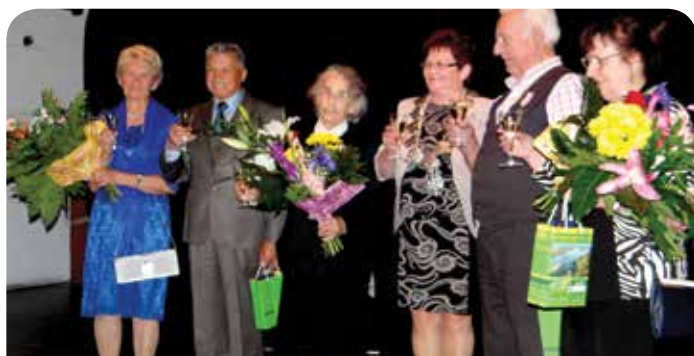
Na jubilatów czekał tort i lampki szampana

Medal za Długoletnie Pożycie Małżeńskie został ustanowiony w 1960 r. i nadawany jest osobom, które przeżyły 50 lat w jednym związku małżeńskim.