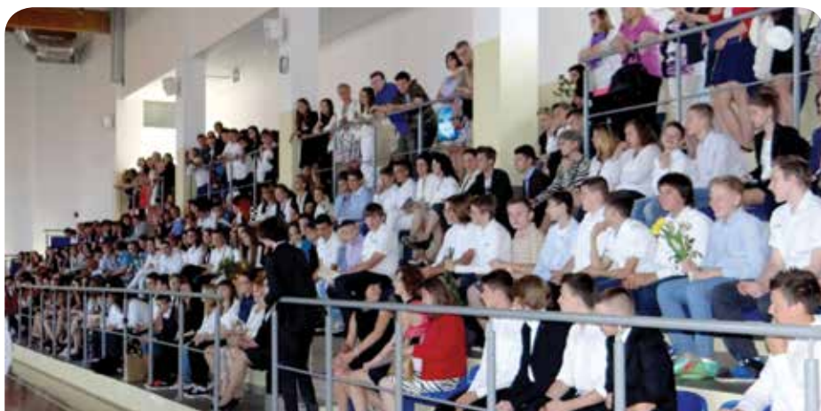
Gimnazjaliści podczas ostatniego zakończenia roku szkolnego w placówce w Jabłonie

Uczniowie, którzy czerpią radość z pomagania potrzebującym nadal będą mogli udzielać się w szkolnym wolon-