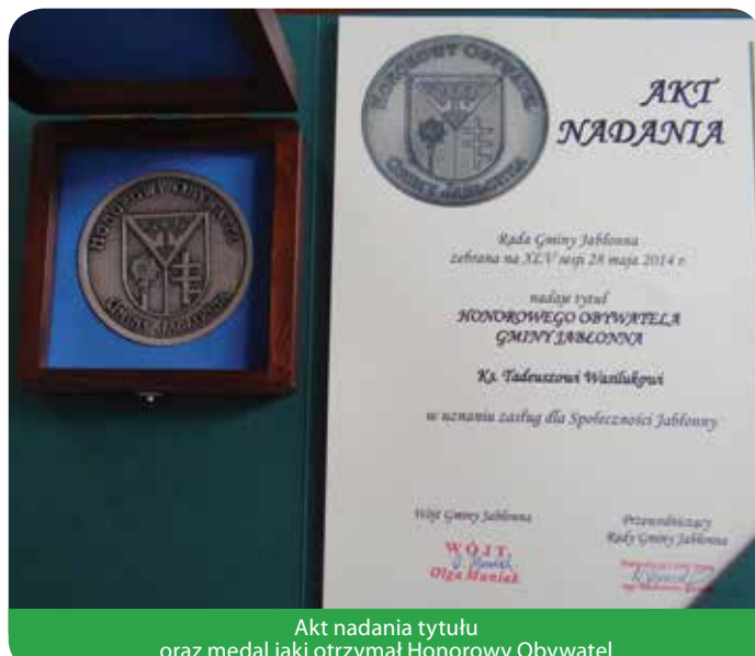
Akt nadania tytułu oraz medal jaki otrzymał Honorowy Obywatel

Ksiądz Proboszcz jest trzecią osobą wyróżnioną tytułem Honorowego Obywatela Gminy Jabłonna.