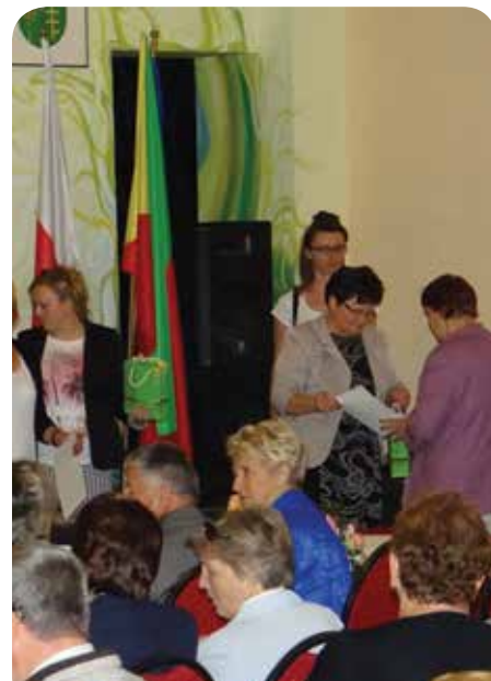
Sluchacze Uniwersytetu Trzeciego Wieku z Jabłonna i z Chotomowa