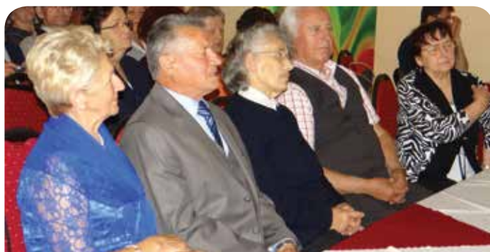
Trzy małżeństwa otrzymały Medale za Długoletnie Pożycie