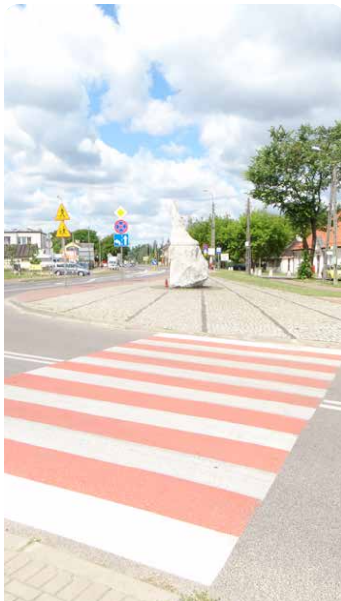
Przejścia dla pieszych w nowej, bardziej widocznej, kolorystyce

Rada Gminy zwiększyła środki na wykonanie projektu i budowę oświetlenia ul. Lawendowej w Rajszewie (planowana kwota to ponad 44 000 zł). Zadanie zostanie wykonane z Funduszu Sołectkiego i środków własnych Gminy.