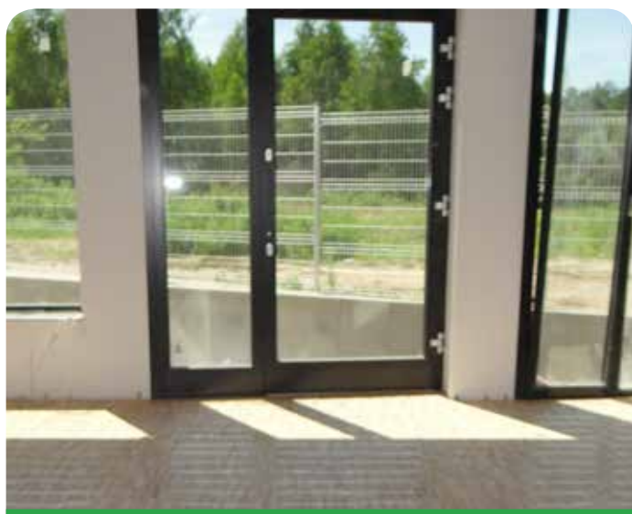
W salach lekcyjnych są już drewniane podłogi