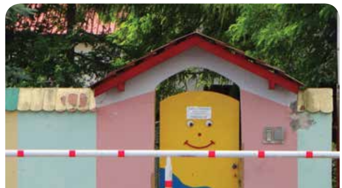
Przy ul. Modlińskiej powstanie przedszkole gminne