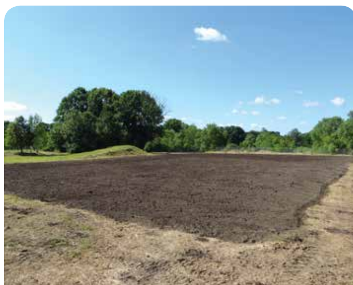
Wyrównany teren pod boisko w Skierdach