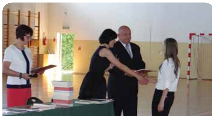
Najzdolniejsi uczniowie zostali nagrodzeni