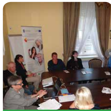
Uczestnicy jednego ze spotkań informacyjnych dla kandydatów do projektu