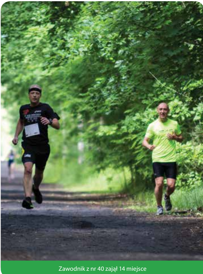
Zawodnik z nr 40 zajął 14 miejsce