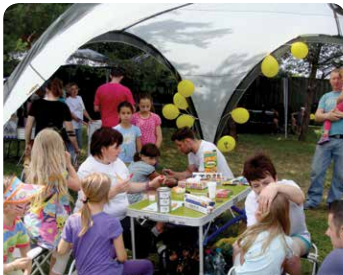
Malowanie buziek w Suchocinie