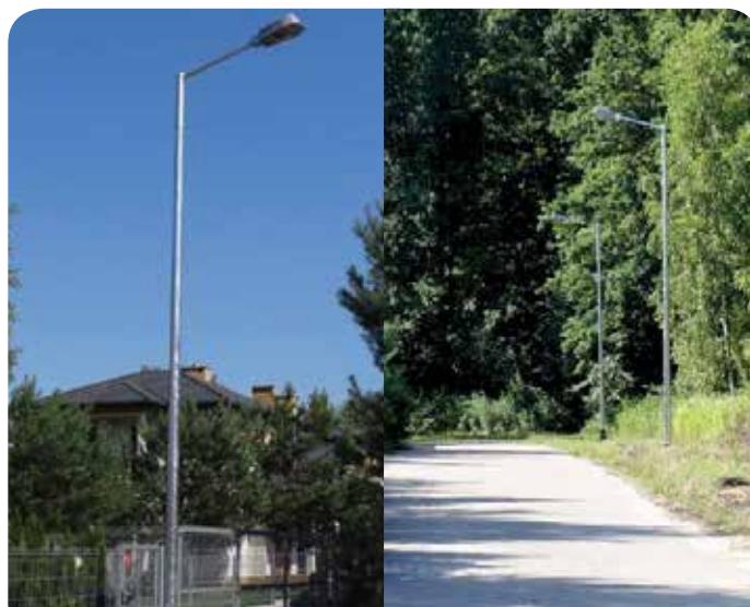
Latarnie stoją już wzdłuż całej ul. Gwiaździstej

Na początku lipca zakończono II etap budowy oświetlenia ul. Gwiaździstej w Chotomowie. 8 lamp dopełniło oświetlenie na całej długości drogi. Roboty wykonał ELBIS Przedsiębiorstwo Budowy Sieci Energetycznych Leszek Pokrywko z Wołomina. Koszt realizacji inwestycji to prawie 30 000 zł.