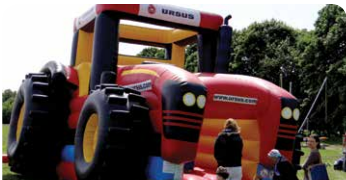
Dmuchany ciągnik firmy URSUS

Przez cały weekend 31 maja i 1 czerwca na najmłodszych mieszkańców naszej gminy czekało mnóstwo atrakcji. W sobotę odbyły się pikniki rodzinne w szkołach podstawowych, parafialny Dzień Dziecka w Chotomowie, a w niedzielę „Urodziny Księcia Józefa” połączone z obchodami Dnia Dziecka w Jabłonce.