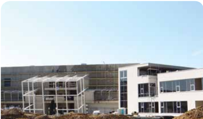
Budowa Centrum Badawczego PAN

Do końca roku będą trwały roboty budowlane Centrum Badawczego PAN poświęconego odnawialnym źródłom energii. Z bazy laboratoryjnej będzie korzystał Instytut Maszyn Przepływowych PAN, wyższe uczelnie, jednostki badawczo-rozwojowe oraz wiodące firmy w sektorze energetyki.