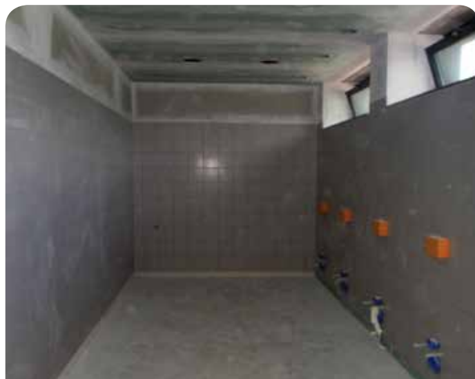
Już niebawem płytki pokryją całe pomieszczenie