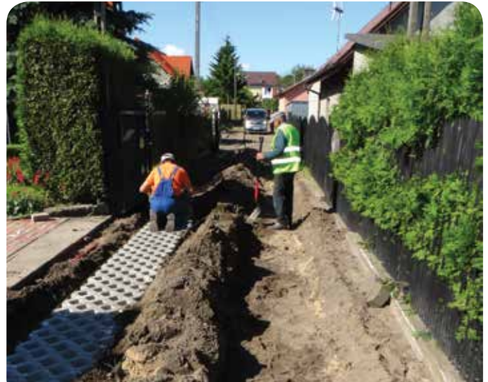
Wykonawcy robót przywracają przejezdność skanalizowanym ulicom

Realizacja inwestycji zostanie sfinansowana ze środków unijnych w wysokości 217 974,00 zł