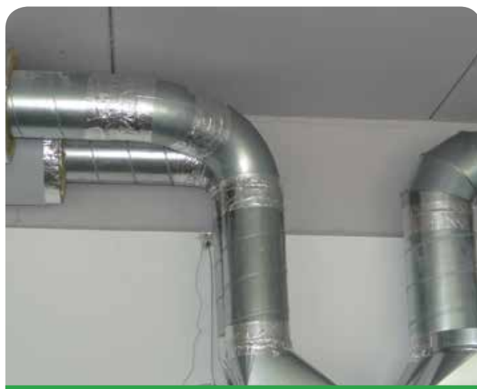
W każdej sali zainstalowane są rekuperatory