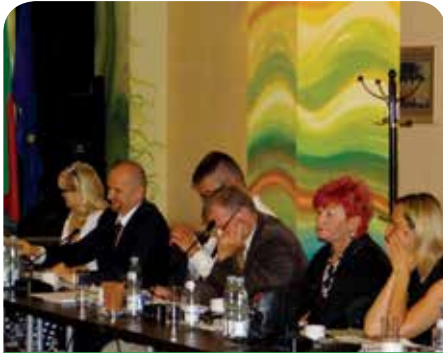
11 radnych głosowało za przyjęciem absolutorium, 4 było przeciw

Blisko 20 mln zł z budżetu naszej gminy przeznaczono na oświatę publiczną i niepubliczną. Wydatki na pomoc społeczną w 2013 r. wyniosły prawie 5 mln zł, na transport publiczny 1,3 mln zł, a dowóz dzieci do szkół 0,5 mln zł. W zeszłym roku gmina realizowała projekty z udziałem pieniędzy zewnętrznych (przede wszystkim unijnych). Zrealizowane zostały takie projekty jak: siłownia pod chmurką w Skierdach i w Jabłonce, rewitalizacja centrum Jabłonna, znakowanie pomników przyrody, program „Start na piątkę” czy imprezę „Zaprzyjajnij się z Zalewem”. W 2013 r. z pieniędzy unijnych podpisane zostały umowy na budowę boiska przy nowo budowanej szkole w Chotomowie oraz