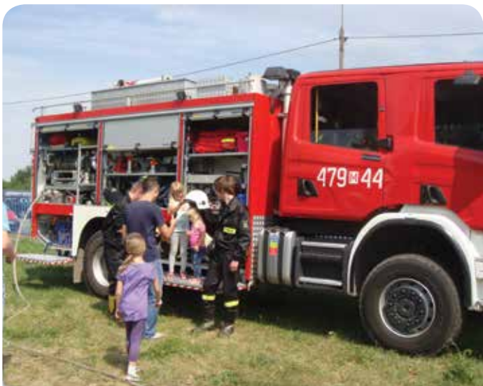
Wóz strażacki OSP Jabłonna