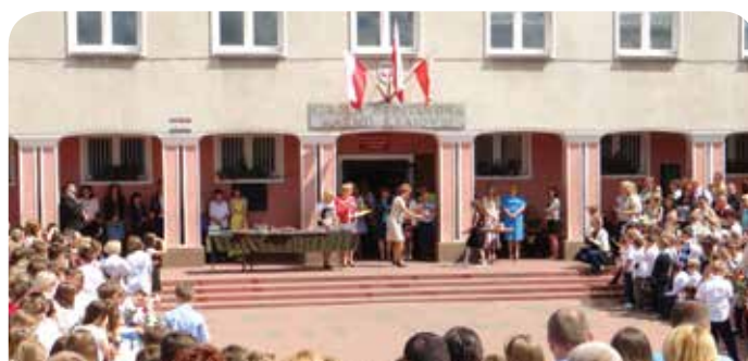
Zakończenie roku w Szkole Podstawowej w Jabłonce

Od przyszłego roku szkolnego 2014/2015 w edukacji na terenie gminy nastąpi wiele zmian. Po wakacjach, Publiczne Gimnazjum im. Orła Białego zmieni lokalizację, od 1 września gimnazjaliści będą uczęszczać do szkoły, której siedziba będzie się mieścić w Chotomowie przy ul. Partyzantów 23 (budynek Szkoły Podstawowej). Szkoła Podstawowa w Chotomowie zostanie przeniesiona do nowego budynku przy ul. Partyzantów 124 (CEKS). Natomiast Szkoła Podstawowa w Jabłonce powiększy swoją bazę lokalową o część budynku zajmowaną dotychczas przez Gimnazjum. Podczas wakacji budynki szkolne zostaną dostosowane do potrzeb uczniów i dodatkowo wyposażone. Wszystkim uczniom, nauczycielom i pracownikom oświaty życzymy udanego i bezpiecznego wypoczynku.