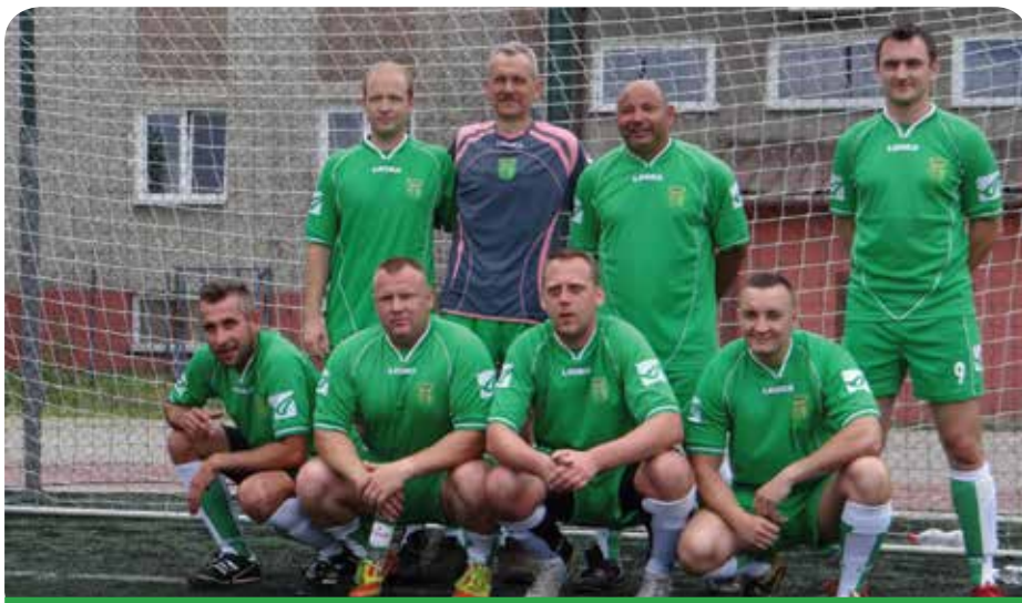
Drużyna gminy Jabłonna zajęła 17 miejsce

Sponsorami głównymi imprezy był Gaz System S.A. oraz Lipowy Przylądek. Jednym z patronów medialnych wydarzenia był informator gminny „Wieści z Naszej Gminy”. Imprezę zorganizował Powiat Legionowski przy współudziale gmin Jabłonna, Nieporęt, Wieliszew i miasta Legionowo.