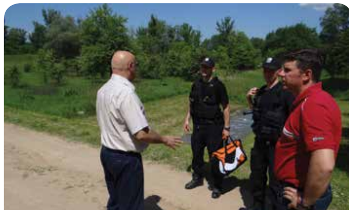
Stan wody na Wiśle był nieustannie monitorowany

Ze szczególnym zaangażowaniem w akcję prewencyjną włączyły się zastępy Ochotniczych Straży Pożarnych z Chotomowa i Jabłony.