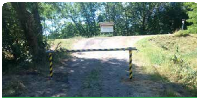
Szlaban przy „Nadzorcówce”

W czerwcu na całej długości został wykoszony prawostronny wał rzeki Wisły będący w utrzymaniu Inspektoratu w Nowym Dworze Mazowieckim. Odbiór końcowy koszenia wału na odcinku Jabłonna - Nowy Dwór Mazowiecki odbył się 29 czerwca. Również w czerwcu Wójt wydał decyzję zezwalającą na usunięcie drzew kolidujących z pracami naprawczymi wału przeciwpowodziowego. Decyzji nadano rygor natychmiastowej wykonalności. To jednak nie jedyne prace mające na celu poprawę bezpieczeństwa przeciwpowodziowego. W związku ze zgłoszeniami mieszkańców odnośnie niszczenia wału przez pojazdy mechaniczne (quady, samochody), na drogach dojazdowych do wału montowane są także szlabany, które mają zapobiec wjeżdżaniu na koronę. Pod koniec czerwca jeden z nich zamontowano przy „Nadzorcówce” w Rajszewie, a kolejny stanie na wjeździe na wał przy „tarasie widokowym”.