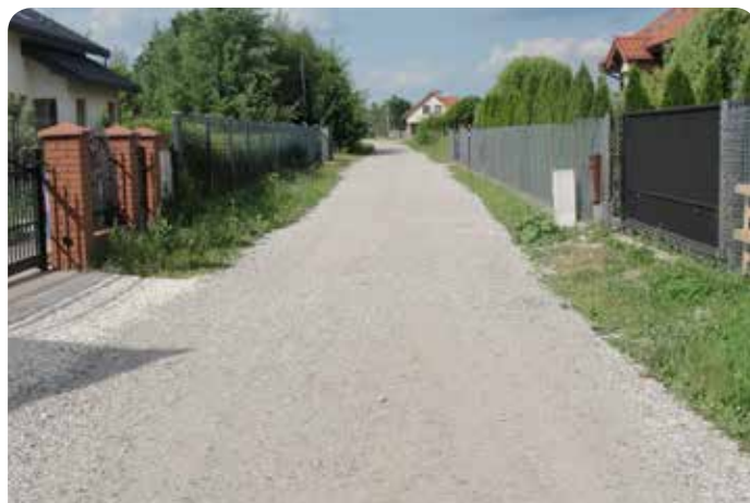
Trwają prace związane z kruszywowaniem dróg