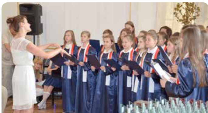
Występ chóru „Natus”

Ostatnim oficjalnym punktem sesji był recital grupy Moderato.