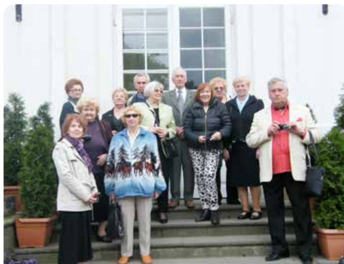
Uczestnicy majowego spotkania