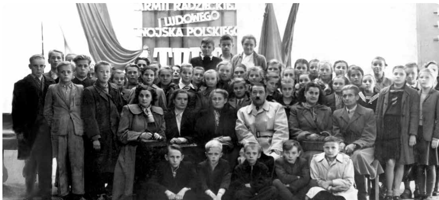
Archiwalne zdjęcie klasy