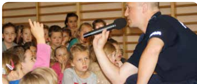
Spotkanie w Jabłonie