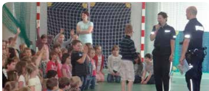
Spotkanie w Chotomowie