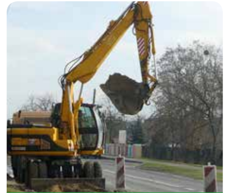
Budowa kanalizacji w ulicy Modlińskiej

sąsiadujących gmin Wieliszew i Legionowo (projekt sieci kanalizacyjnej w Janówku Drugim – Wieliszew; projekt sieci wodociągowej w Chotomowie – Legionowo).