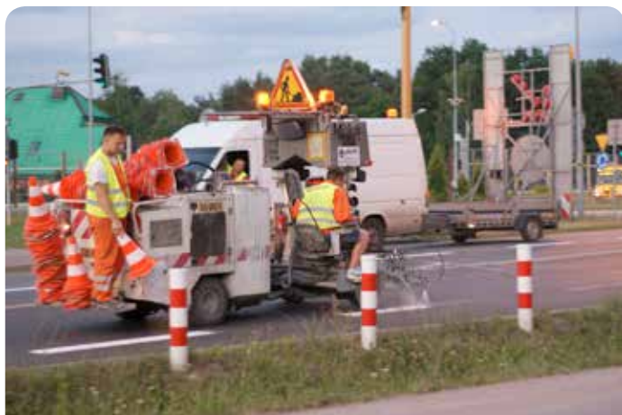
Odświeżanie znaków poziomych na ul. Modlińskiej

W najbliższym czasie ma zostać ogłoszony przetarg na wykonanie dokumentacji projektowej budowy kanalizacji w ul. Kisielewskiego, ul. Partyzantów i ul. Jasnej w Chotomowie oraz budowy wodociągu w sąsiedztwie cmentarza w Chotomowie (między innymi ul. Tęczowa i ul. Dobra).