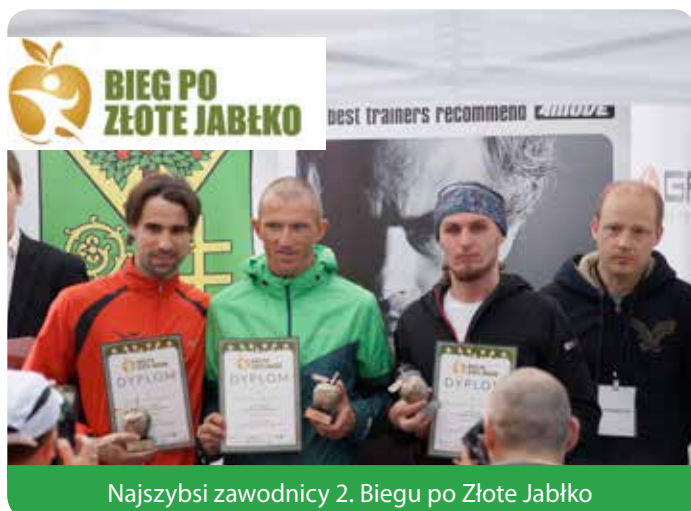
Najszybsi zawodnicy 2. Biegu po Złote Jabłko

Blisko 250 osób wystartowało w biegach przełajowych, które odbyły się w niedzielę 17 maja w Chotomowie w Lasach Chotomowskich.