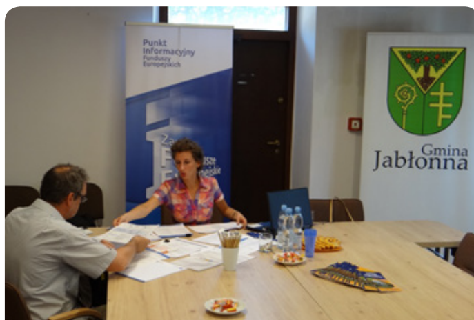
Wizyta w punkcie informacyjnym

Mobilny Punkt Informacyjny Mazowieckiej Jednostki Wdrażania Programów Unijnych odwiedził Jabłonnę na zaproszenie Urzędu Gminy.