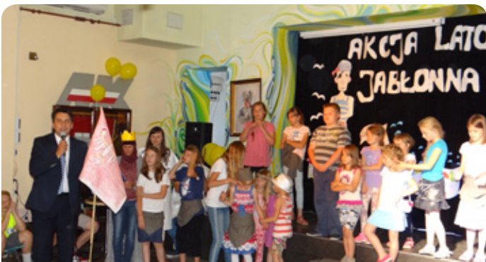
zakończenie akcji Lato