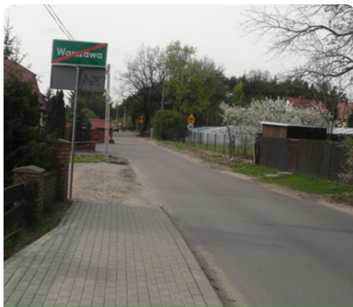
ul. Marmurowa na granicy gminy