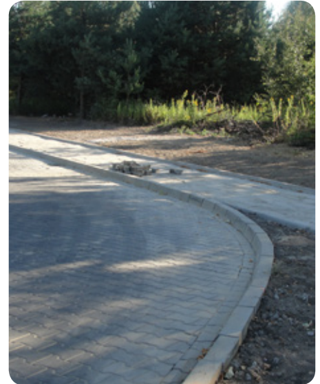
fol. A. Tańska