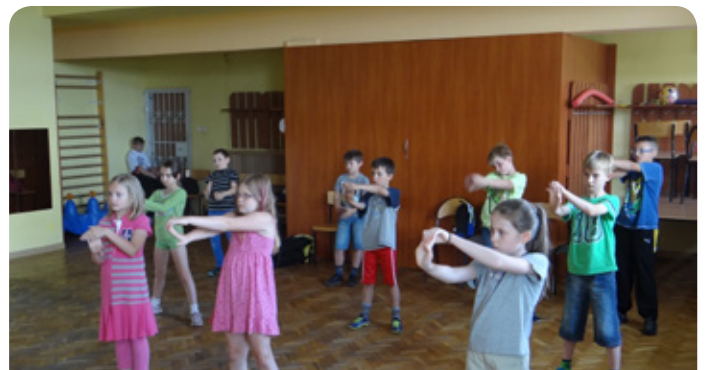
zajęcia w Jabłonie