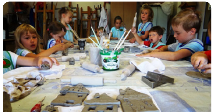
zajęcia z ceramiki