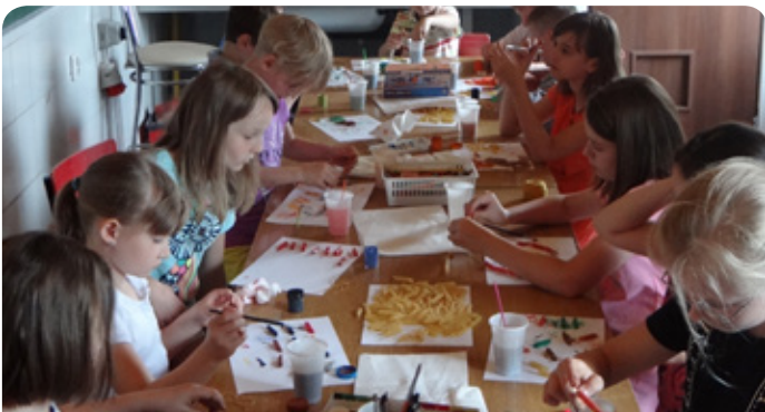
zajęcia w Chotomowie