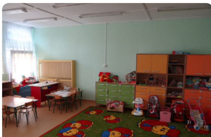
Przedzkole w Chotomowie