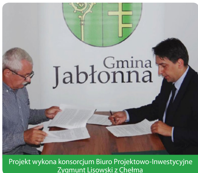
Projekt wykona konsorcjum Biuro Projektowo-Inwestycyjne Zygmunta Lisowskiego z Chełma