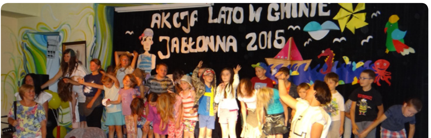
zakończenie akcji Lato