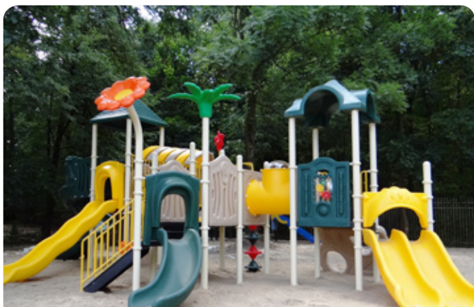
Plac zabaw w Jabłonce

W wakacje w naszych gminnych przedszkolach trwały intensywne prace remontowe. Prace naprawcze i modernizacyjne przeprowadzono w placówkach w Jabłonce i Chotomowie, dzięki czemu dzieci będą mogły uczyć się w odnowionych salach. Na najmłodszych z Jabłonce czeka dodatkowa atrakcja. Na placu za przedszkolem powstał nowy, dostosowany do potrzeb maluchów plac zabaw. Jego użytkownicy będą mogli skorzystać z wieżyczki, zjeżdżalni oraz kolorowych elementów do zabaw ruchowych i zręcznościowych.