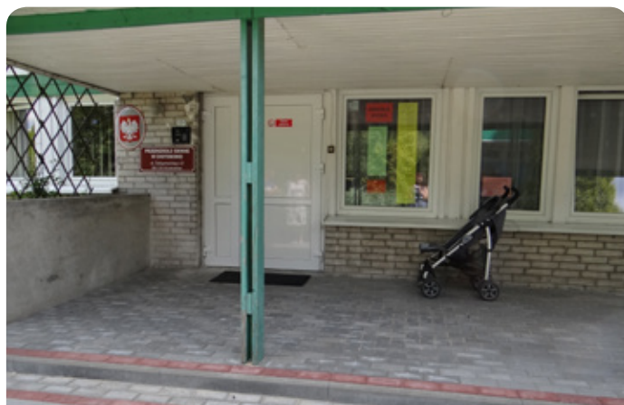
Przedzkole w Chotomowie ma również wyremontowane wejście