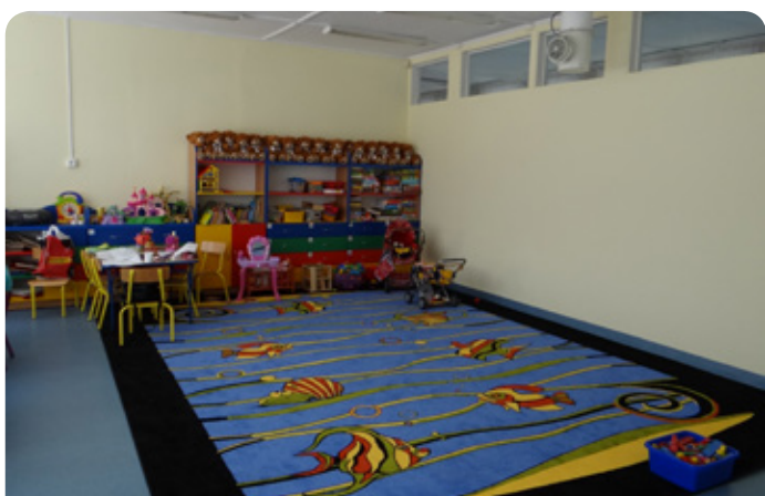
Wyremontowana sala w Chotomowie