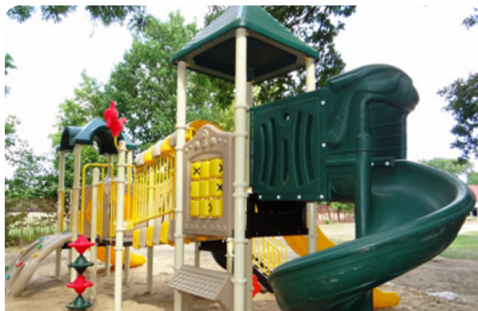
Plac zabaw w Jabłonce