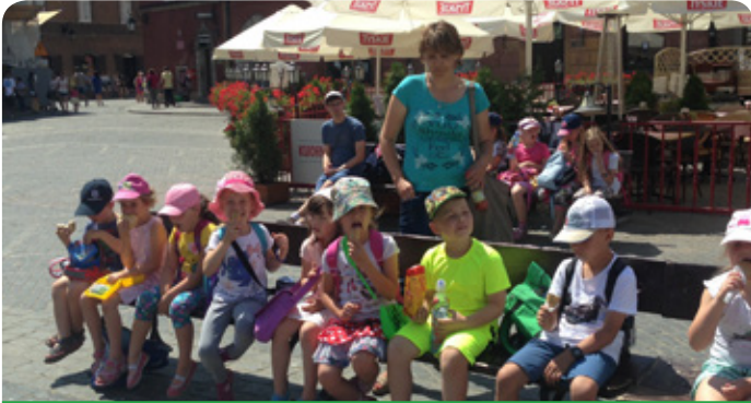
spacer po Starówce