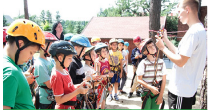
wycieczka do parku linowego