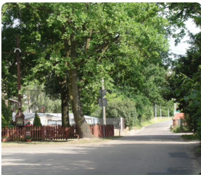
Ulica Szkolna zostanie poszerzona

Dostosowanie lewoskrętów Akademijna- Politechniczna oraz Politechniczna -Przylesie, przebudowa odcinka ul. Szkolnej, jak również budowa brakującej części chodnika, pozwolą na przejazd autobusu przegubowego, dzięki czemu linia 731 będzie obsługiwać większą liczbę pasażerów z naszej gminy.