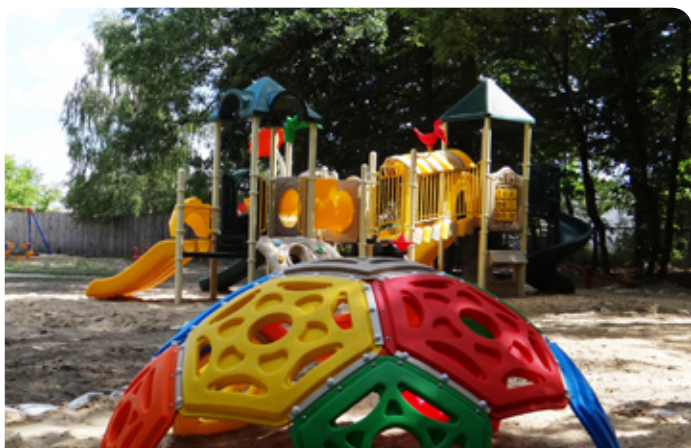
Plac zabaw w Jabłonce