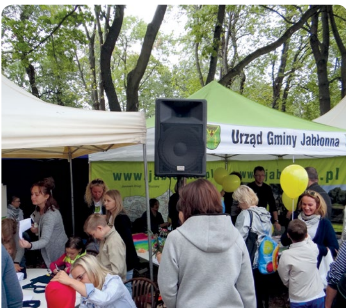
Stoisko Urzędu Gminy Jabłonna

Organizatorami Święta Gminy Jabłonna był: Urząd Gminy oraz Gminne Centrum Kultury i Sportu. Partnerami i sponsorami wydarzenia byli: GAZ System, 32. Wieliszewski Dywizjon Rakietowy Obrony Powietrznej, Powiat Legionowski, Klub Jeździecki Wesołe Kopytko, Związek Kynologiczny w Polsce w Warszawie, Zespół Pałacowo-Parkowy PAN. Patronatem medialnym święto objęły: Wieści z naszej gminy, Gazeta Powiatowa, Legio24 oraz Kurier Informator Powiatu Legionowskiego.