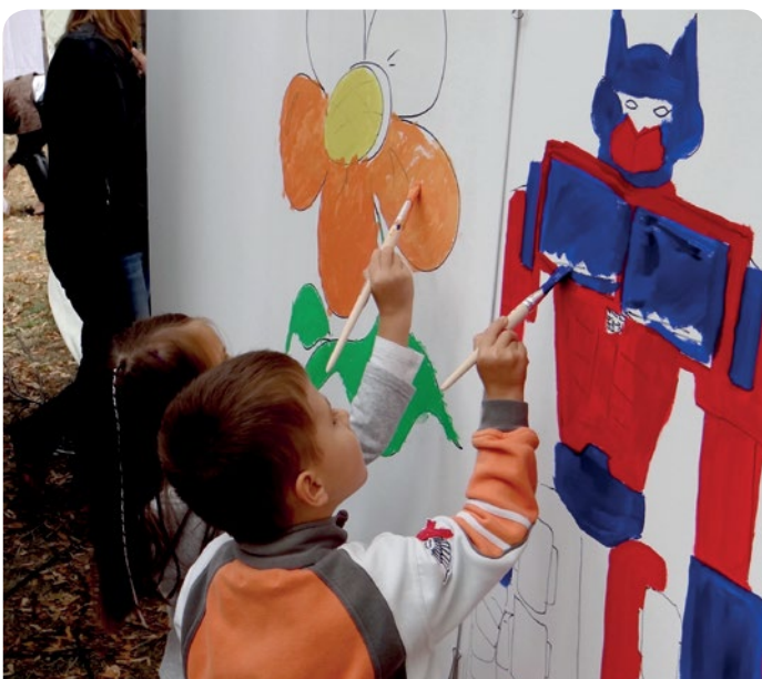
Atrakcje dla najmłodszych