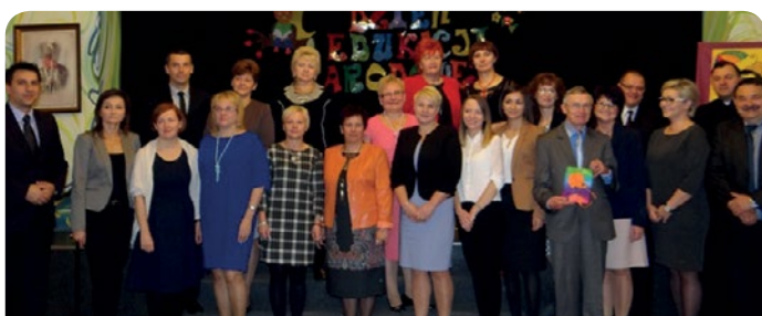
Dzień Edukacji Narodowej

Na początek wystąpiły dzieci z gminnego przedszkola w Jabłonce, które pod wodzą Pań Nauczycielek zaprezentowały swoje artystyczne talenty. Po występie przedszkolaków, odbyła się uroczystość wręczenia Aktów Mianowania oraz Nagród Wójta. Nie zabrakło także życzeń i podziękowań za ciężką pracę jaką nauczyciele wkładają w edukację dzieci i młodzieży z naszej gminy.