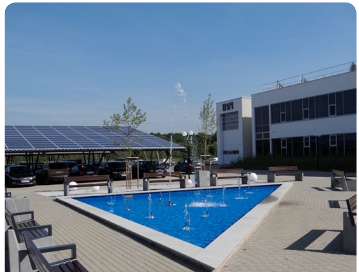
Centrum Badawcze PAN