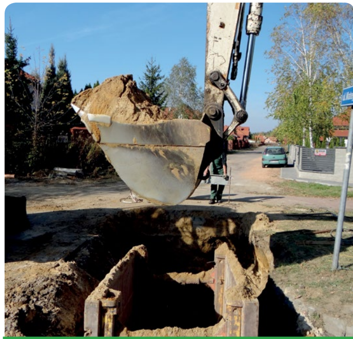
Budowa sieci kanalizacyjnej

Do końca bieżącego roku ma zostać wykonane podłączenie budynku Urzędu Gminy do sieci wodociągowej, co pozwoli na podłączenie do wodociągu również budynków sąsiadujących z urzędem.