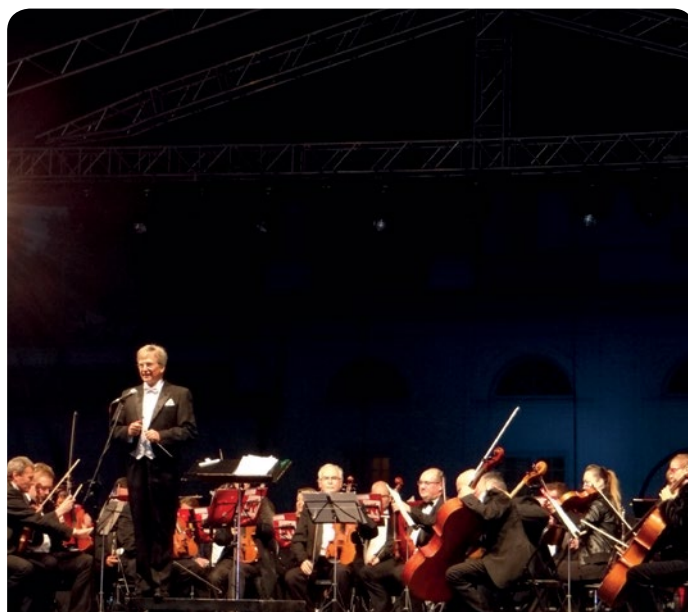
Koncert muzyki filmowej