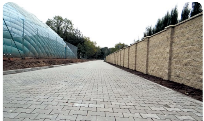
Prace zakończyły się w październiku