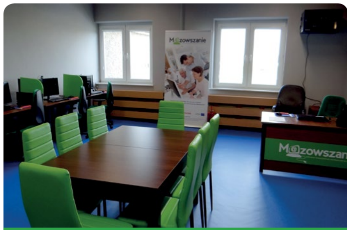
Nowoczesne pomieszczenie przystosowane dla mieszkańców