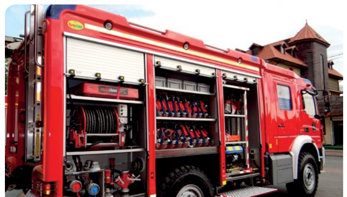
Nowy wóz ratowniczo-gaśniczy OSP Chotomów