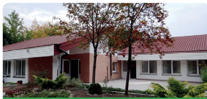
Przedszkole gminne w Jabłonce

w ramach konkursu nr RPMA.10.01.04-IP.01-14-003/15 w ramach Osi priorytetowej X Edukacja dla rozwoju regionu - Działanie 10.1 Kształcenie i rozwój dzieci i młodzieży – Poddziałanie 10.1.4 Edukacja przedszkolna Regionalnego Programu Operacyjnego Województwa Mazowieckiego na lata 2014-2020. Maksymalny poziom dofinansowania, jakie można otrzymać w ramach programu to 80%.