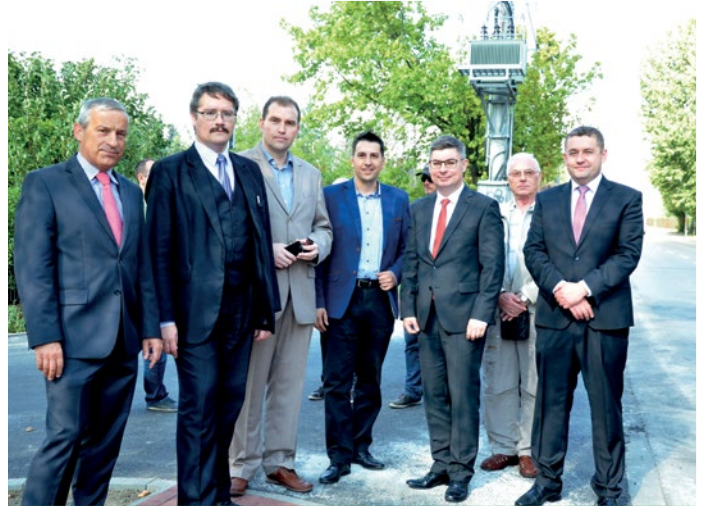
Uczestnicy odbioru technicznego