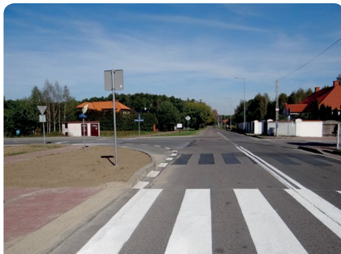
Skrzyżowania ulic Akademijnej i Politechnicznej

W wakacje zdemontowano próg zwalniający na ulicy Szkolnej, a na wysokości skrzyżowania z ul. 1-go Maja zostały przycięte krzewy w skrajni drogi w celu poprawy widoczności. 14 września 2015 r. wyłoniono wykonawcę robót polegających na przebudowie skrzyżowań ul. Akademijnej z ul. Politechniczną i ul. Politechnicznej z ul. Przylesie w Jabłonce w zakresie przystosowania drogi do przejazdu taboru komunikacji miejskiej o długości 18m. Przebudowa prawoskrętu w ulicach Politechniczna i Przylesie została już wykonana. Przesunięte zostało także przejście dla pieszych na ul. Przylesie. Pod koniec września rozpoczęły się również prace przy przebudowie skrzyżowania ulic Akademijnej i Politechnicznej.