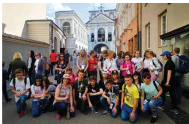
Patriotyczny wyjazd na Litwę, kwiecień 2019 r.

W zeszłym roku dzięki współpracy Gminy Jabłonna ze Stowarzyszeniem Sąsiedzi 05-123 z Dąbrowy Chotomowskiej (w ramach programu współpracy z organizacjami pozarządowymi) uczniowie i nauczyciele z trzech gminnych podstawówek wzięli udział w czterodniowym projekcie „Sąsiedzi się poznają” na Litwie. Zachęteni bardzo dobrą współpracą i powodzeniem projektu w tym roku planujemy jego kontynuację. Tym razem patriotyczny projekt „Sąsiedzi się poznają” będzie kontynuowany na... Ukrainie o czym będziemy informować w kolejnych wydaniach informatora „Więści z Naszej Gminy”. ●