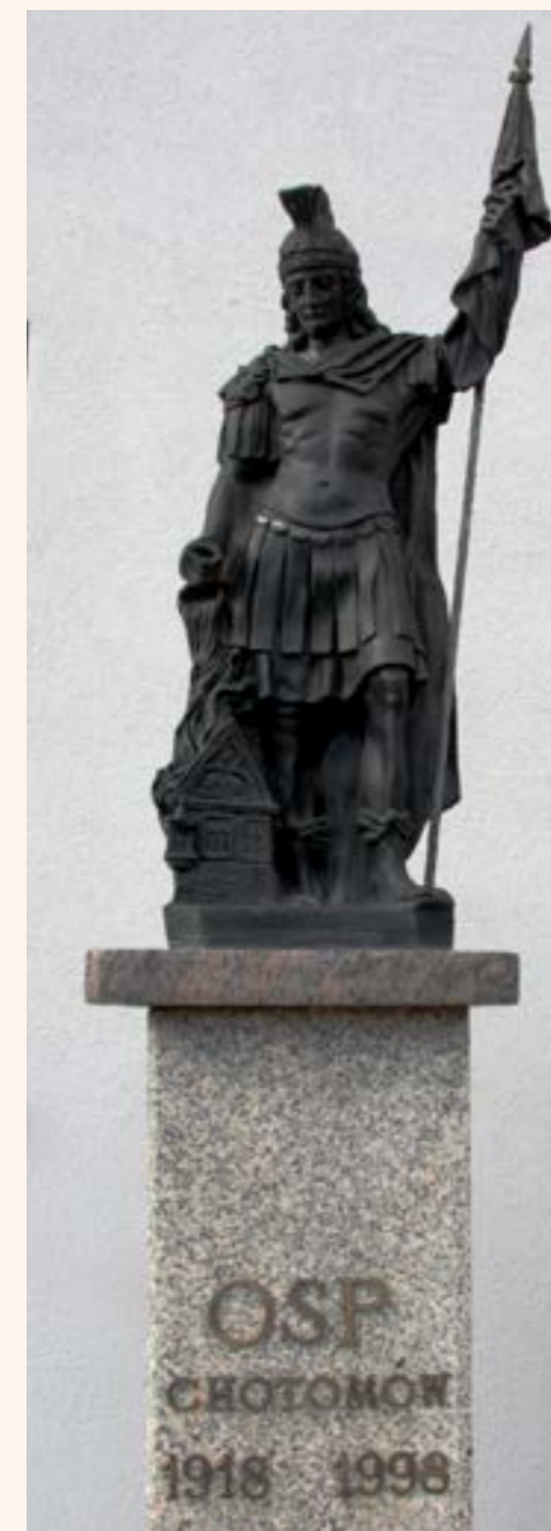
15. Figura Św. Floriana - patrona strażaków, przed budynkiem OSP w Chotomowie.