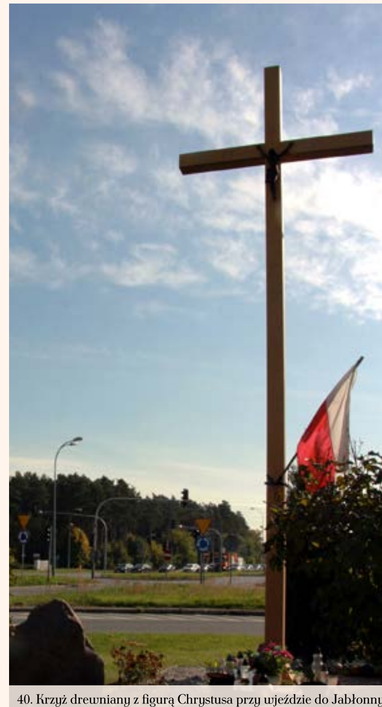
40. Krzyż drewniany z figurą Chrystusa przy wjeździe do Jabłonn przy rondzie na ul. Modlińskiej.