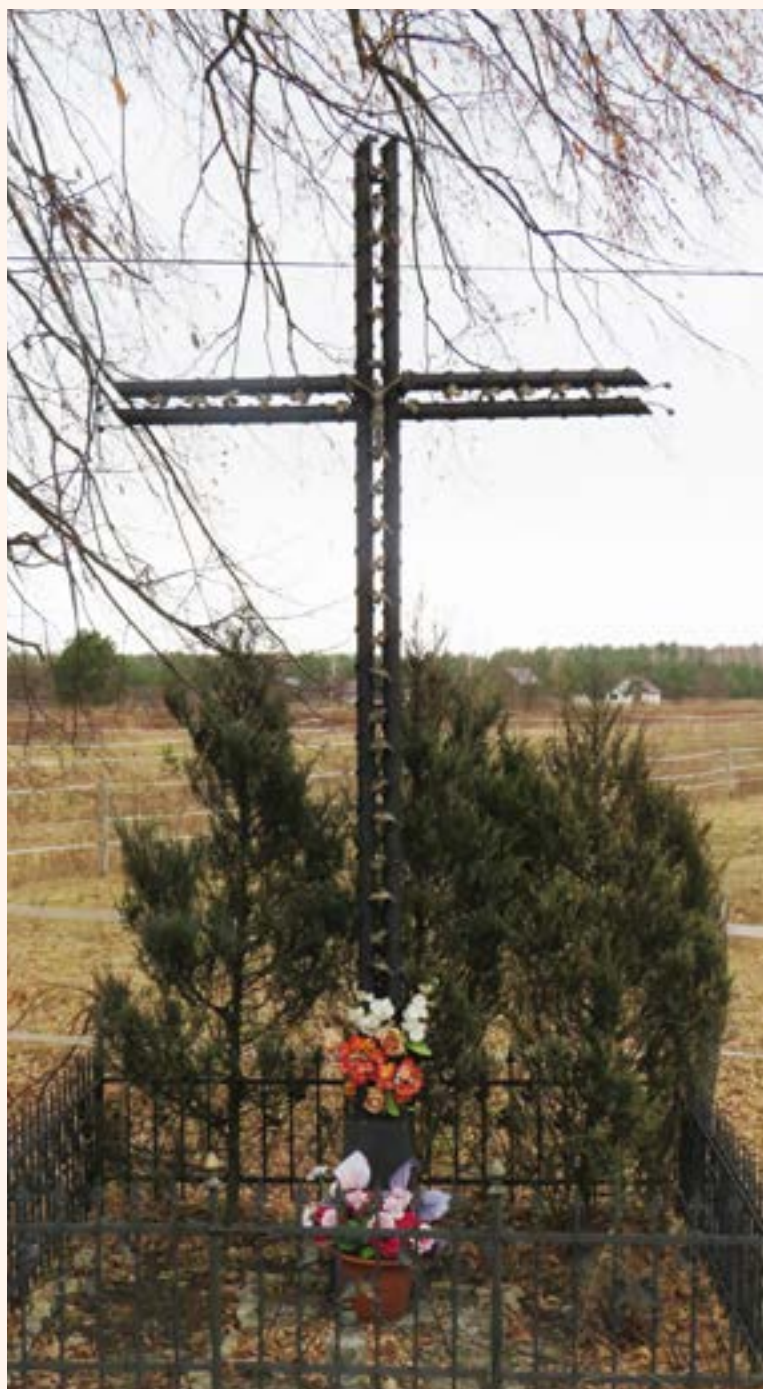
55. Krzyż żelazny przy ul. Granitowej.