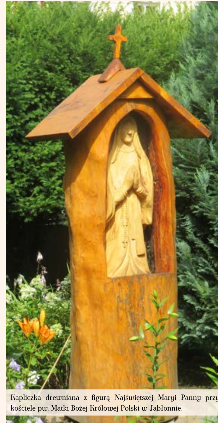
Kapliczka drewniana z figurą Najświętszej Maryji Panny przy kościele pw. Matki Bożej Królowej Polski w Jabłonie.