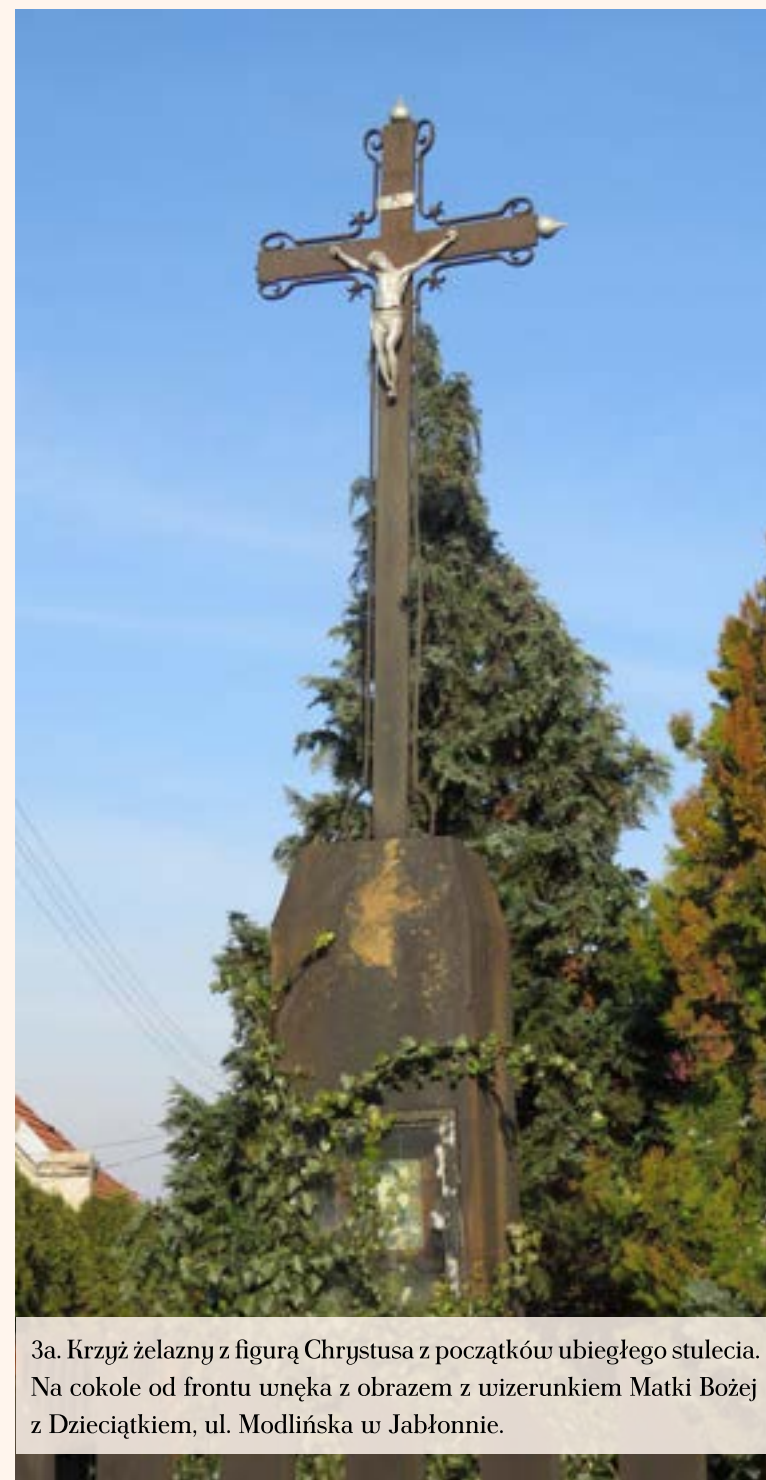
3a. Krzyż żelazny z figurą Chrystusa z początków ubiegłego stulecia. Na cokole od frontu wnęka z obrazem z wizerunkiem Matki Bożej z Dzieciątkiem, ul. Modlińska w Jabłonnie.