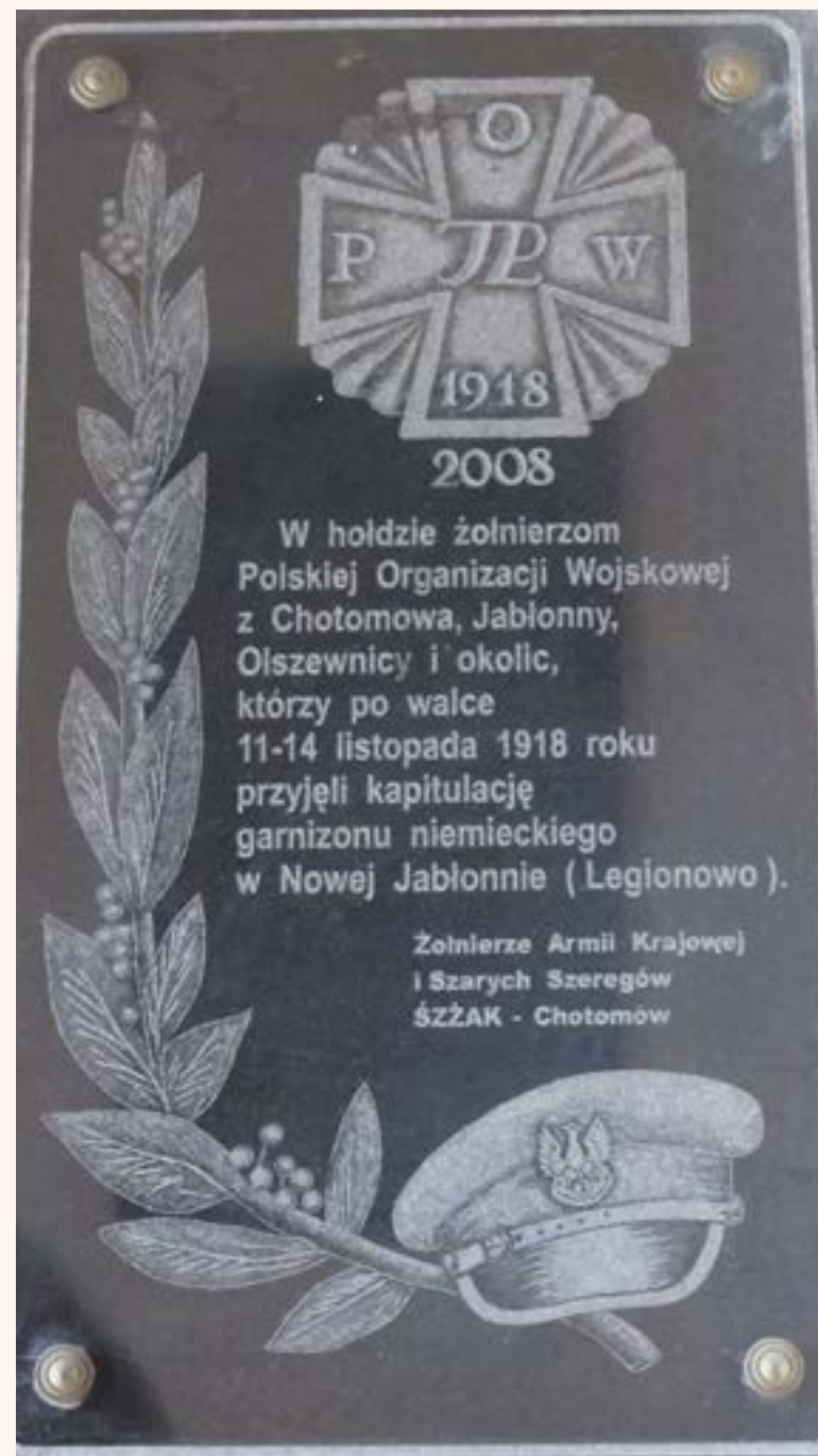
72, 73. Tablica pamiątkowa poświęcona żołnierzom Armii Krajowej oraz płyta upamiętniająca żołnierzy Polskiej Organizacji Wojskowej umiejscowione w kościele pw. Wniebowzięcia Najświętszej Maryi Panny w Chotomowie