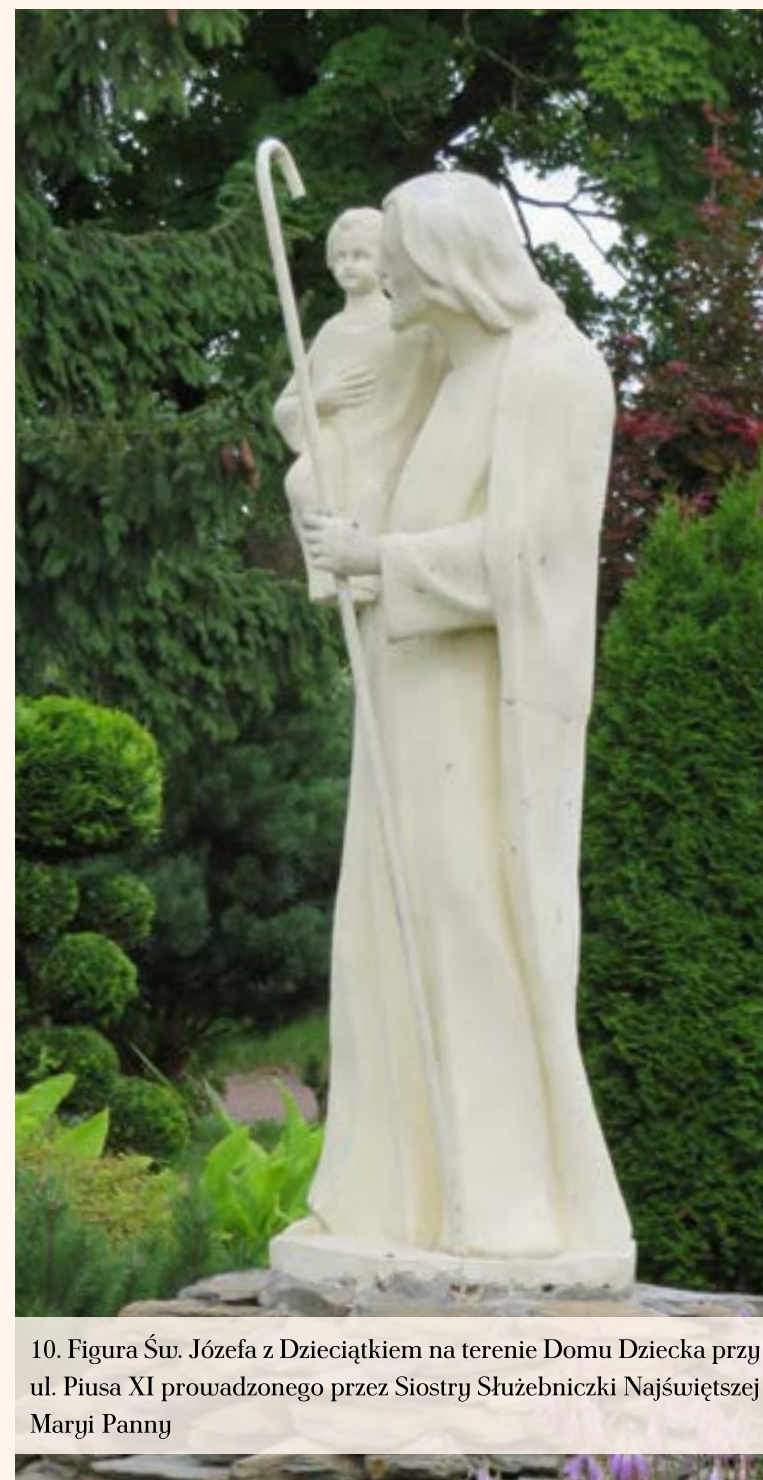
10. Figura Św. Józefa z Dzieciątkiem na terenie Domu Dziecka przy ul. Piusa XI prowadzonego przez Siostry Służebniczki Najświętszej Maryi Panny