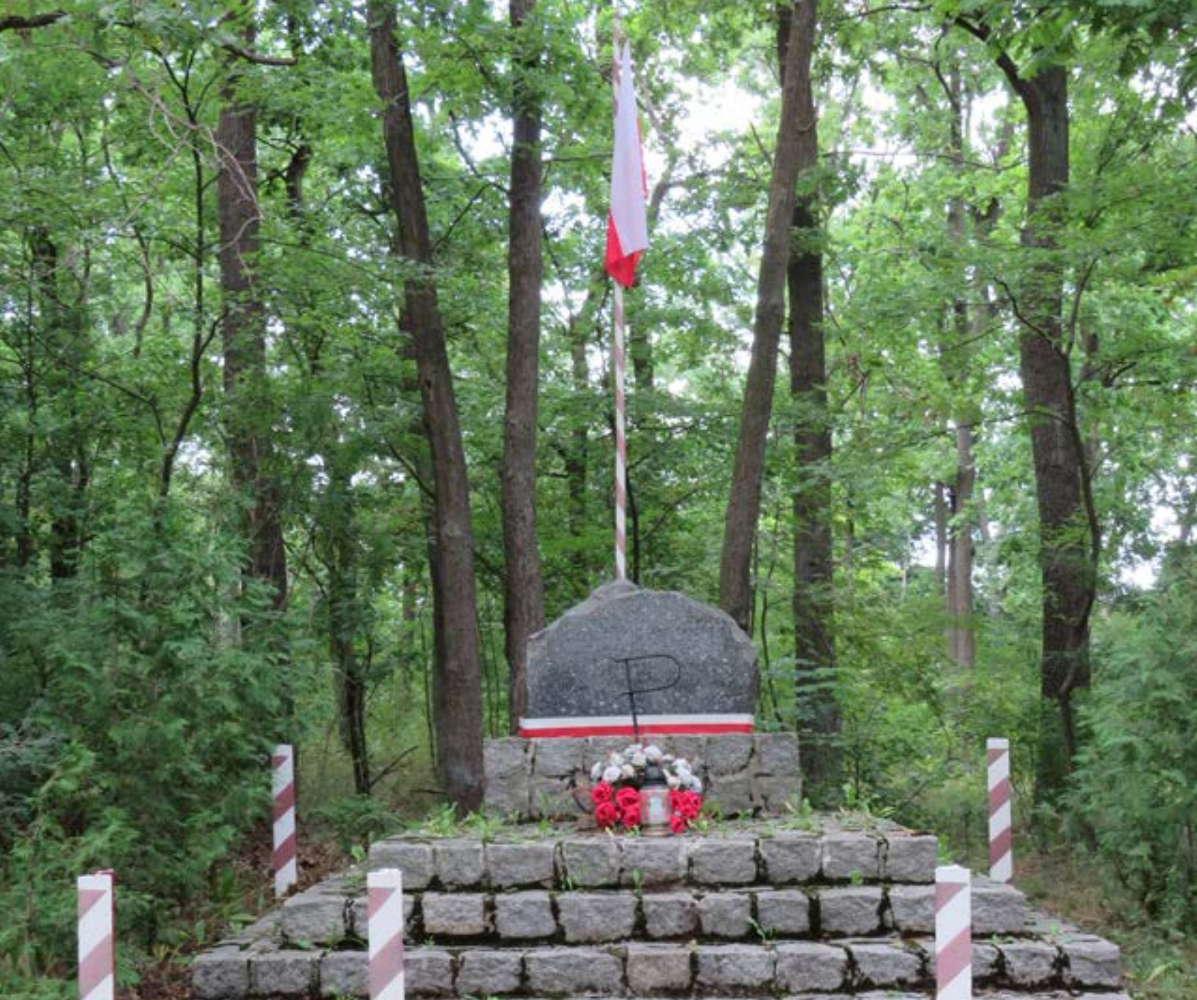
81. Obelisk upamiętniający pomordowanych w latach 1939-1945 w Chotomowie. Kamienny obelisk znajduje się w lesie, przy drodze nr 630 prowadzącej z Jabłonną do Nowego Dworu Mazowieckiego. Odświeżony 14 października 1973 r. monument upamiętnia pomordowanych przez hitlerowców. Wśród rozstrzelanych było wielu więźniów warszawskiego Pawiaka.