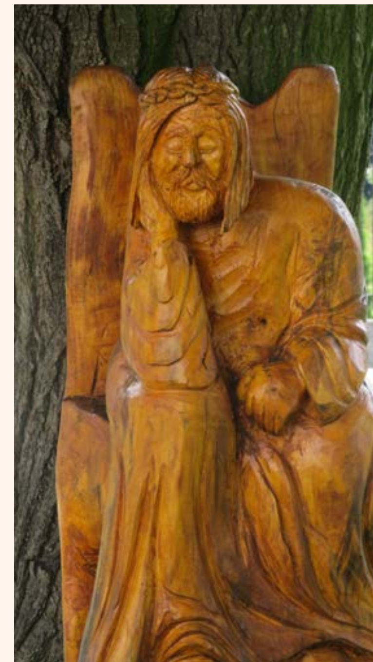
Drewniana rzeźba Chrystusa Frasobliwego przy kościele pw. Matki Bożej Królowej Polski w Jabłonie.