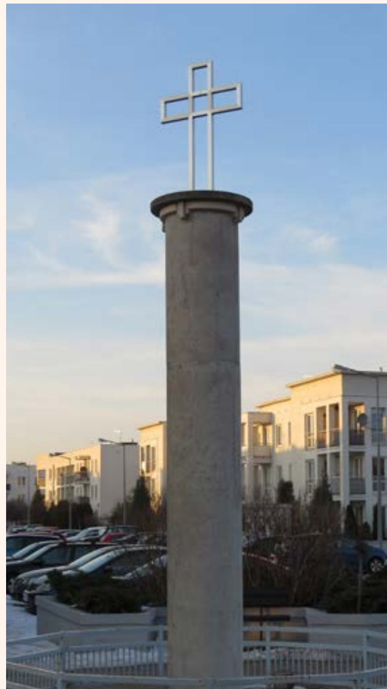
43. Krzyż żelazny na kolumnowym cokole przy ul. Przylesie w Jabłonie.