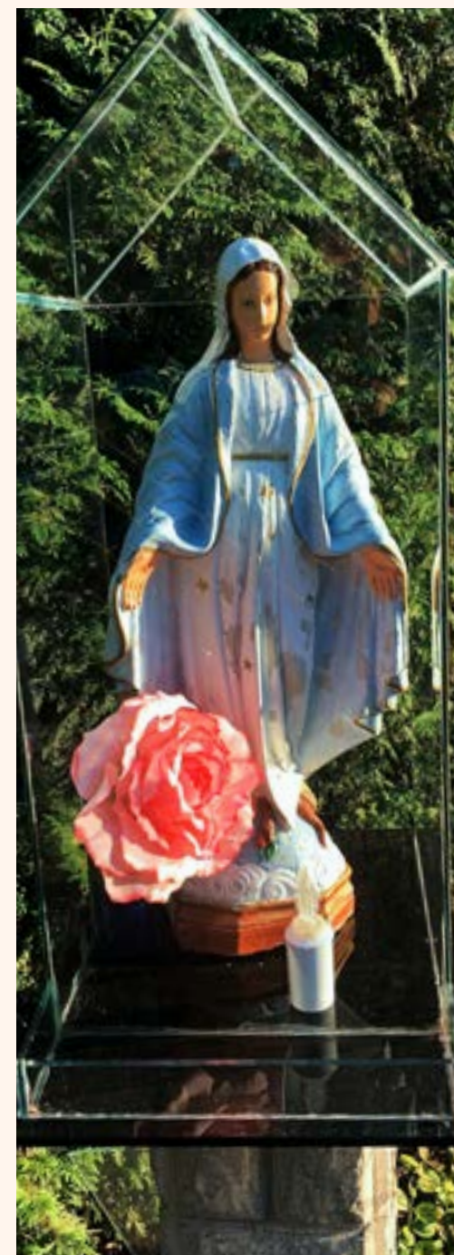
14. Kapliczka z figurą Matki Boskiej w Chotomowie przy ul. Żeligowskiego.