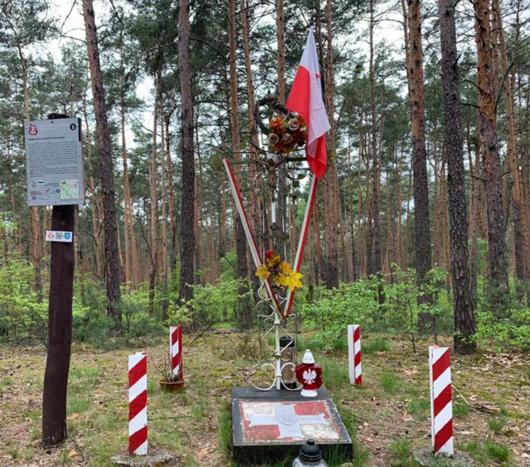
61. Miejsce mordu w Lasach Chotomowskich.