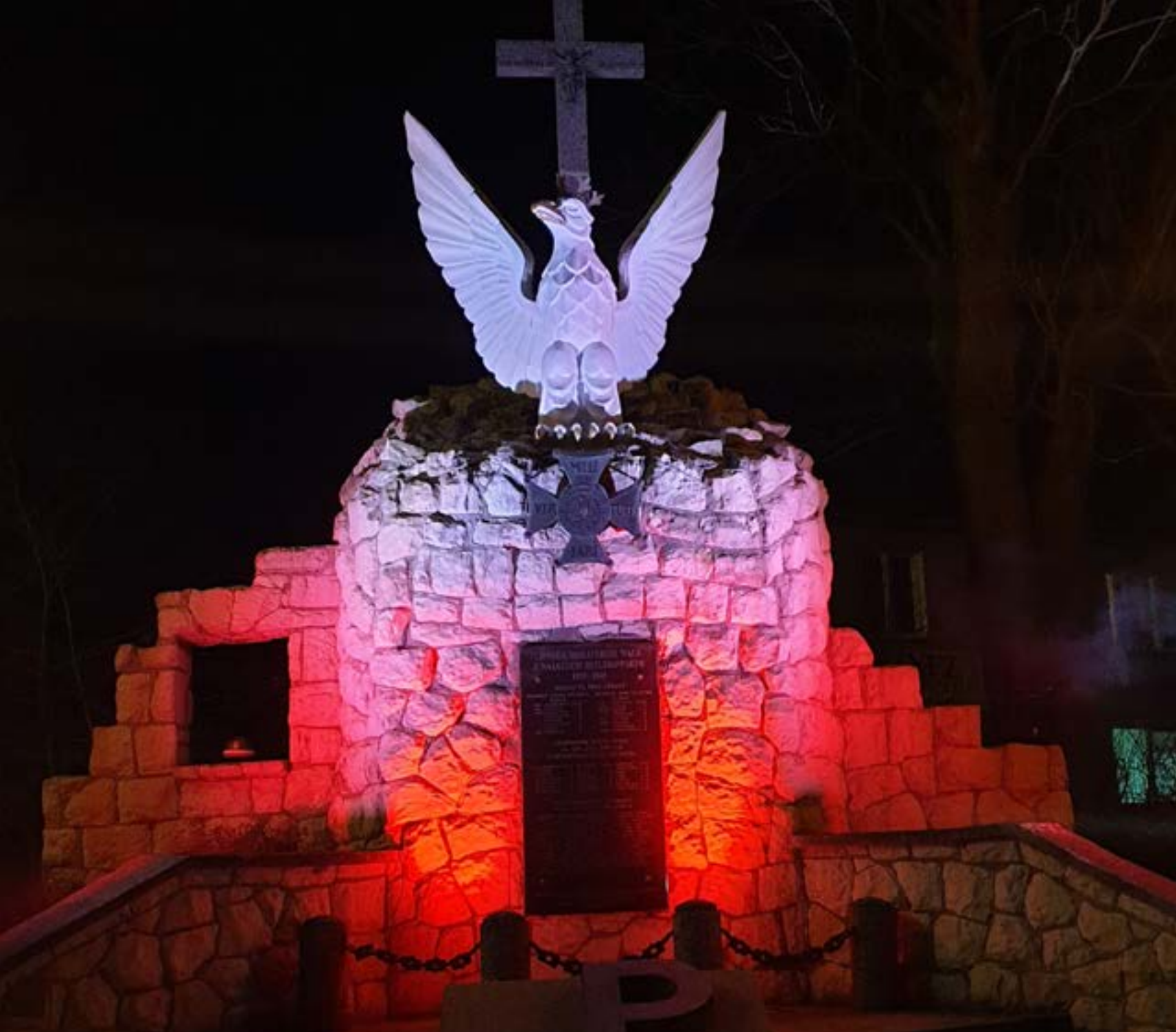
66. Pomnik u zbiegu ulic Piusa XI i Partyzantów w Chotomowie