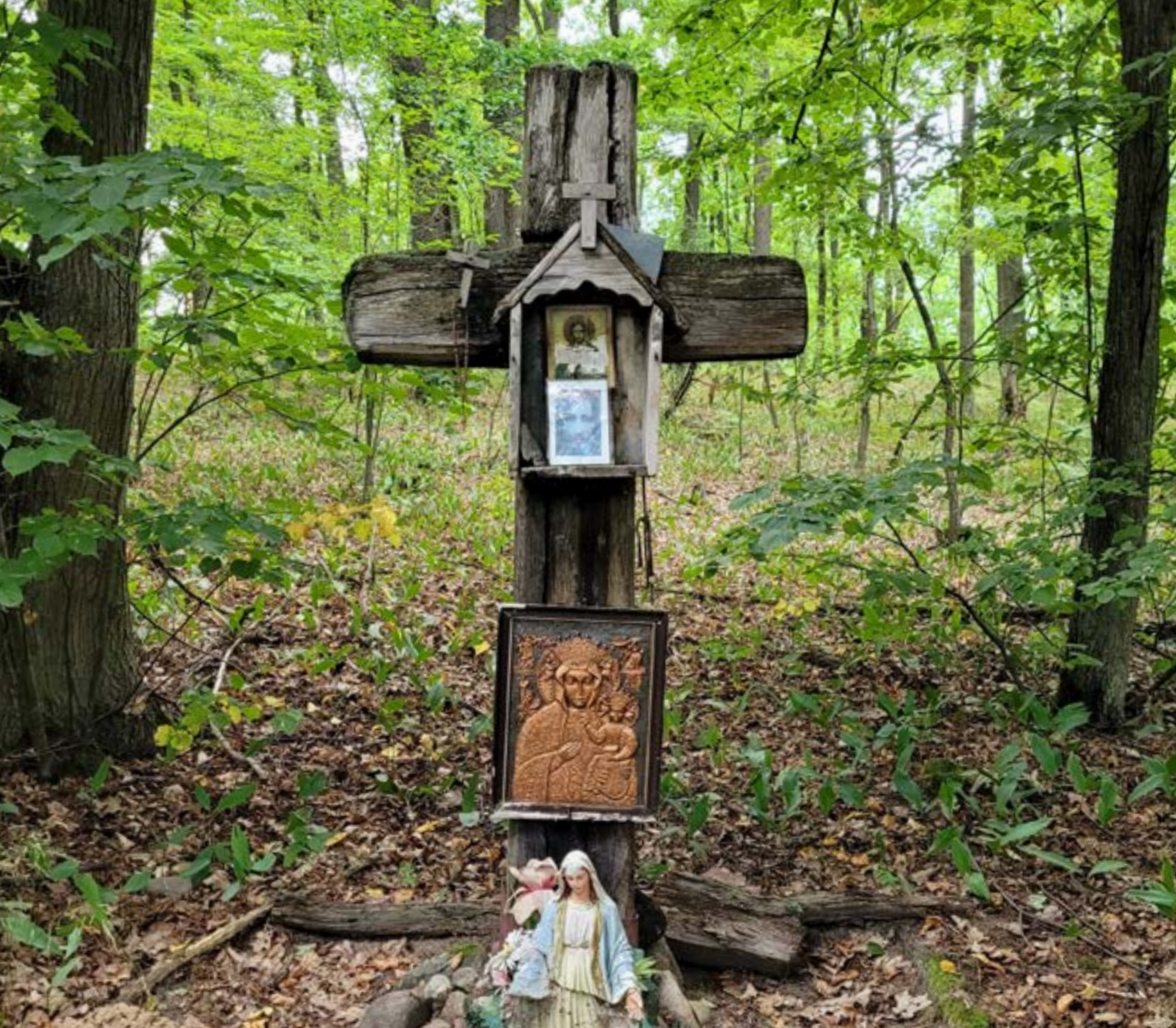
1a. Krzyż drewniany z kapliczką w Jabłonie, w lesie w pobliżu leśniczówki. W kapliczce i przy krzyżu obrazy, m.in. z wizerunkiem Matki Boskiej Częstochowskiej.