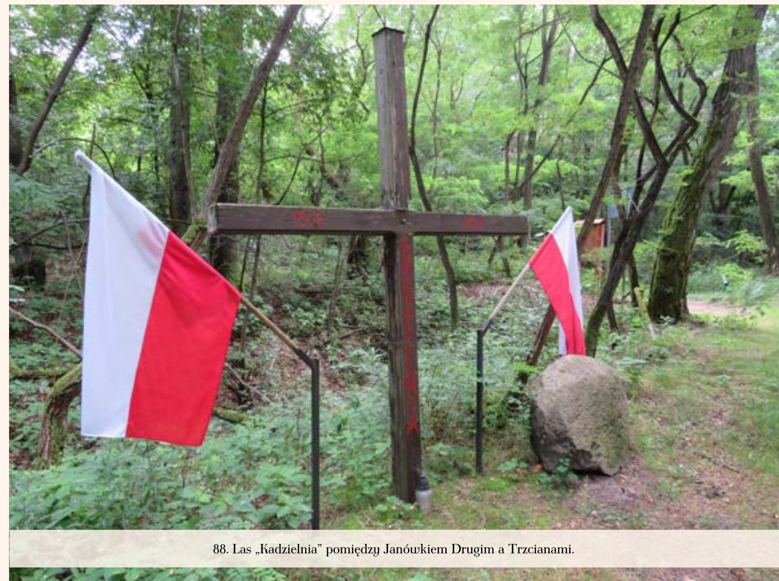
88. Las „Kadzielnia” pomiędzy Janówkiem Drugim a Trzcianami.

Na przełomie lat 1939/1940 Niemcy zamordowali w uroczysku „Kadzielnia” na terenie wsi Trzciany (w lesie, w północno-zachodniej części wsi, tuż przy granicy z Janówkiem Drugim) grupę mieszkańców Nowego Dworu Mazowieckiego i okolic. Prawdopodobnie w „Kadzielni” ginęli również więźniowie warszawskiego Pawiaka. Na pamiątkę tych tragicznych wydarzeń postawiono na skraju lasu uroczyska drewniany krzyż. Według zeznań świadka, las ten służył także do realizacji Akcji T4, którą narodowi socjaliści nazywali pozbawianiem „życia niewartego życia”. Za tą nazwą kryło się bestialskie mordowanie osób chorych psychicznie i fizycznie.