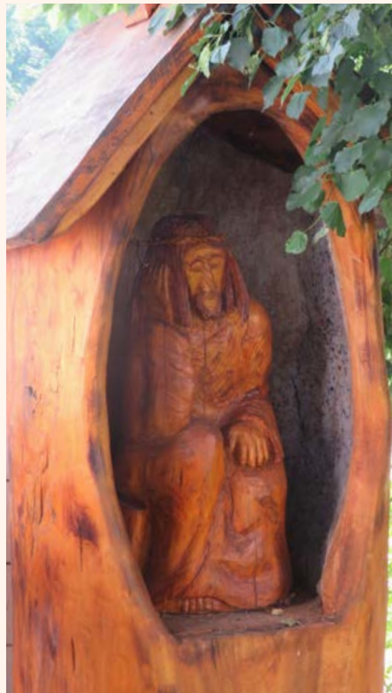
Kapliczka drewniana z figurą Chrystusa Frasobliwego przy kościele pw. Matki Bożej Królowej Polski w Jabłonnie.