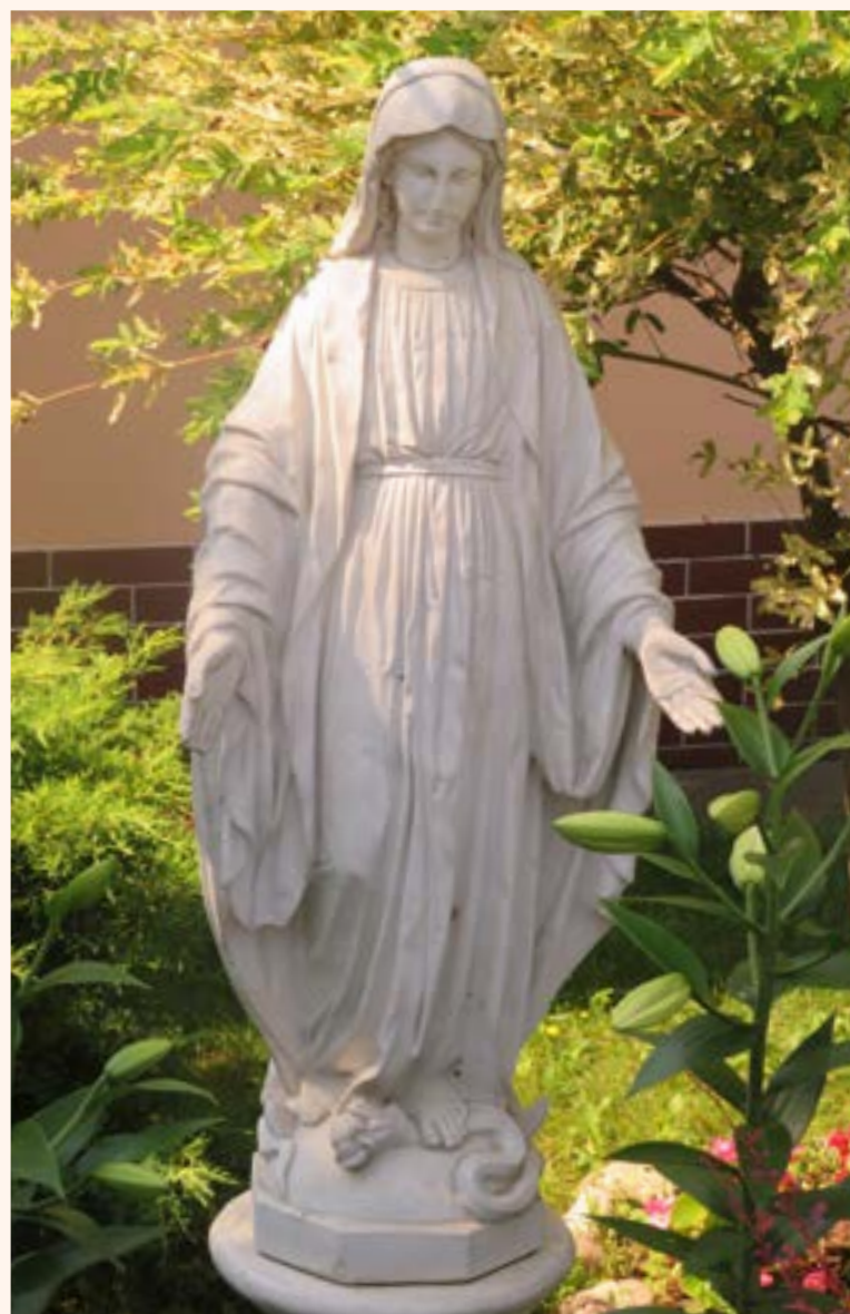
9. Figura Matki Bożej Niepokalanej przy ul. Pięknej została ustawiona w intencji dziękczynnej, Właścicielka posesji uległa wypadkowi, potrącił ją samochód gdy przechodziła przez jezdnię na zielonym świetle. Kobieta doznała poważnych obrażeń, jednak ocalała życie. W podziękowaniu za opiekę i doznaną łaskę ustawiła w ogrodzie przed domem figurę Niepokalanej.