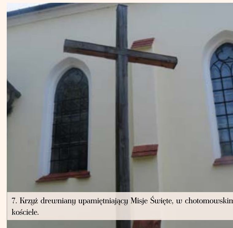
7. Krzyż drewniany upamiętniający Misje Święte, w chotomowskim kościele.