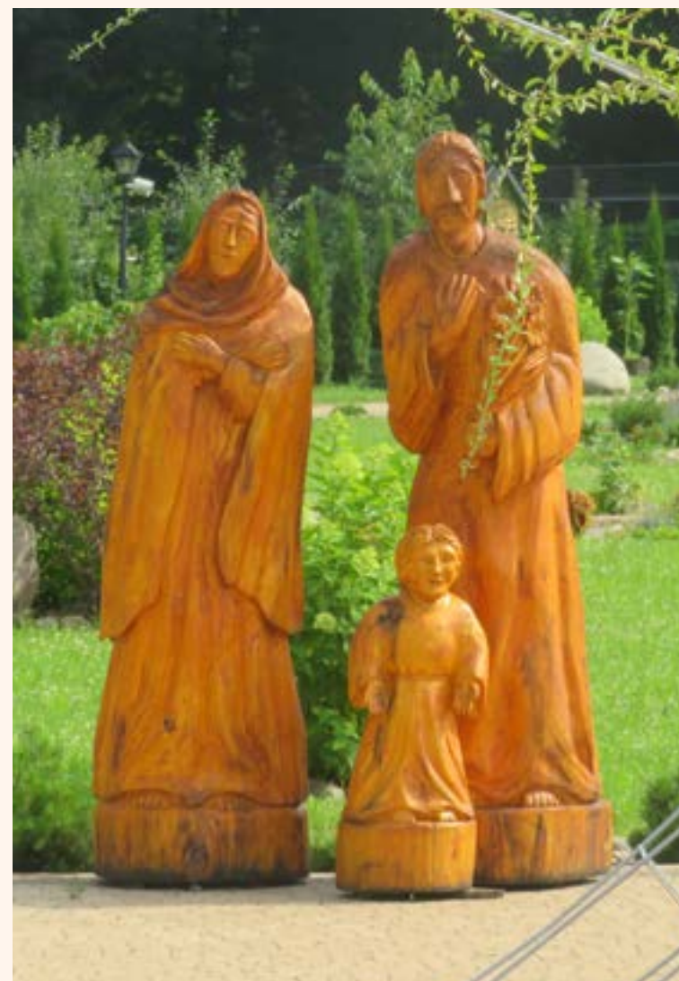
28. Figury Świętej Rodziny.