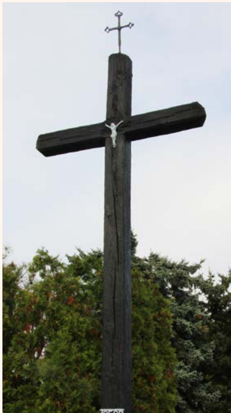
42. Krzyż drewniany z figurą Chrystusa przy ul. Modlińskiej w Jabłonie.