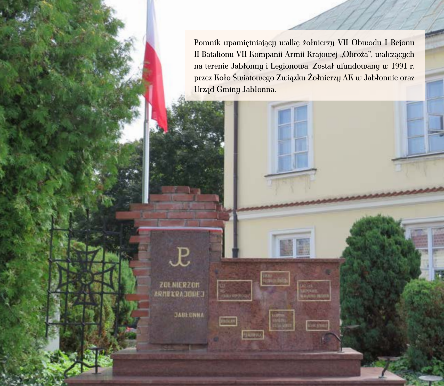
78. Pomnik Armii Krajowej na skwerze Armii Krajowej, przy budynku Urzędu Gminy w Jabłonce.

Pomnik upamiętniający walkę żołnierzy VII Obwodu I Rejonu II Batalionu VII Kompanii Armii Krajowej „Obroza”, walczących na terenie Jabłonnicy i Legionowa. Został ufundowany w 1991 r. przez Koło Światowego Związku Żołnierzy AK w Jabłonce oraz Urząd Gminy Jabłonna.