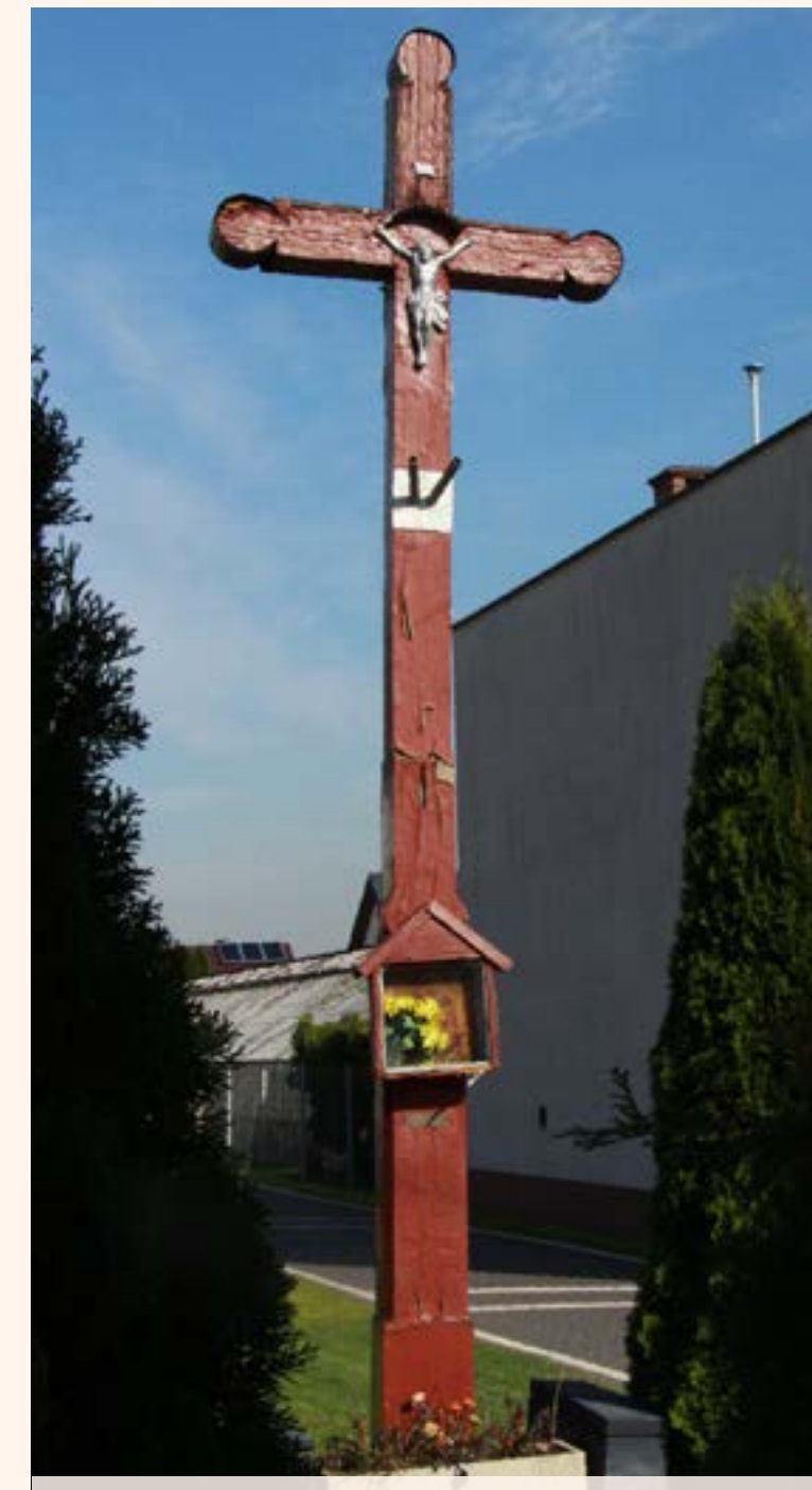
41. Krzyż drewniany z kapliczką przy ul. Modlińskiej w Jablonnie.