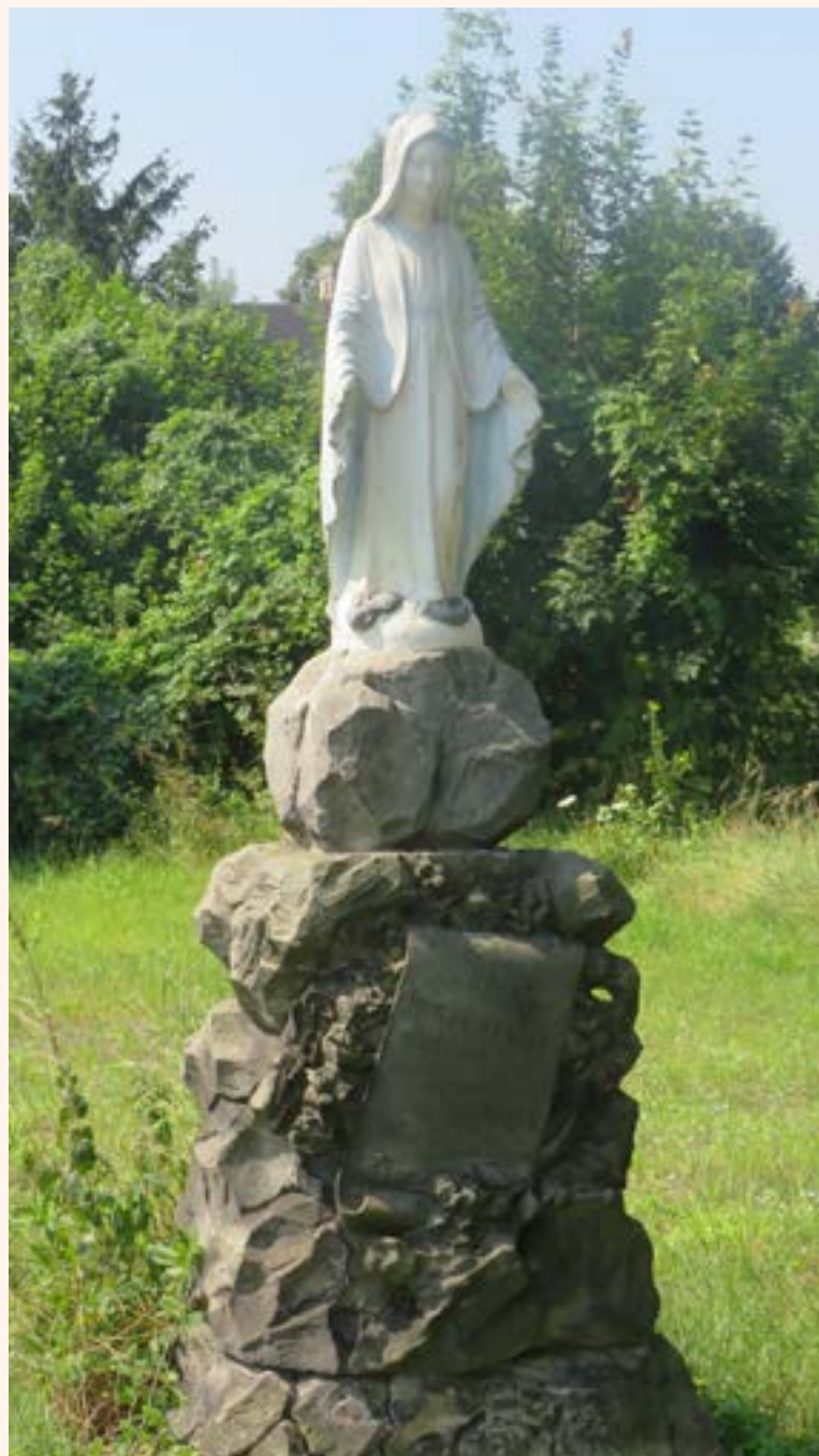
7a. Figura Najświętszej Maryji Panny na murowanym cokole z 1949 r., u zbiegu ulic Pięknej i Leśnej w Chotomowie.