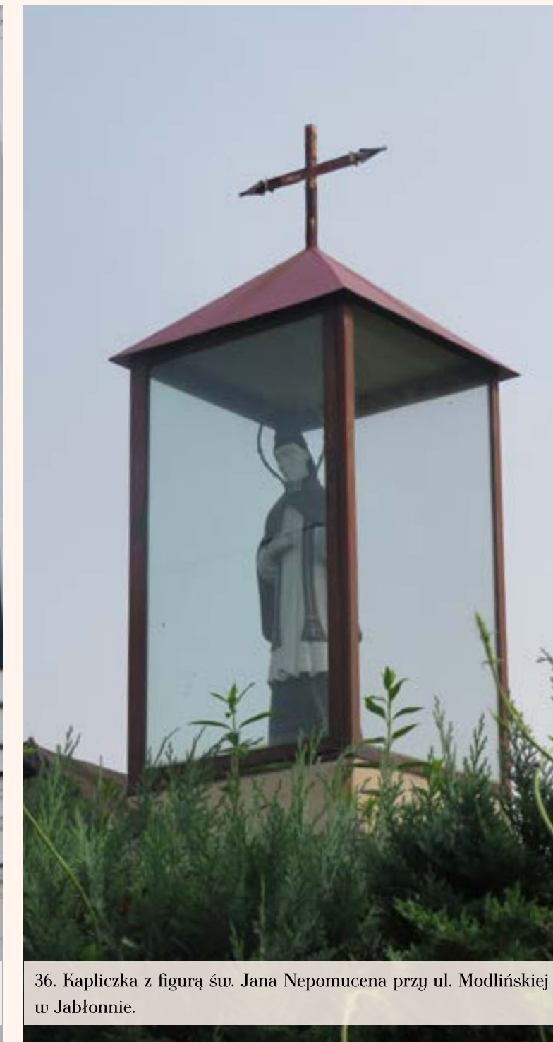
36. Kapliczka z figurą św. Jana Nepomucena przy ul. Modlińskiej w Jabłonie.