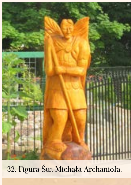
32. Figura Św. Michała Archanioła.