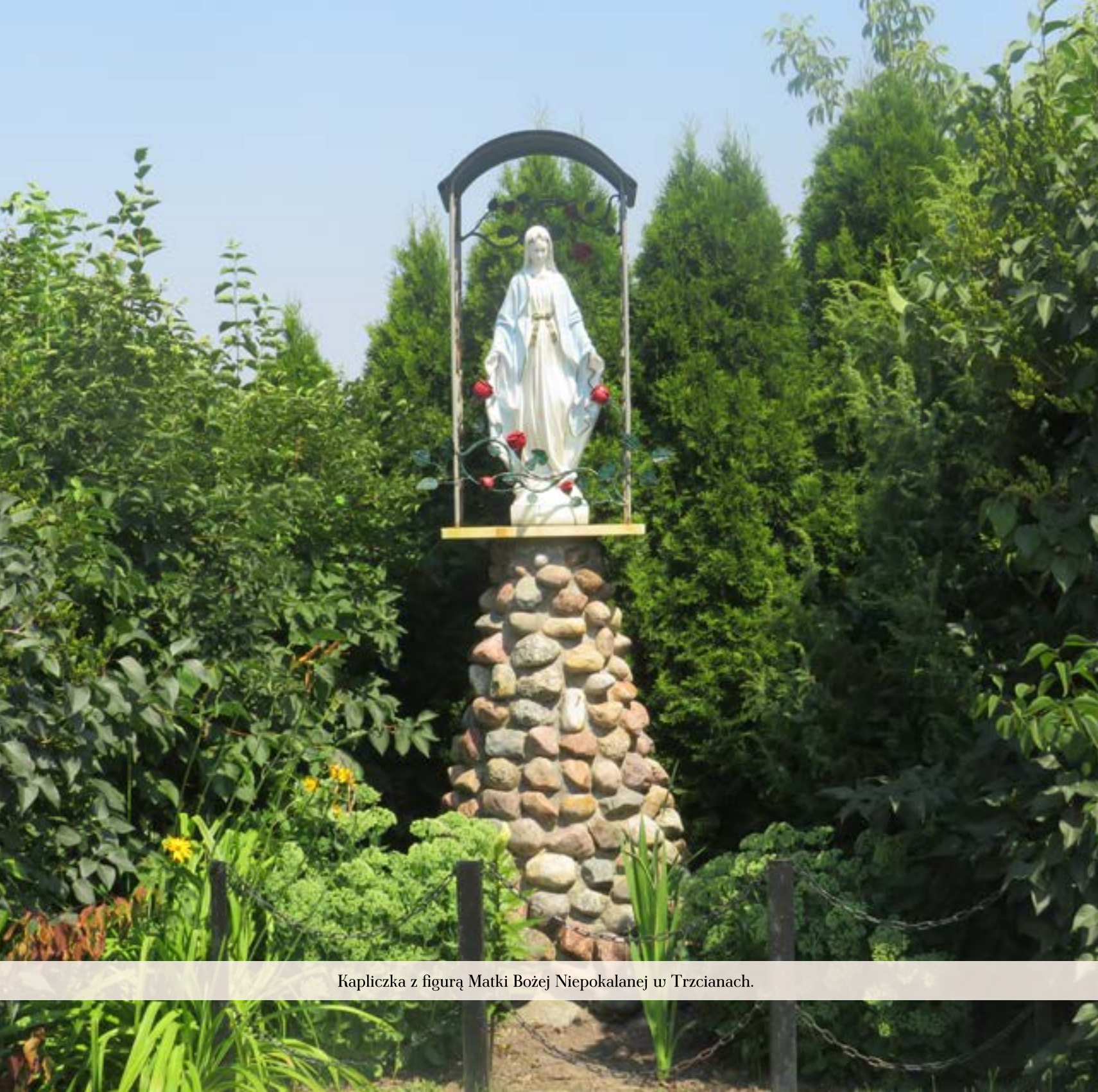
Kapliczka z figurą Matki Bożej Niepokalanej w Trzcianach.