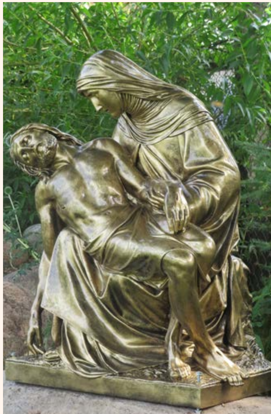
27. Pieta na przykościelnym terenie. Przedstawia Matkę Bożą trzymającą na kolanach ciało Jezusa Chrystusa.