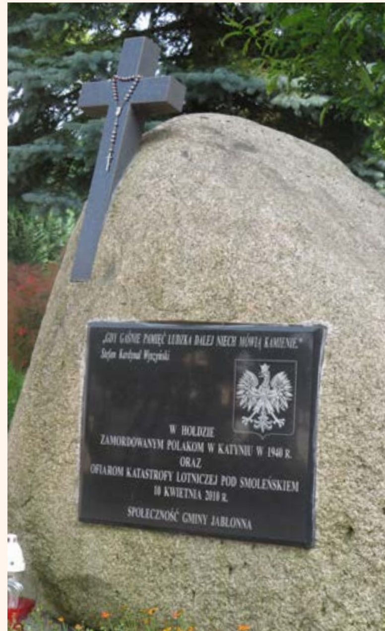
80. Głaz poświęcony pamięci oficerów zamordowanych w Katyniu w 1940 r. oraz pamięci ofiar katastrofy pod Smoleńskiem 10 kwietnia 2010 r. Znajduje się przy kościele pw. Matki Bożej Królowej Polski w Jabłonce.