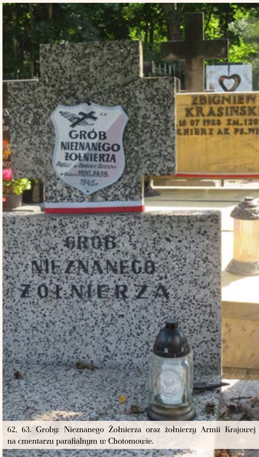
62, 63. Groby: Nieznanego Żołnierza oraz żołnierzy Armii Krajowej na cmentarzu parafialnym w Chotomowie.