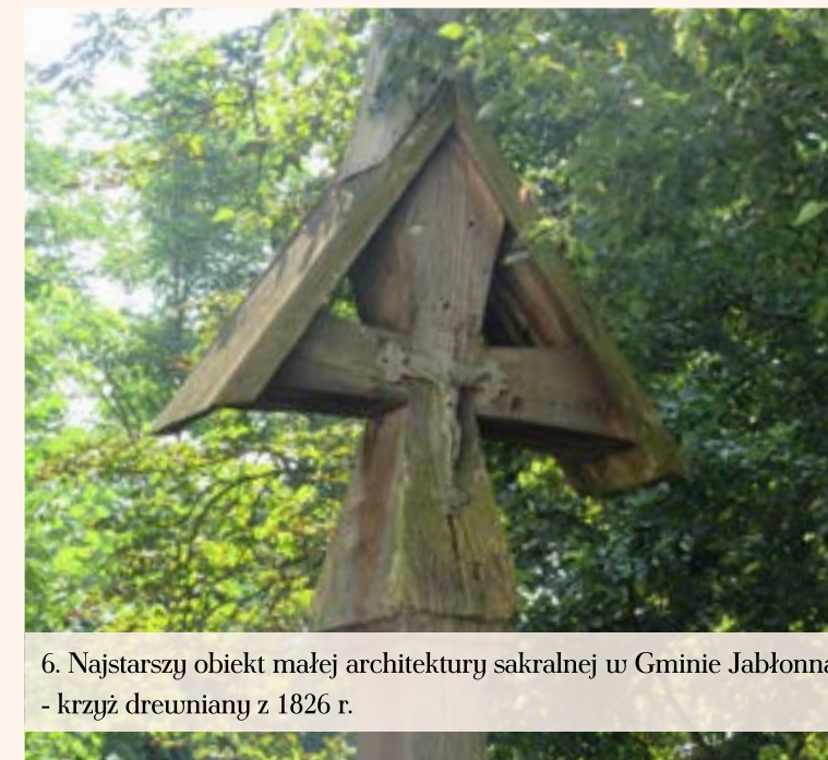
6. Najstarszy obiekt małej architektury sakralnej w Gminie Jabłonna - krzyż drewniany z 1826 r.