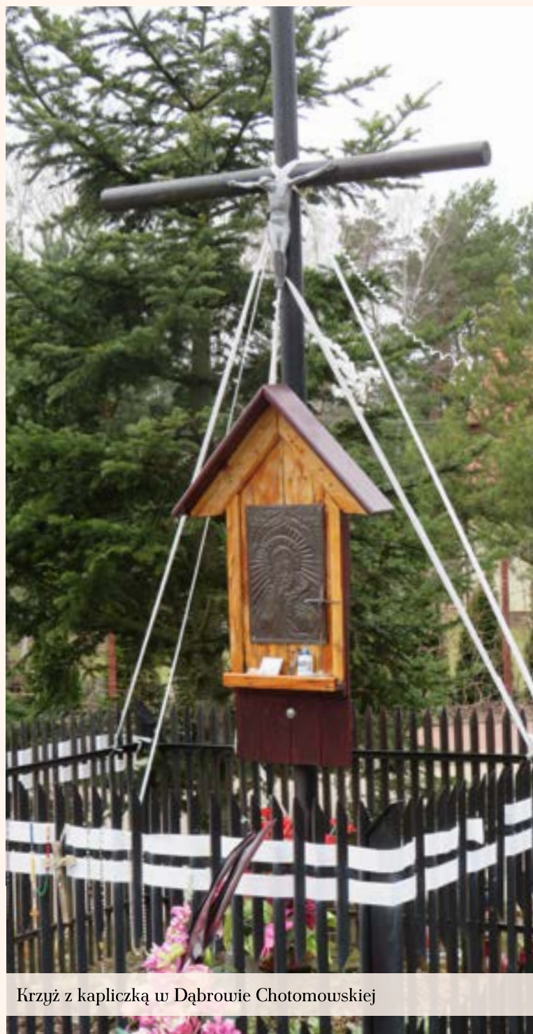
Krzyż z kapliczką w Dąbrowie Chotomowskiej