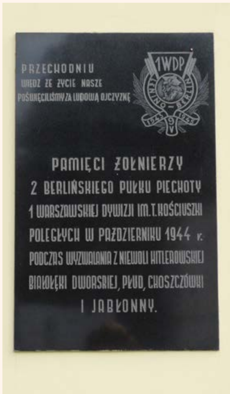
85. Tablica na budynku Urzędu Gminy w Jabłonie, ul. Modlińska.