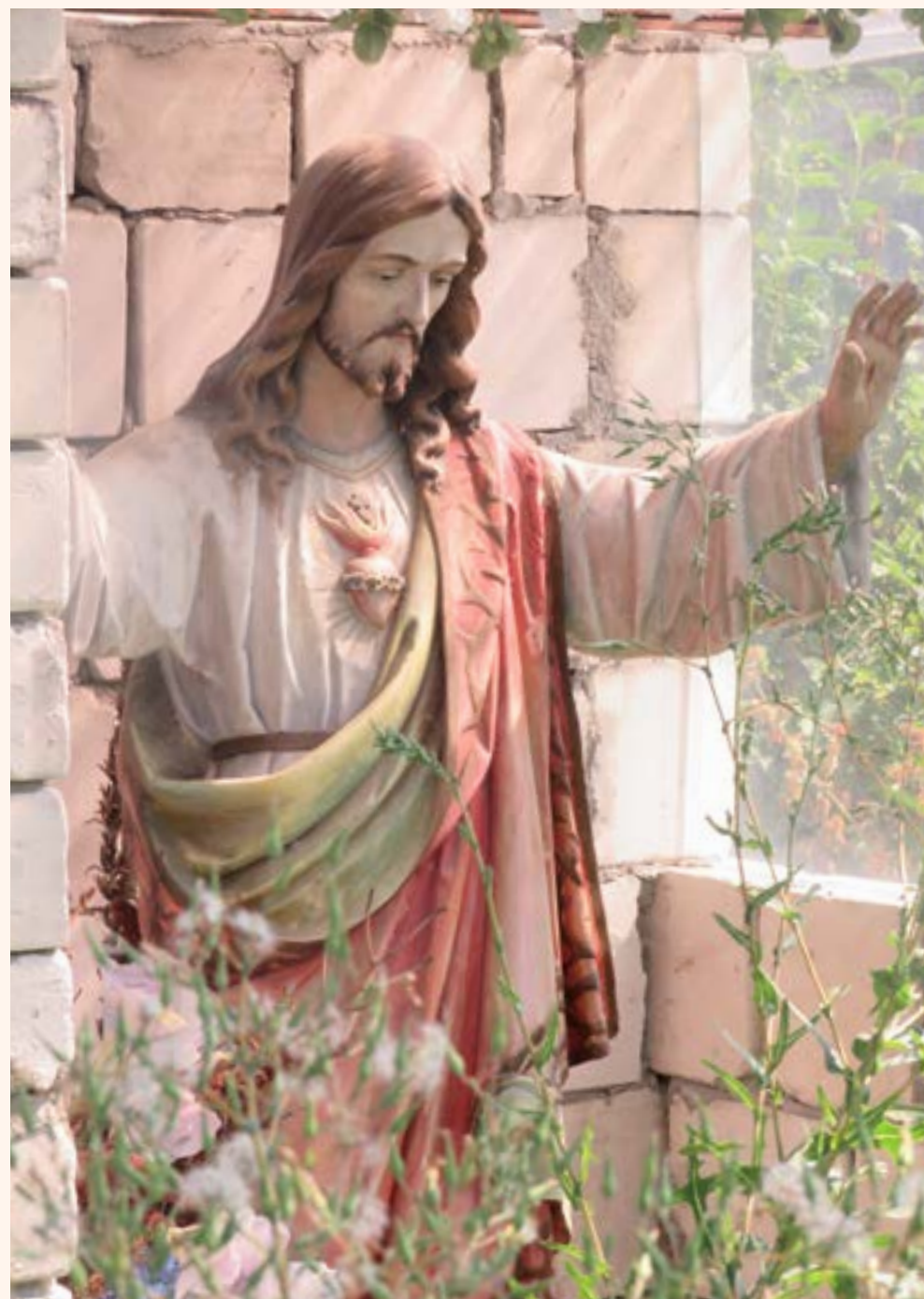
13. Figura Najświętszego Serca Pana Jezusa przy ul. Pięknej.