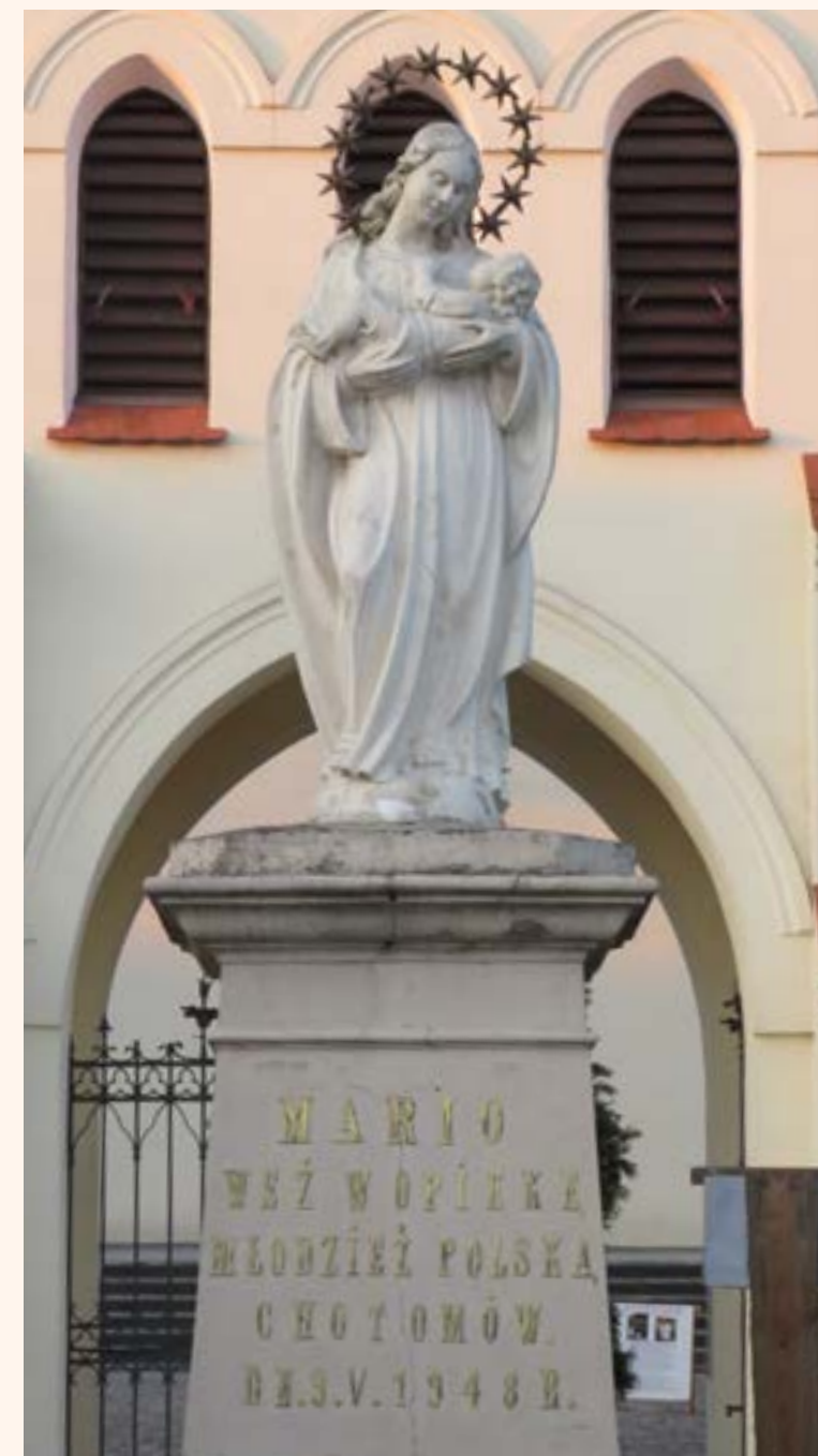
6a. Figura Matki Bożej przed kościołem pw. Wniebowzięcia Najświętszej Maryi Panny w Chotomowie ma już 75. lat.