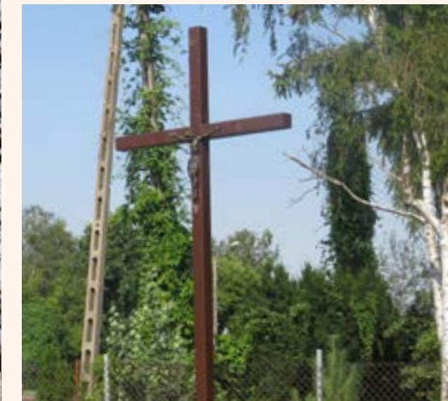
2a. Krzyż drewniany u zbiegu ulic Modlińskiej i Chotomowskiej w Jabłonie.