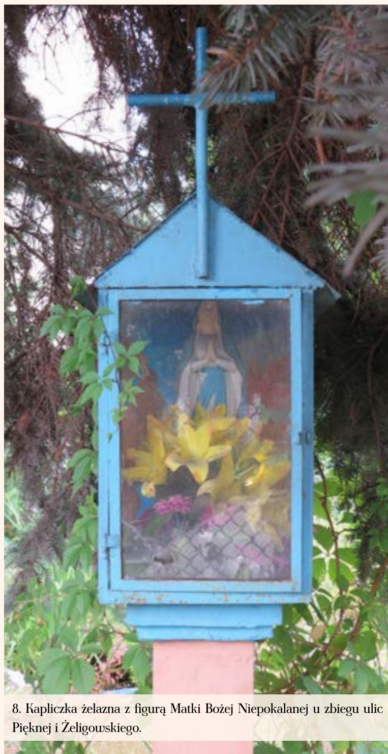
8. Kapliczka żelazna z figurą Matki Bożej Niepokalanej u zbiegu ulic Pięknej i Żeligowskiego.