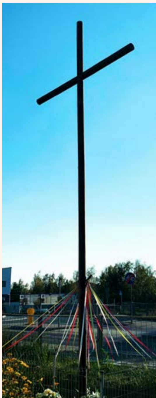
12. Krzyż drewniany przy rondzie im. Harcerzy Szarych Szeregów w Chotomowie.