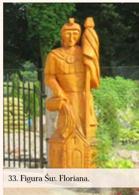
33. Figura Św. Floriana.