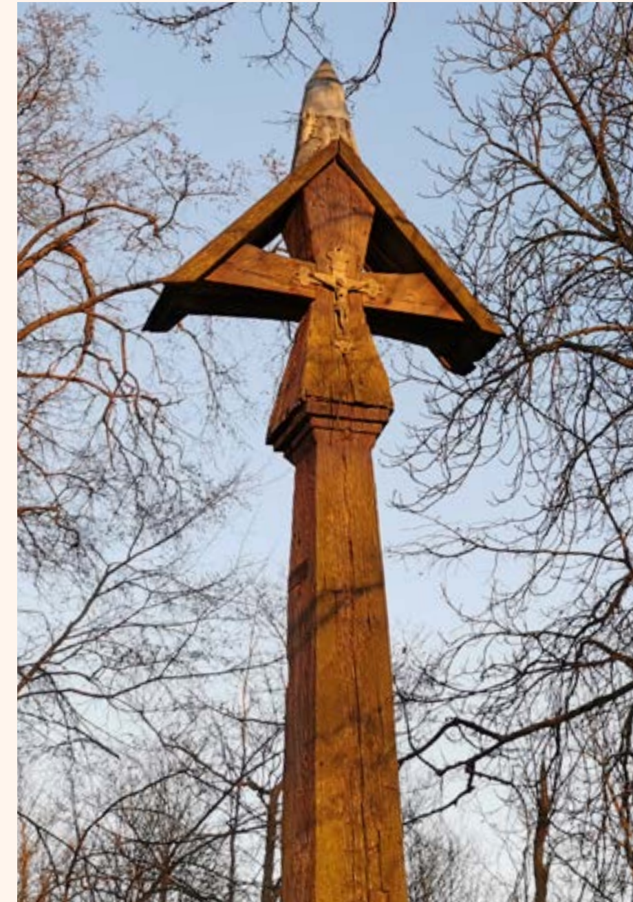
Krzyż drewniany z figurą Chrystusa przy kościele pw. Wniebowzięcia Najświętszej Maryji Panny w Chotomowie. Krzyż został wybudowany w 1826 r. na terenie ówczesnego cmentarza.