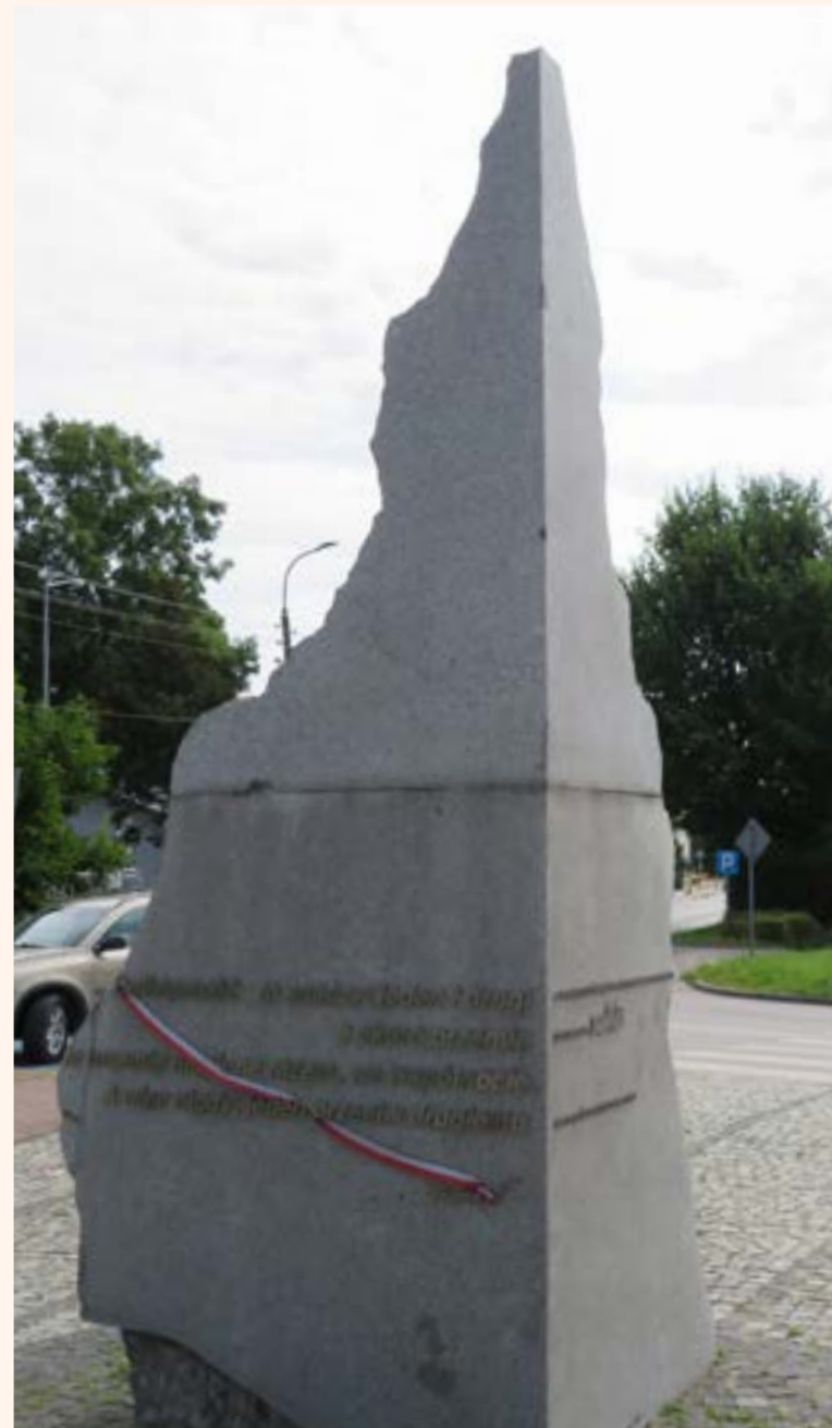
79. Obelisk poświęcony pamięci Jana Pawła II i 25-lecia „Solidarności”, umiejscowiony przed Gminnym Centrum Kultury w Jabłonce, ul. Modlińska.