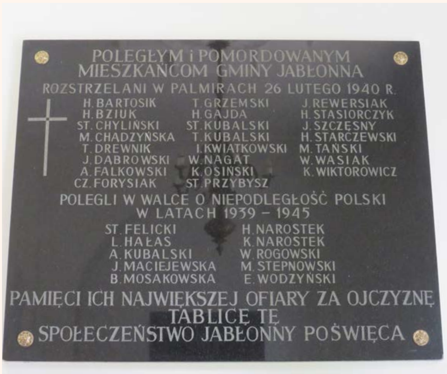
87. Tablica pamiątkowa w kościele pw. Matki Bożej Królowej Polski w Jabłonie poświęcona poległym i pomordowanym mieszkańcom Gminy Jabłonna, rozstrzelanym w Palmirach 26 lutego 1940 r. oraz poległym w walce o niepodległość Polski w latach 1939-1945.