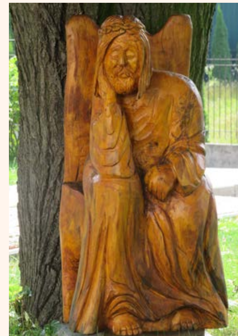
29. Rzeźba przedstawiająca Chrystusa Frasobliwego.