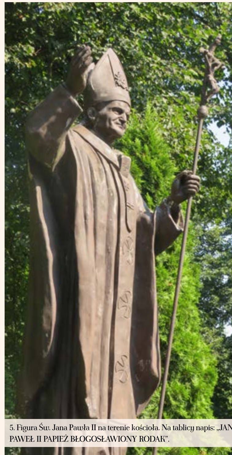
5. Figura Św. Jana Pawła II na terenie kościoła. Na tablicy napis: „JAN PAWEŁ II PAPIEŻ BŁOGOŚŁAWIONY RODAK”.