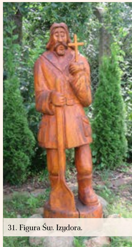
31. Figura Św. Izydora.