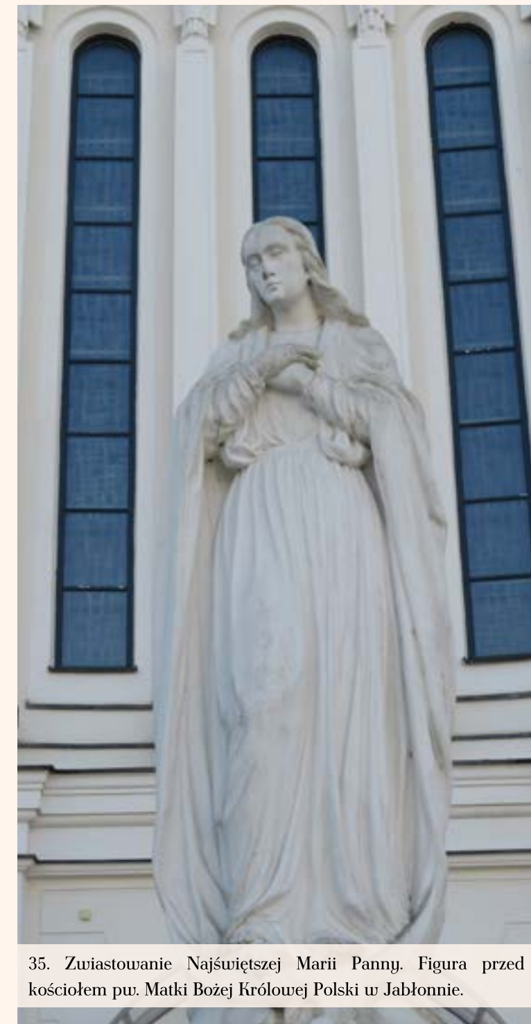
35. Zwiastowanie Najświętszej Marii Panny. Figura przed kościołem pw. Matki Bożej Królowej Polski w Jabłonie.