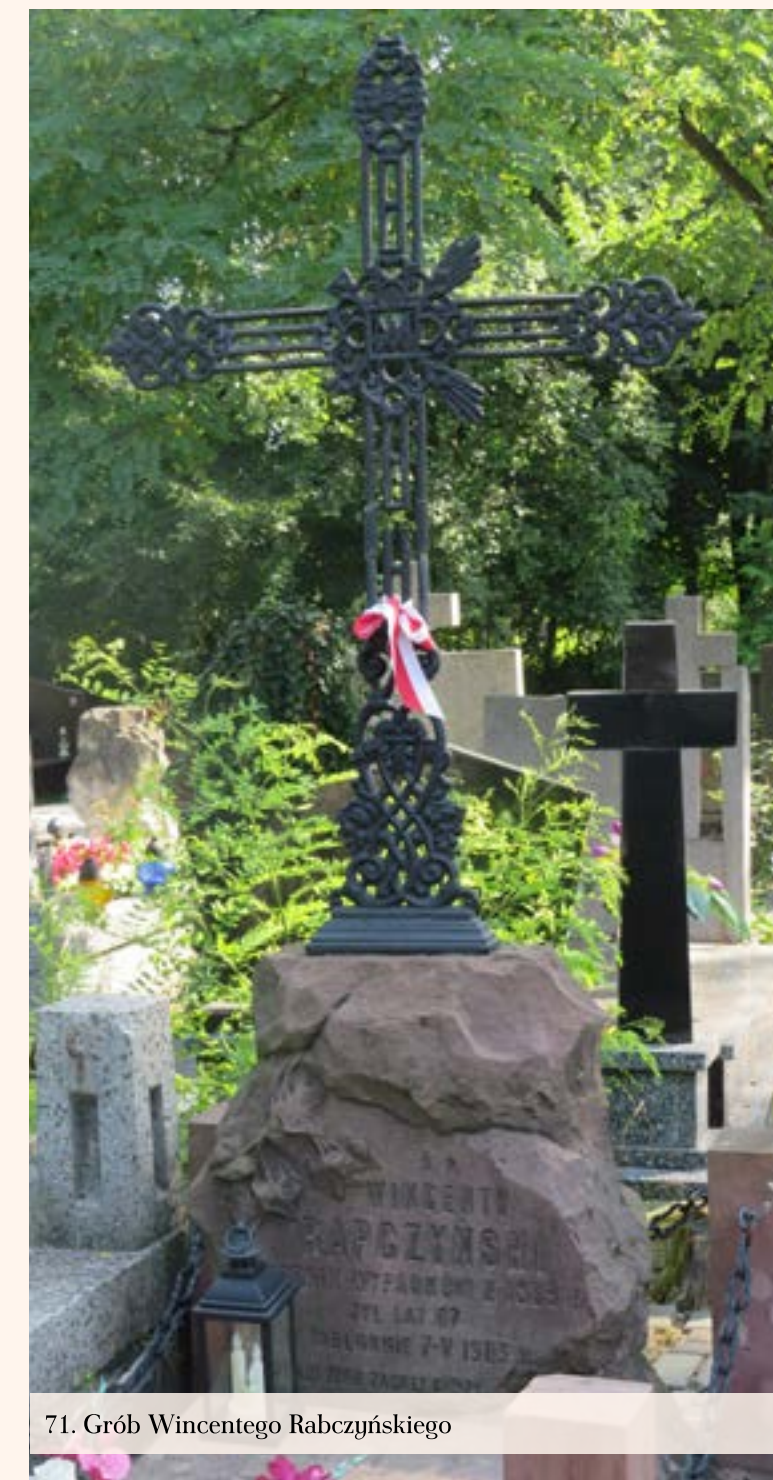
71. Grób Wincentego Rabczyńskiego