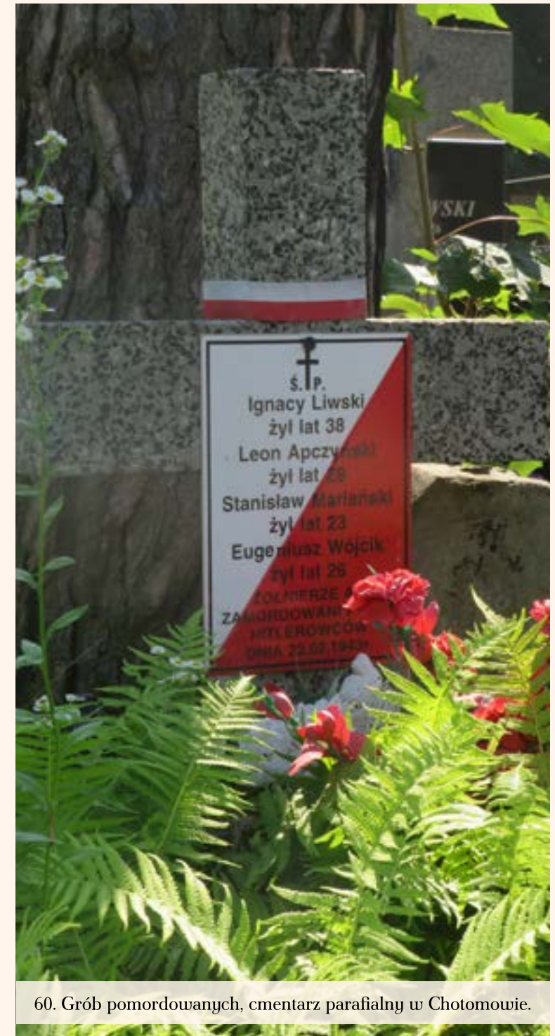
60. Grób pomordowanych, cmentarz parafialny w Chotomowie.

Ciała pomordowanych mężczyzn zostały przewiezione na cmentarz parafialny w Chotomowie i złożone do wspólnej mogiły (fot. 60). W miejscu kaźni ustawiono żelazny krzyż z tablicą, odsłonięty 16 września 1995 r. (fot. 61).