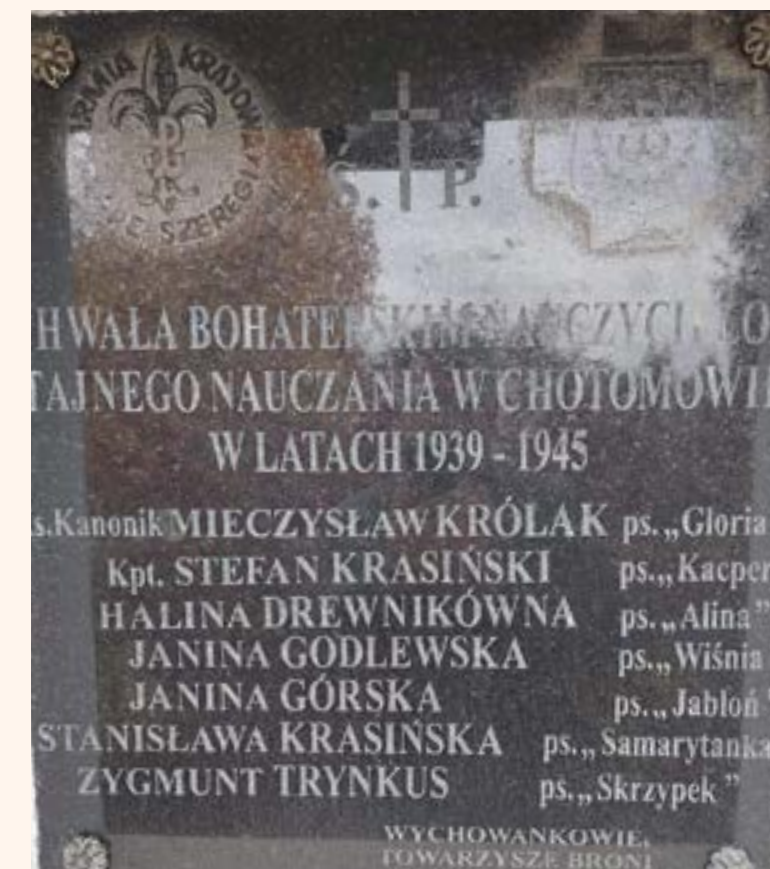
67. Tablica ku czci tajnego nauczania w Chotomowie na frontonie Szkoły Podstawowej Nr 2 im. Orła Białego, ul. Partyzantów.

Pomnik autorstwa Andrzeja Zbierchowskiego znajduje się na granicy Chotomowa i Legionowa w pobliżu miejsca walk. Został odsłonięty 1 sierpnia 1984 r. (fot. 69).