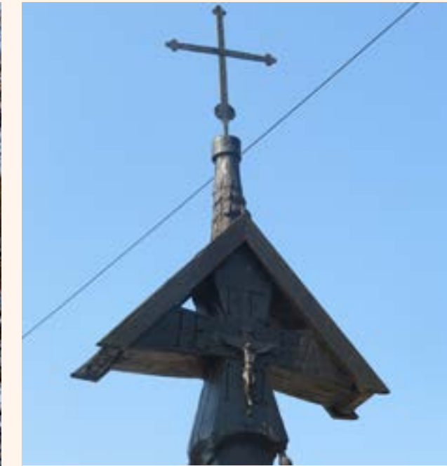
Krzyż drewniany w Jabłonie przy ul. Modlińskiej