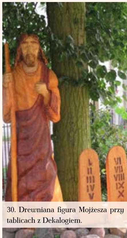
30. Drewniana figura Mojżesza przy tablicach z Dekalogiem.