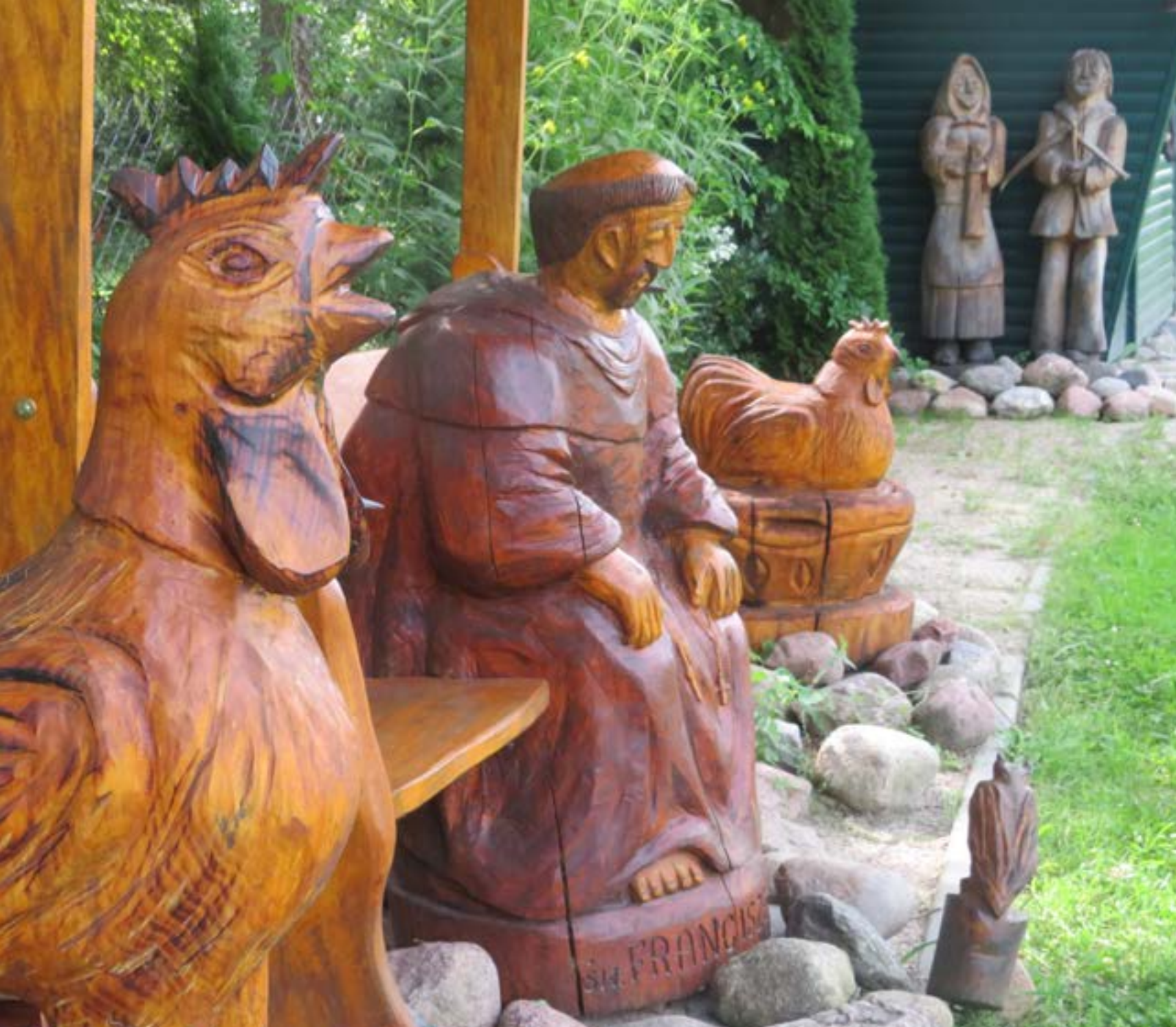
5a. Rzeźba przedstawiająca św. Franciszka ze zwierzętami przy kościele pw. Matki Bożej Królowej Polski w Jabłonie.