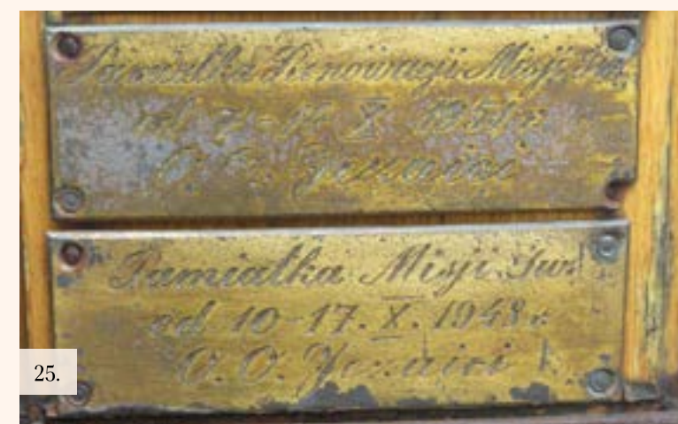
24, 25. Krzyż drewniany przy wejściu na teren kościoła pw. Matki Bożej Królowej Polski w Jabłonie, upamiętniający Misje Święte począwszy od 1948 r.