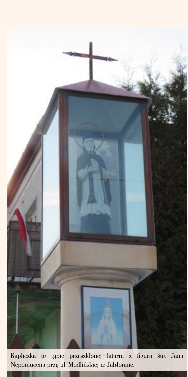
Kapliczka w typie przeszklonej latarni z figurą św. Jana Nepomucena przy ul. Modlińskiej w Jabłonie.