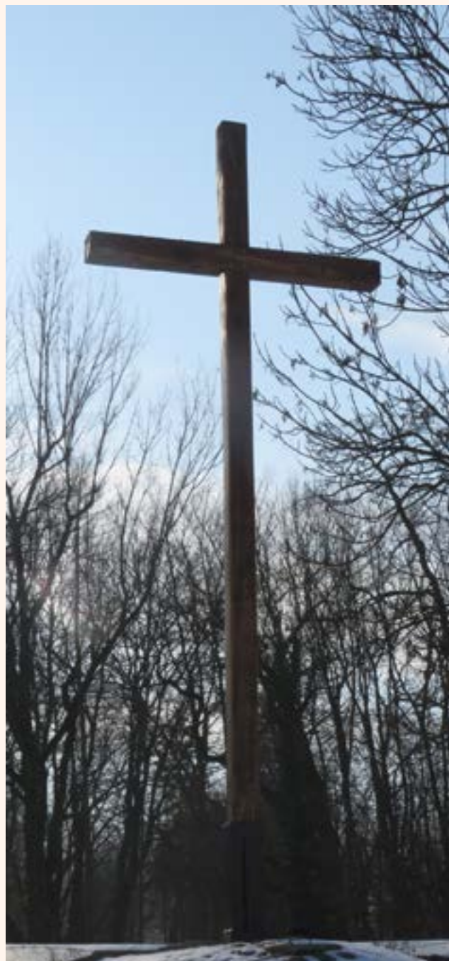
26. Krzyż drewniany na terenie przy kościele pw. Matki Bożej Królowej Polski w Jabłonnie.