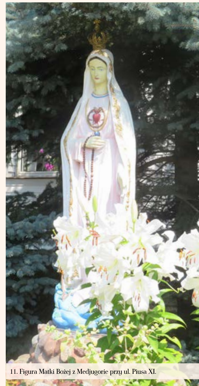
11. Figura Matki Bożej z Medjugorie przy ul. Piusa XI.