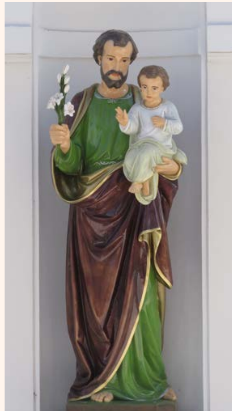
8a. Św. Józef z Dzieciątkiem przy kościele pw. Matki Bożej Królowej Polski w Jabłonie.