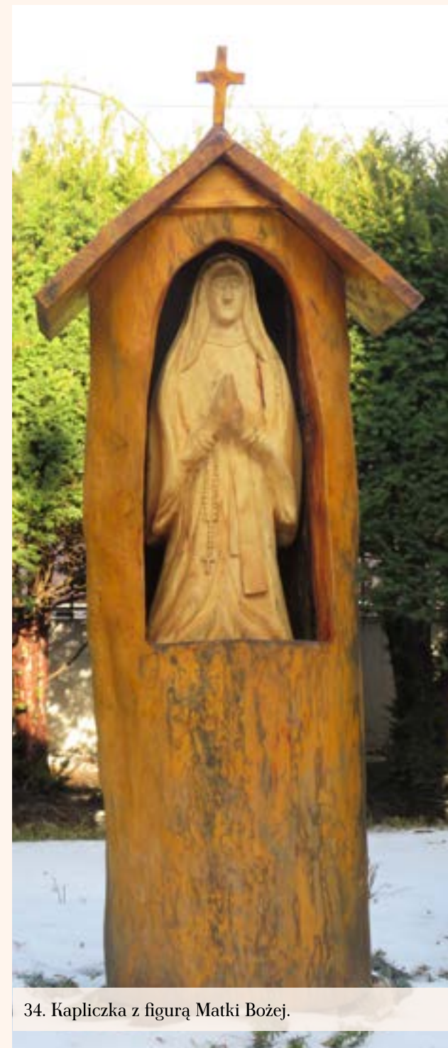
34. Kapliczka z figurą Matki Bożej.