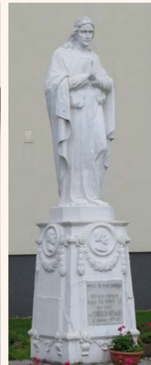
16. Figura Najświętszej Maryi Panny na terenie Domu Dziecka przy ul. Piusa XI. Na cokole napis: „OKAŻ SIĘ NAM MATKO 50-LECIE FUNDACJI OJCA ŚW. PIUSA XI DLA DZIECI W CHOTOMOWIE 6 CZERWCA 1973 R.”