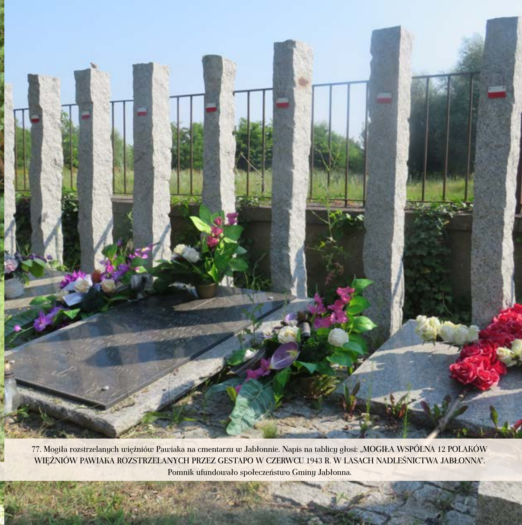
77. Mogiła rozstrzelanych więźniów Pawiaka na cmentarzu w Jabłonce. Napis na tablicy głosi: „MOGIŁA WSPÓLNA 12 POLAKÓW WIEŹNIÓW PAWIAKA ROZSTRZELANYCH PRZEZ GESTAPO W CZERWCU 1943 R. W LASACH NADLEŚNICTWA JABŁONNA”.

Pomnik ufundowało społeczeństwo Gminy Jabłonna.