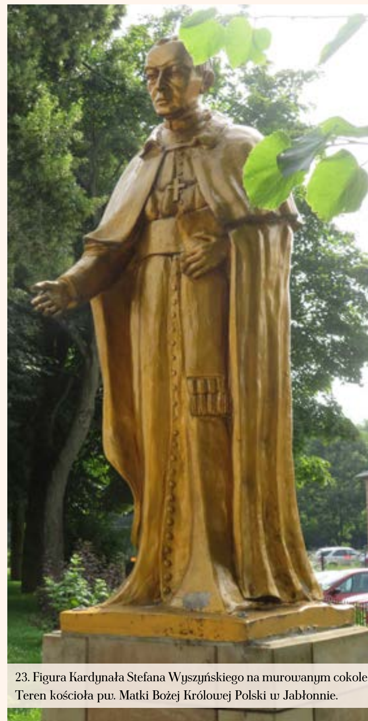
23. Figura Kardynała Stefana Wyszyńskiego na murowanym cokole. Teren kościoła pw. Matki Bożej Królowej Polski w Jabłonie.