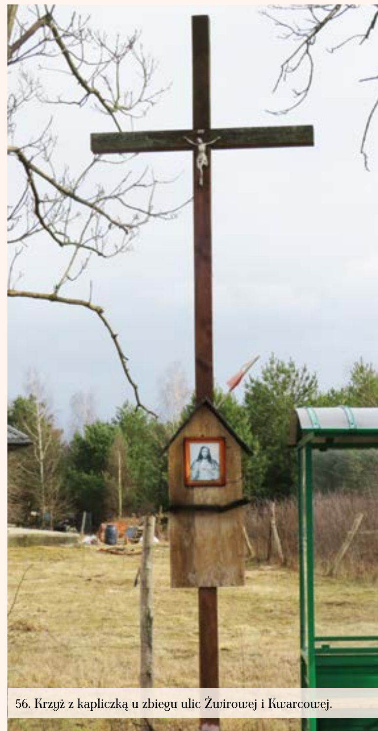
56. Krzyż z kapliczką u zbiegu ulic Źwirowej i Kwarcowej.