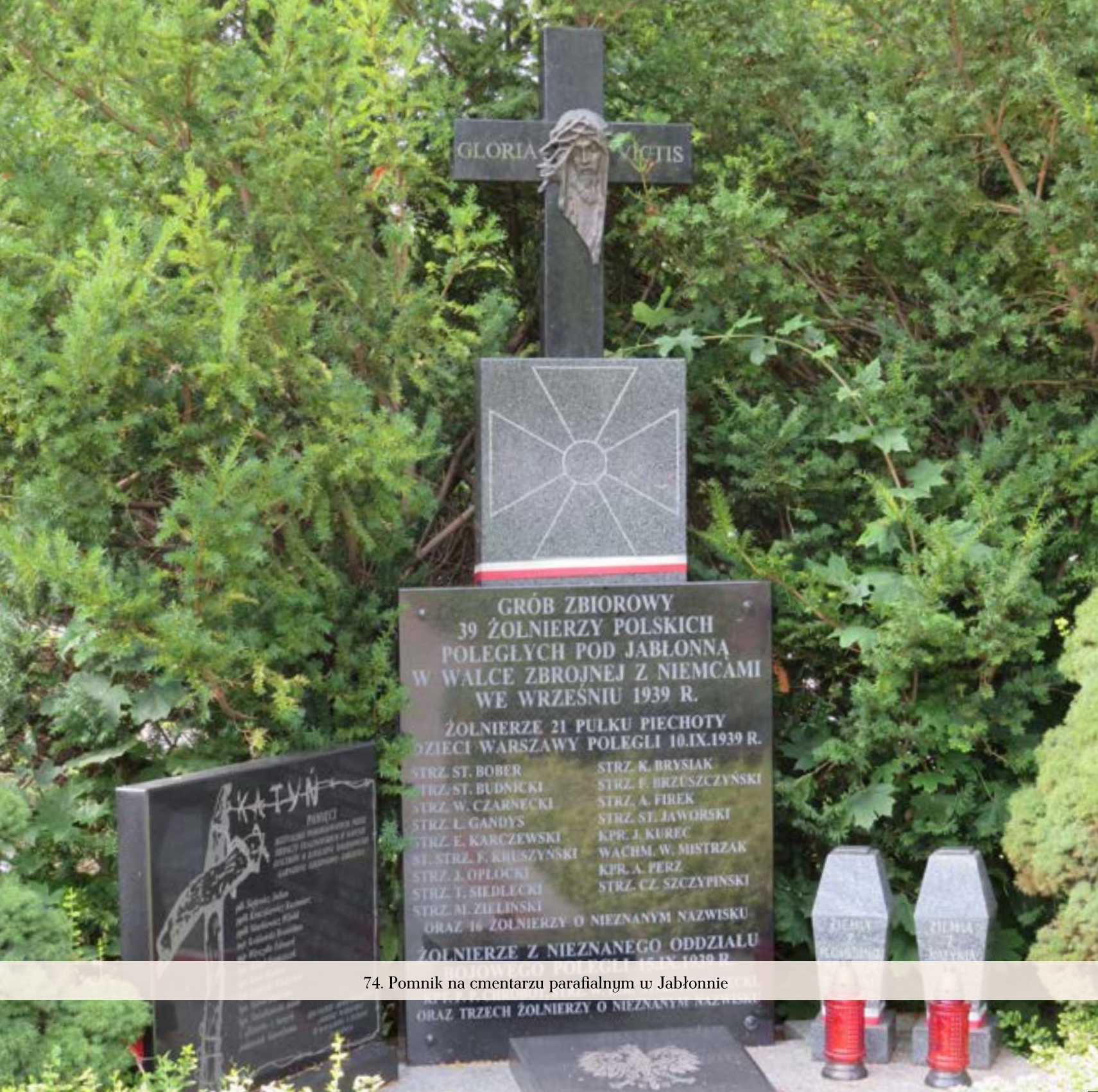
74. Pomnik na cmentarzu parafialnym w Jabłonce