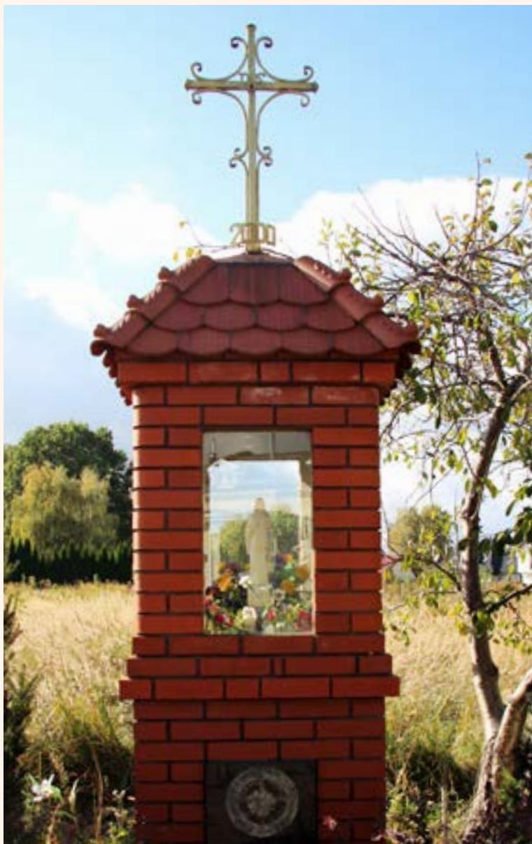
4a. 24 grudnia 1999 roku papież Jan Paweł II otwarciem Drzwi Świętych zainaugurował Wielki Jubileusz Roku Świętego 2000, który trwał do wigilii uroczystości Objawienia Pańskiego 5 stycznia 2001 roku. Kapliczka murowana u zbiegu ulic Osiedle Słoneczna Polana i Leśnej w Jabłonnie powstała na pamiątkę tego wydarzenia.