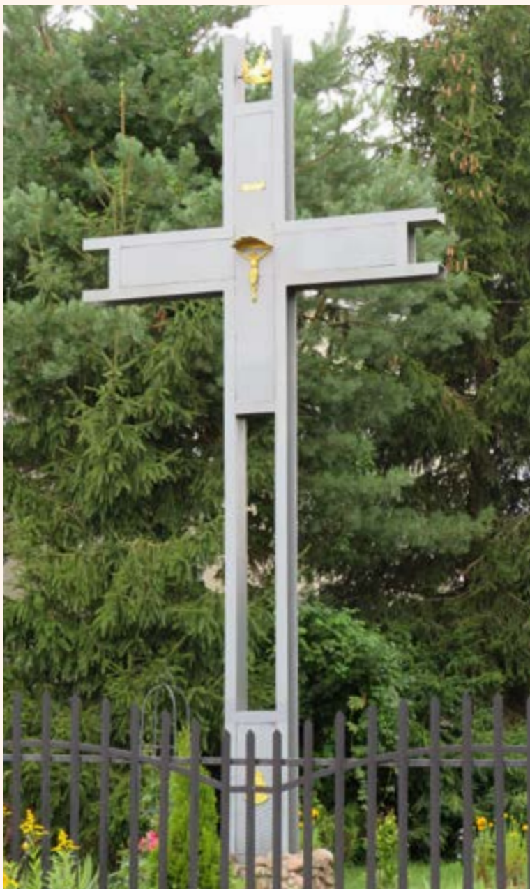
3, 4. Krzyż z figurą Chrystusa przy ul. Piusa XI. W dolnej części pionowej belki ryngraf z wizerunkiem Matki Boskiej Częstochowskiej ustawiony na cokole z kamieni polnych, ogrodzony żelaznym płotkiem.

Chotomowscy strażacy uczcili swojego patrona, Św. Floriana. Święty strzeże budynku Ochotniczej Straży Pożarnej, zaś obok ustawiono tablicę poświęconą zasłużonym druhom strażakom z OSP Chotomów (fot. 15).