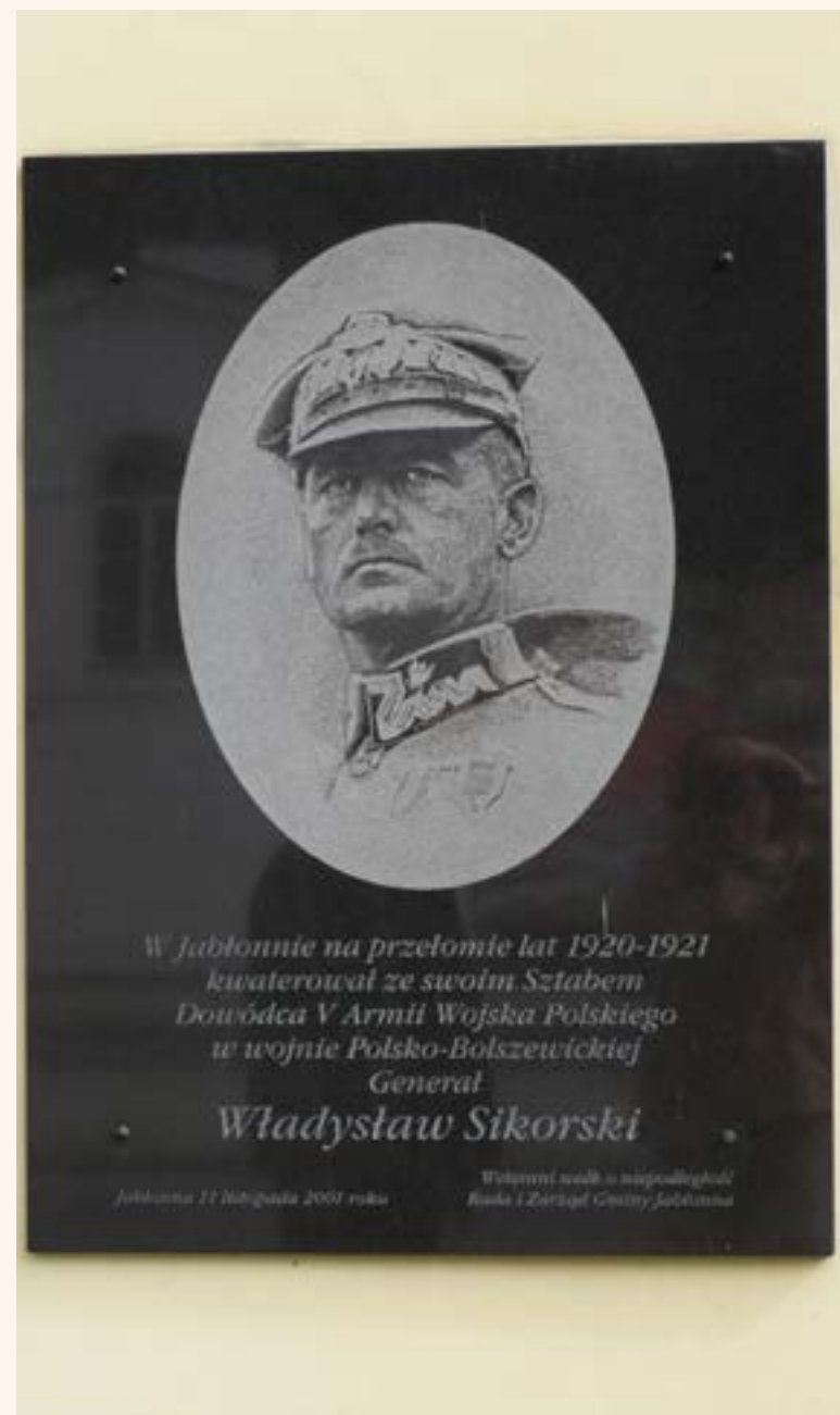
86. Płyta na budynku Urzędu Gminy Jabłonna upamiętniająca pobyt gen. Władysława Sikorskiego, odsłonięta 11 listopada 2001 r. Tablicę ufundowali weterani walk o niepodległość oraz Rada i Zarząd Gminy Jabłonna.