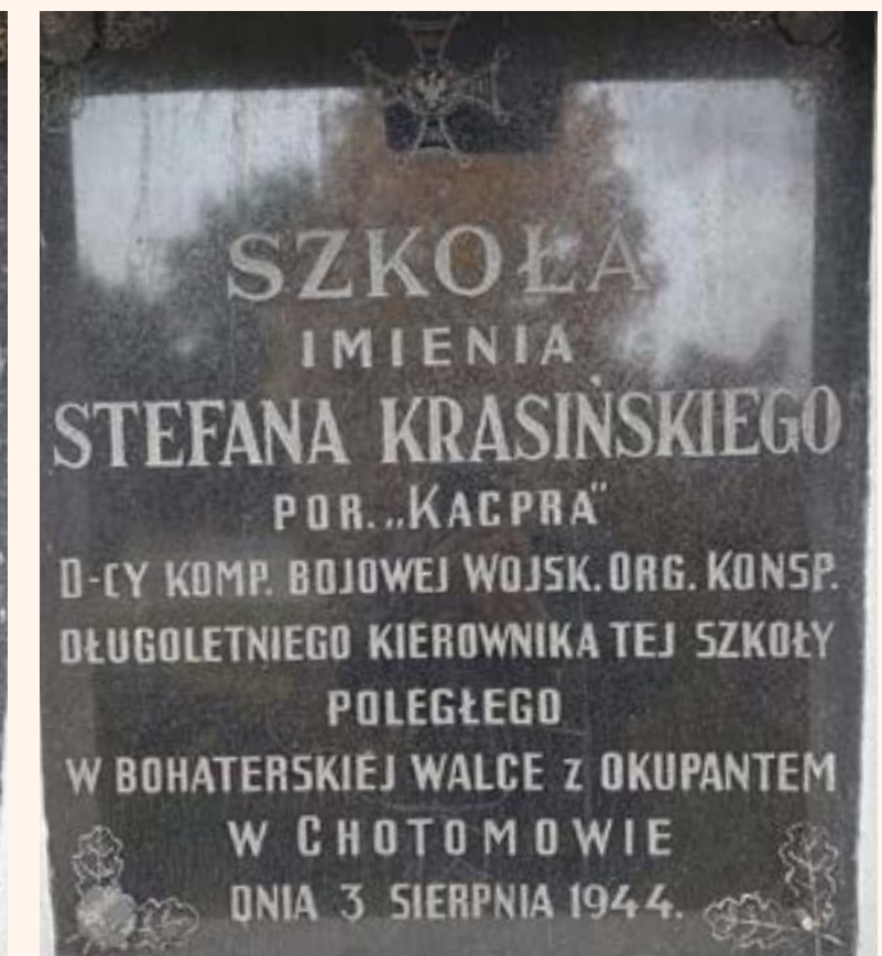
68. Płyta upamiętniająca nadanie 31.03.1947 r. Szkole Podstawowej w Chotomowie imienia Stefana Krasieńskiego ps. KACPER.